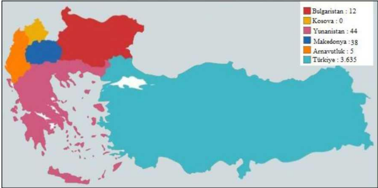
Harita -2 Osmanlı Coğrafyasında Günümüz Ülkelerine Göre Kurulan Vakıf Sayıları