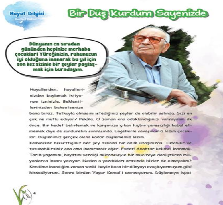
Şekil 4. Kardelen Dergisi 83. sayı Hayat Bilgisi Bölümü

Dergilerde yer alan sayılar metin türü açısından incelendiğinde her sayıda ortalama 6 bilgilendirici metin, 3 hikâye edici metin ve 1 şiir türüne yer verildiği bulgusuna ulaşılmıştır. Çocukların her sayıda farklı metin türleriyle karşılaşmasının bilişsel ve duyuşsal gelişimlerine olumlu bir yönde etki edeceği düşünülmektedir.