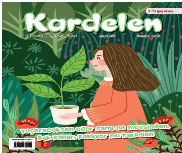
Şekil 3. Kardelen Dergisi 90. sayı ön kapak

Derginin sayılarının kapaklarında yer alan görseller, içeriği yansıtan bir formda oluşturulmuştur. Derginin sayılarının metin içeriği ile kapak içeriğinin tutarlı olduğu bulgusuna ulaşılmıştır. Derginin yayımlandığı ay, sayısı ve derginin imtiyaz sahibi olan derneğe ilişkin bilgiler kapak kısmında yer almaktadır. Dergi ücretsiz olarak sunulduğu için bir fiyatlandırma bilgisi kapak kısmında yer almamaktadır. Derginin hitap ettiği yaş grubuna 95. sayı itibari ile yer verilmeyerek kapak kısmından bu bilginin kaldırıldığı tespit edilmiştir. Derginin iç kapağı yazar, şair, düşünür, aydın kimlikli şahsiyetlerin özdeyiş ve mottolarını taşıırken 96. sayı itibari ile iç sayfa kaldırılarak içindekiler kısmına yer verilmiştir. Ayrıca derginin sayılarının sayfa aralığının 24-29 sayfa aralığında olması derginin taşınma, kullanılma ve saklanma durumlarını kolaylaştırmaktadır. Derginin arka kapak kısmına 85. sayıya kadar reklam metinlerinin yerleştirildiği ve bu sayı itibari ile reklam içeriğinin kaldırıldığı görülmüştür. Kapak kısmında derginin içeriği hakkında bilgi verildiği görülmektedir. Aşağıda ön kapak resmine ilişkin örneğe yer verilmiştir.