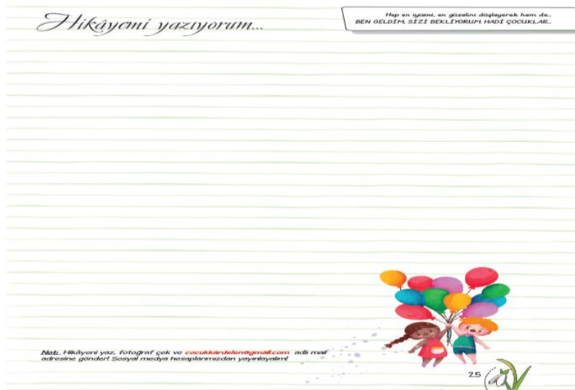
Şekil 5. Kardelen Dergisi 83. Sayı Hikayemi Yazıyorum Bölümü

Dergilerde yer alan sayılar metin türü açısından incelendiğinde her sayıda ortalama 6 bilgilendirici metin, 3 hikâye edici metin ve 1 şiir türüne yer verildiği bulgusuna ulaşılmıştır. Çocukların her sayıda farklı metin türleriyle karşılaşmasının bilişsel ve duyuşsal gelişimlerine olumlu bir yönde etki edeceği düşünülmektedir.