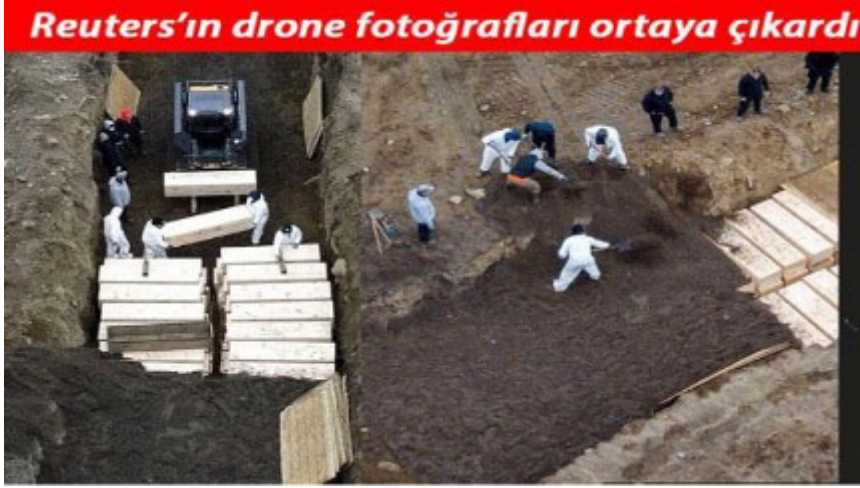
Resim 13. Rusya’da Toplu Mezar ve Defin Görüntüsü