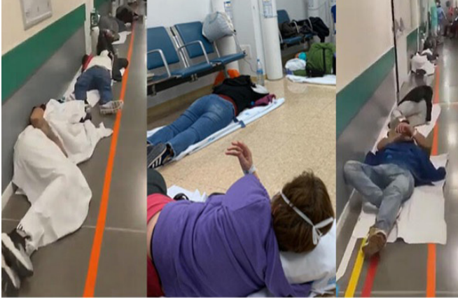
Resim 10. İspanya'da Hastalar Yerlerde Yatarken