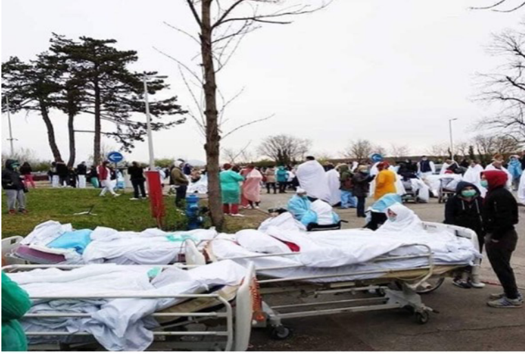
Resim 9. İtalya'da Hastalar Sokaklara Yatırılırken Kaynak: (URL-17).

Virüsün görüldüğü ülkelerde sokağa çıkma yasaklarının getirilmesiyle birlikte insanların marketleri yağmalama görüntüleri de medyaya yansımaya başlamıştır. Bu görüntüler insanlarda virüs korkusunun yanı sıra aç kalma korkusunun da eşlik ettiğini göstermiştir. Tuvalet kâğıtlarının karaborsaya düştüğü ve kavgalara neden olduğu görüntüler, boşaltılmış yiyecek, içecek reyonlarının görüntüleri günlerce medyada yer almıştır. Bu imgeler dünyada domino etkisi yaratarak birçok insanı yiyecek ve içecek stoku yapmaya yöneltmiş, marketlerin yağmalanmasına neden olmuş, insanlarda temel ihtiyaçlarını giderememe ve aç kalma korkusunun oluşturduğu distopik bir dünya yaratmıştır. Görsellerde maskeli insanların boşalttığı market reyonları ve maskesiz kadınların alışveriş arabasına yüklenmiş olan tuvalet kâğıtları için kavga ettiği detaylar dikkat çekmekte, insanların psikolojisinin geldiği noktayı ifade etmektedir. İnceoğlu (2020), haberlerde “ölümcül”, “harap,” “korkunç” gibi sıfatlardan kaçınılmalı, gereksiz, abartılı veya manipülatif grafiklere ve fotoğraflara yer verilmemesi gerektiğini, panik yaratmanın dilde ve resimlerde kaygıyı artırabildiğini ifade etmektedir. Örneğin boş süpermarketlerdeki adeta yağmalanmış algısı yaratan görüntülerin gerginlik ve gereksiz paniğe yol açmaktadır (İnceoğlu, 2020: 634).