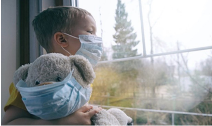
Resim 12. Maske Taktığı Ayıcığı İle Sokağı İzleyen Karantinadaki Bir Çocuk