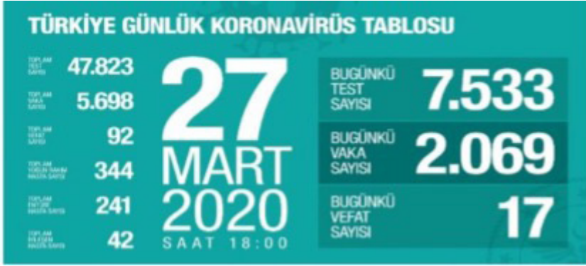
Resim 14. İlk Korona Virüs Tablosu

Salgın nedeniyle alınan önlemler kapsamında birçok ülke kendi sınırları içinde bazı yasaklar getirmiştir. İnsanların fiziksel temasını azaltmak amacıyla “Evde kal” çağrıları yapılmış ve insanların gönüllü olarak evlerinde kalmaları istenmiştir. Bu çağrıların yeterli olmadığı durumlarda ise kısmi ya da tam zamanlı sokağa çıkma yasakları getirilmiştir. Yasaklar sonucunda şehirler, meydanlar ve sokaklar boşalmıştır. Doğal yaşamlarında yiyecek bulamayan hayvanlar sokaklarda yiyecek aramaya başlamıştır.