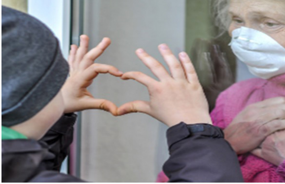
Resim 11. Yaşlı Bir Kadının ve Camın Arkasındaki Çocukla İletişimi, Kaynak: (URL-19).