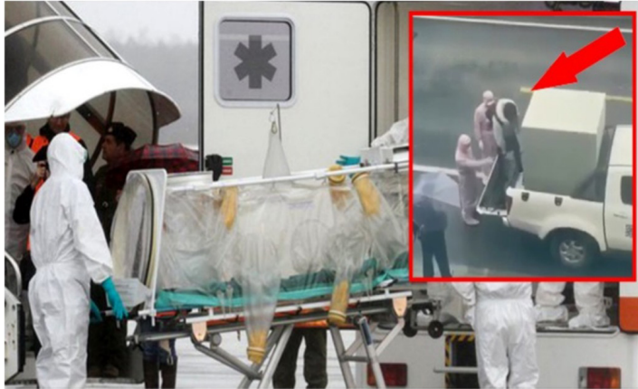
Resim 3. Zorla Karantinaya Alınan insanlar.

Medyada yer alan ve insanların hafızasına kazınan bir diğer görüntü ise cadde ve sokaklarda aniden yere yığılan ve virüsten dolayı ölen insan görüntüleri olmuştur. Görselde kaldırımında yatmakta olan maskeli bir erkek cesedi dikkat çekmektedir. 3. Görselde olduğu gibi bisikletli bir kadının yardım etmek yerine seyirci kalması ve erkeğin duyarsızca geçip gitmesi salgın korkusunun akıl almaz boyutlara ulaştığını, yardımseverlik duygusunun ise yerini bencillik duygusunun aldığını ve ölümün ne kadar kanıksandığını göstermektedir. Yardım etmek için gelen sağlık ekiplerinin yerde yatan kişiye korumalı kıyafetlere rağmen mesafeli durması virüsün bulaşma riskinin ne kadar yüksek olduğunu gözler önüne sermektedir. Savunmasız insanlar adeta potansiyel “ölümcül mikrop taşıyıcıları” olarak gösterilerek, yalnız ırkçılık ve nefret değil, aynı zamanda korku kültürünü de yaratmaktadır (Giritlioğlu, 2020).