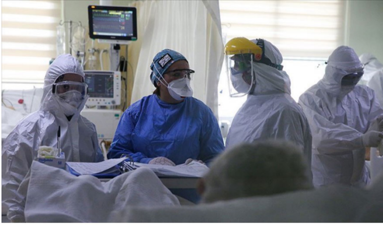
Resim 1. Korumalı Kıyafetli Sağlık Görevlileri ve COVID-19 Hastası Kaynak: (URL-10).