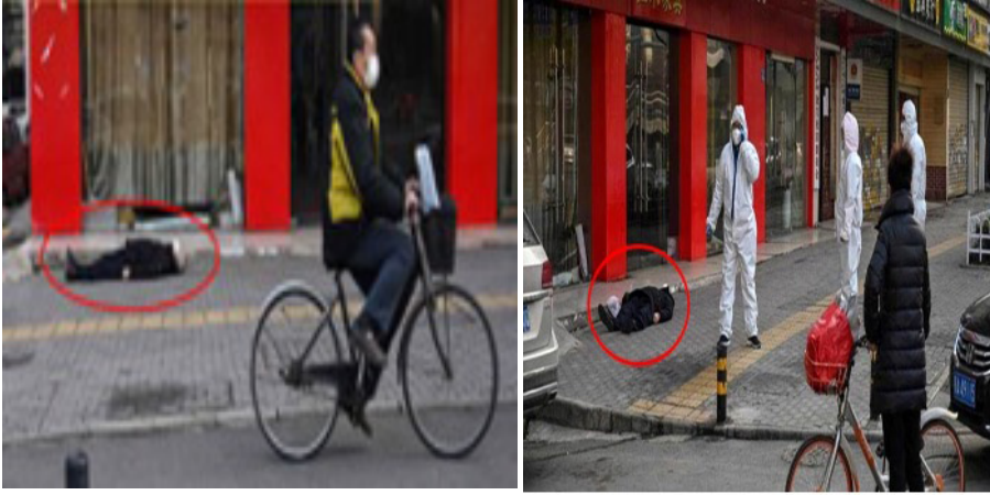
Resim 2. Kaldırımda Yatan Ceset ve Diğer İnsanların Tutumu