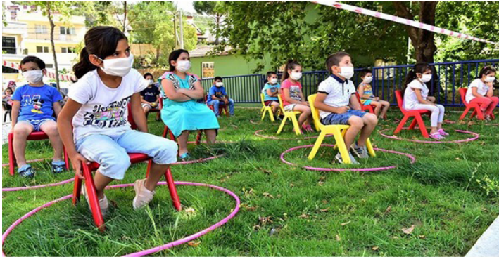
Resim 12. Salgın Sürecinde Yüz Yüze Eğitim Almaya Çalışan Çocuklar