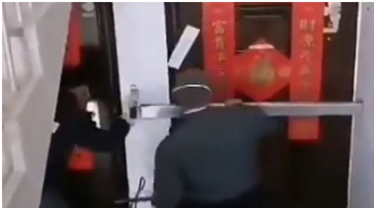
Resim 4. Karantinaya Alınan ve Mühürlenilen Bina Girişi