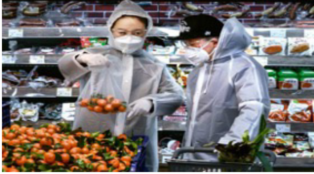
Resim 7. Markette Korumalı Kıyafetlerle Alışveriş Yapan İnsanlar