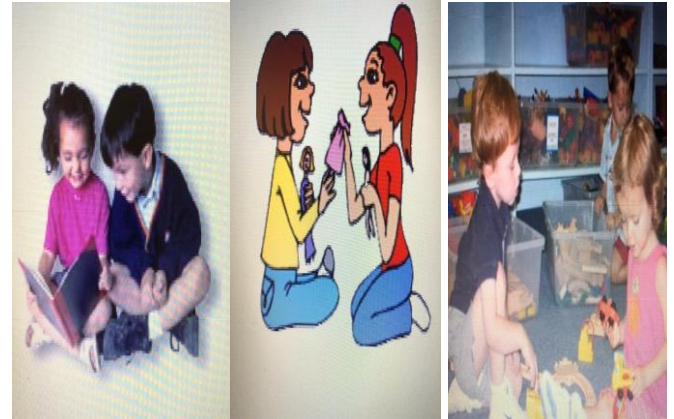
Şekil 1. Ev ödevleri ile aile çalışmaları (Akgünlü ve ark., 2005).

Yaşlılık literatürde “ihtiyar” anlamında kullanılmaktadır. Yaşlılık kavramının belirli bir sınır hangi yaşta başladığı olmadığı gibi, toplumda tecrübeli veya deneyimli, güngörmüş olgun insan olma özelliğini taşımaktadır. Genel olarak bakıldığında yaşlılık dönemi durağan bir yaşam döngüsü olan bireyin fiziksel, psikolojik ve sosyal açılardan özgür hareket etmeyi kısmen yitirdikleri, yaşamın birçok alanında çeşitli travmaların olduğu bir dönemdir. Yaşlılar bu dönemlerinde en büyük destekçileri yakınlarının onlara verdiği değer yaşamlarında daha rahat yaşamalarına yardımcı olmalarını psikolojik anlamda rahatlamalarına yardımcı olabilir. Sosyal etkileşimler sonucu bireyin kendi zihninde kurduğu bazı düşünceler ve düşler kişilik algısını oluşturmaktadır. Bireyin, kişilik algısının, sosyal çevrenin etkisiyle şekillenir ve buna paralel olarak gelişen benlik saygısının, birey için önem teşkil etmektedir. Yaşlı bireyler toplumda ailesinde veya kendisini değerli görmesi ya da kendisini bir birey olarak kabul ettirmesinde ve huzurlu bir hayat sürmesinde kişilik algısı önemli rol oynamaktadır. Yaşlıların kendi ailelerinde uzak kalması çevre etkileşiminin azalması sonucunda kişilik algısı düşebilir. Bu algının yaşam doyumu ve sağlıklı yakından ilişkili olduğu bilinmektedir. Kısacası kişilik algısının oturması kaliteli veya kalitesiz zaman geçirmesi önemli bir faktör olmuştur (Uzun, 2020).