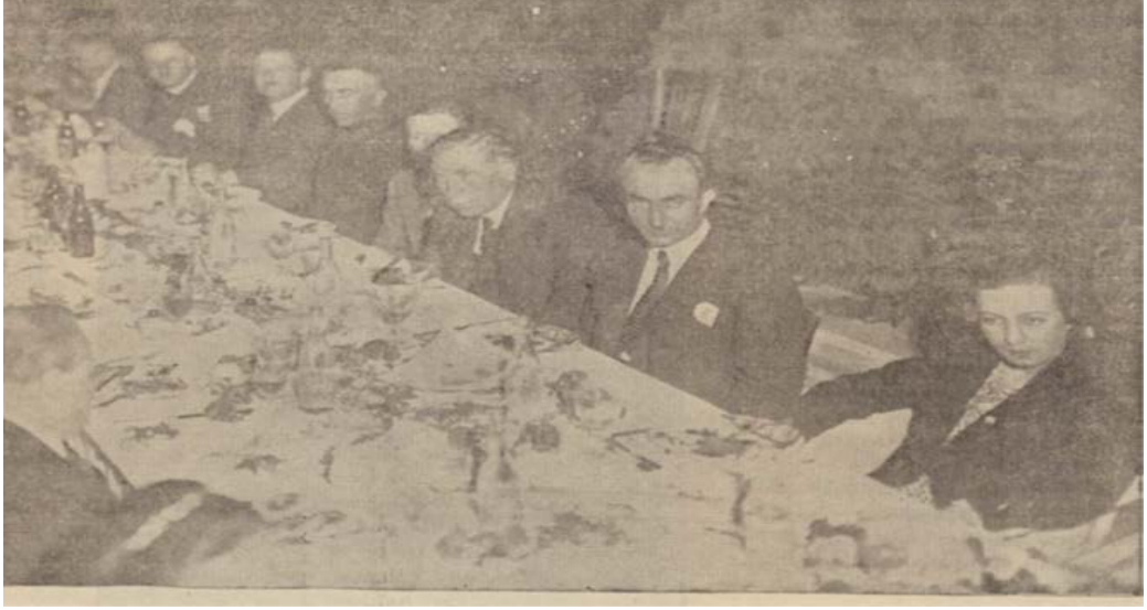
İzmir Türk Tarih Kurumu üyeleri adına verilen şölen. Yeni Asır, 18 Eylül 1935.