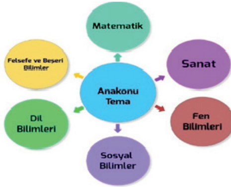
Şekil 1 Disiplinler Arası Kavram Modeli

Disiplinler arası yaklaşımda birbirinden farklı disiplinlere çok yönlü bakabilme becerisinin yanında öğrencilerin sosyal hayatta karşılaşabilecekleri sorunları analiz etme ve bu sorunlara farklı çözüm yolları bulabilme becerilerinin de geliştirilmesi amaçlanmaktadır. Jones (2009) araştırmasında disiplinler arası yaklaşımın bireyin hayatı boyunca öğrenme becerilerini geliştirdiğini ve öğrencilerdeki eleştirel düşünme, iletişim, yaratıcılık ve akademik yönlerin gelişmesine etki ettiğini belirtmiştir. Bu yaklaşımda merkeze alınan bir tema etrafında belirli disiplinler vardır ve her disiplin kendi alanında ilişkilendirilerek farklı bakış açılarıyla öğrencilere bilgi ve beceriler kazandırılır. Disiplinler arası ilişkilendirmelere örnek olarak seçilen temel bir konunun diğer bilim dallarıyla ilişkilendirilmesini anlatan şekil aşağıda gösterilmiştir (bk. Şekil 1):