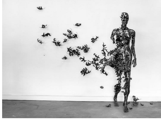
Resim 5. Regardt van der Meulen, Ayrışma, Yumuşak Çelik Heykel, 180 x 280 x 100 cm. 2015

Geleneksel halıyı bağlı bulunduğu sınırlardan kopararak yeni kavram ve form ilişkileriyle yapılandıran sanatçı, halının güncel sanat ortamında postyapısalcı felsefeye dayalı yapıbozumcu sanat anlayışı ile var olmasını sağlamıştır. Faig Ahmed'in halının yalnızca belirli yüzey alanlarını yıkıma uğrattığı görsel çözümler, halının geçmiş kodlarına gönderme yapmıştır. Geçmiş ve şimdi arasında biçim ve anlam yönüyle sorgulama yapılmasına olanak tanıyan dinamik yapı, varlığın muğlaklığını ortaya koyarak, sayısız çağrışım yapılmasına olanak sağlamıştır.