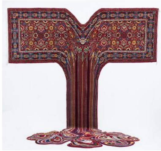
Resim 4. Faig Ahmed, Siddharta Gautama, El Yapımı Yün Halı, 285x380 cm, 2017

çıkarmak, nesnenin nasıl çalıştığını saptamak, karmaşık bir mekanik işleyişin, nasıl sınırlı bir yüzey alanına sığdığını çözümlenmek üzere sanatını yönlendirmiştir. Nesneye ilişkin mekanik parçaların dikkat çekici ve sezgisel dizimi, yapıbozuma dayalı uygulamalarda önemli bir aşamayı oluşturmaktadır. Şematik düzenin oluşturulduğu ilk aşama, izleyicilerin nesnenin bozulma sürecini sezinlemelerine yardımcı olmak üzere gerçekleştirilmiştir. Mekanik sistem içindeki her katmana ait parçaların ne derece farklılaştığını ortaya koymak, deneyimlenmesini sağlamak ve bu yönde bir farkındalık oluşturmak, sanatçının çalışmalarına yön veren temel amaçlar olarak ortaya çıkmıştır (Smith, 2016). Sökme, video çekme ve sökülen parçaların belirli bir düzende tekrar kurgulanması aşamaları, her bir mekanik parçanın farklı zaman, mekan ve form ilişkileriyle yeniden anlamlandırılmasını sağlayan eylemler olması yönüyle dikkat çekmiştir. McLellan yapıbozuma uğratan mekanik bir sistemin parçalarını, boşlukta ve serbest bir akış halinde süzülürken fotoğraflayarak dinamik, gerilimli bir görüntü kaydetmiştir. Fotoğraf ve videonun imkanları aracılığıyla kaydedilen görüntüler, kaos içinde nesnenin farklı bakış açıları ile yorumlanabileceği serbest bir atmosfer yaratmıştır. Sanatçının pratikleri, varlığın parça-bütün ilişkisi başta olmak üzere çok yönlü olarak düşünülmesi ve ele alınması gereken bir alan olduğunu ortaya koymuştur.