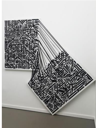
Resim 2. Sasan Nasernia, Kaligrafik Yerleştirme, 2018