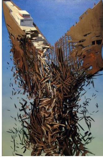
Resim 1. Ben Grasso, Mavna, Tuval Üzerine Yağlıboya, 50x70 cm, 2006

alanları, sanatçı eliyle çözümlenerek ayrıştırılmıştır. Oluşturulan sınırları açık muğlak ve parçalanmış bütünlük, yeni oluşumlara, söylemlere ve biçimlere zemin hazırlayan yapıya ulaşmıştır.