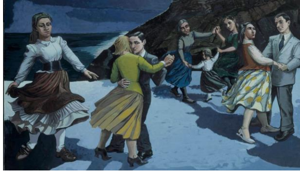
Resim 1. Paula Rego, Dans, 1988

Asıl adı Dame Maria Paula Figueiroa REGO olan sanatçı, Portekiz asıllı öncü bir ressamdır. Özellikle hikâye kitapları resimlerini andıran çalışmalarıyla tanınmaktadır. Bu durumun temelinde "olay" olgusu yatmaktadır. Çalışmalarında öncelikli olarak olay örgüsünü barındıran sanatçı, soyuttan temsile doğru giden stilini boya kullanımında da göstermiştir. Soyuttan temsile geçiş sürecinde hayatının büyük bölümünde kullandığı pastel boyalar yerine yağlı boya tercih etmiştir. Rego'nun çalışmaları Velazques'i anımsatırken, aynı zamanda da gerçek ve doğru kavramlarına paralel olarak yaratılmıştır.