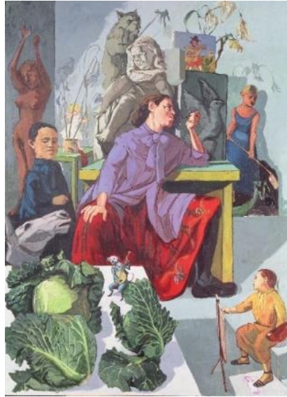
Resim 2. Paula Rego, Sanatçı Atölyesinde, 1993

Bu açıdan Paula REGO ve metamorfoz ilişkisi Deleuze'ün yaratıcı bir düşünce örneğiyle karşılaşmaktadır. Deleuze, hareketin temsilini sunmanın karşısına yaratıyı koymaktadır. Zira temsil, temel kanılar ve varsayımlar yaratmaktadır. Fakat Deleuze'ün felsefesi buna karşıttır. Deleuze için bir şeyler ortaya koymak, tamamen kaos sonucunda gerçekleşmektedir. Bundan dolayı dinginlik sağlayacak olan temsiller yerine genel varsayım ve tanımlardan uzaklaştıracak bir felsefi görüş gerekmektedir. Stabil olma durumuna karşı olan Deleuze'ün bu görüşünü Rego'nun çalışmaları, hareket olgusunun temsil değil metamorfoz yoluyla üretilmesinden dolayı karşılamaktadır. Deleuze, Hegel ve Nietzsche'de olduğu gibi hareketin bir temsilini değil, hareket olarak yaşamın tekil bir örneğini sunar (Uluger, 2016).