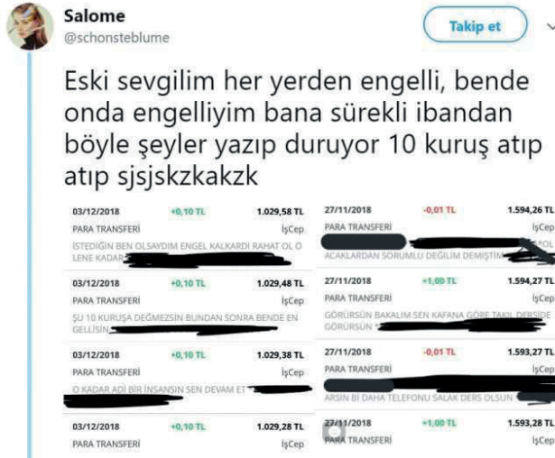
Şekil 1. Basit takıntılı ısrarlı takipçiyne örnek, (Kaynak: “Her yerden engelli”, 2023).

Şekil 1’de sunulan ekran görüntüsünde eski sevgilinin ayrıldığı kız arkadaşına yaptığı banka havalelerinin açıklama kısmında yazdıkları görülmektedir. Bu örnekte basit takıntılı takipçi profiline uygun görülen saldırı ile mağdur arasında önceden yaşanmış bir ilişki vardır ve taraflar birbirleri hakkında bilgiye (örnekte görüldüğü gibi banka hesap -IBAN-bilgisi) sahiptirler. Mağdur tarafından iletişime geçmesi engellenen yani literatürdeki karşılığıyla “ reddedilen ” eski sevgili IBAN üzerinden küçük meblağlarda (on kuruş) para transferi yaparak ısrarlı takip davranışında bulunmaktadır. Gönderilen havalenin açıklama kısmında erkeğin öfkesini ifade ettiği görülmektedir.