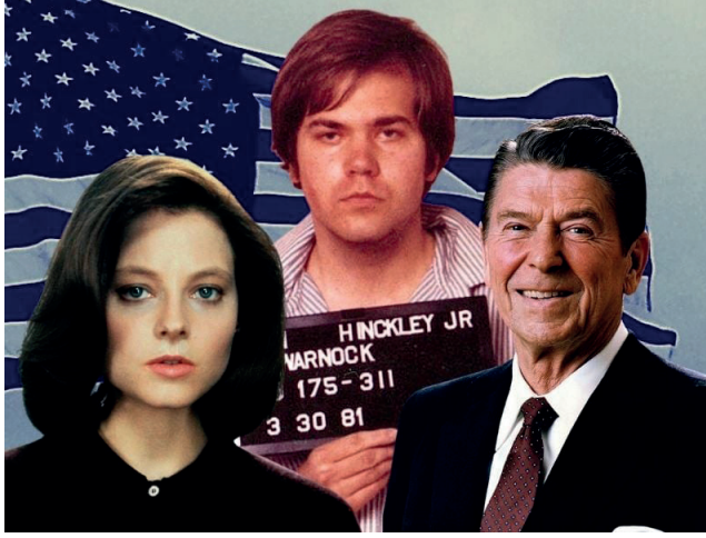
Şekil 4. Jodie Foster John Hinckley vakası (ortada fail John Hinckley, solda mağdur Jodie Foster, sağda mağdur Ronald Reagan), (Kaynak: “Jodie Foster”, 2021).

Şekil 4’te literatüre Jodie Foster John Hinckley vakası ( Jodie Foster John Hinckley case ) olarak geçmiş olayın faili John Hinckley (ortada) ve mağdurları Başkan Ronald Reagan (sağda) aktrist Jodie Foster (solda) görülmektedir. Vaka, 1981 yılında Hinckley’in aktrist Foster’ın dikkatini çekmek için o dönemin Amerika Başkanı Ronald Reagan’ı öldürmeye çalışmasına dayanmaktadır. Hinckley’nin “Taxi Driver” filmi izledikten sonra filmde rol alan Foster’a takıntı geliştirir. Aslında Hinckley’in takıntısı Foster’ın canlandırdığı fahişe karakterinedir. Hinckley ünlü aktörü etkilemek için ABD başkanı Ronald Reagan’a 30 Mart 1981’de suikast girişiminde bulunur (Meloy, 1998, s. 98-113). Hinckley’in Amerikan başkanına karşı böyle bir eylemde bulunması o dönemde oldukça sansasyon yaratmıştır.