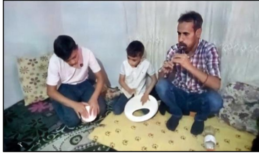
Resim 4. Ev ortamında Dom müzisyen baba ve çocukları (Yıldız, 2022)

Dom çocuklarının diğer etnik guruplardan farklı olarak, müziğin içerisinde doğmaları, müzikle olan zamanlarının çok daha fazla olması, dolayısıyla bu işle daha çok uğraşmalarından müzisyenlik mesleğine hâkimiyetleri de gelişmektedir (bkz. Resim4).