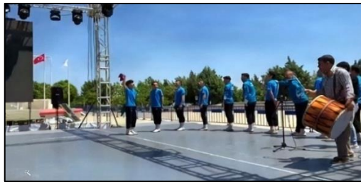
Resim 7. Dom müzisyenler halk oyunları yarışma öncesi hazırlık (Yıldız, 2022)