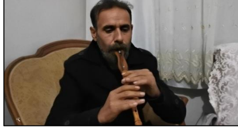
Resim 6. Dom müzisyen dilli kavalı seslendirirken (Yıldız, 2022)