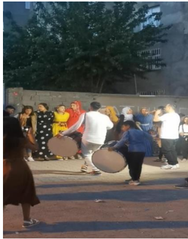
Resim 3. Dom çocuk müzisyen (Yıldız, 2023)

"2 oğlum var, bir tanesi henüz 10 yaşında bile değildi, babası davulu astı boynuna. Ve o yaştaki oğluma; çocuklar küçük, ben tek yetişemiyorum, ben zurnacıyım, sen de bana yardım et dedi.Babası zorla davulu astı boynuna. Davulu boynuna astığı zaman, davul boyunu geçiyordu. Yine de sen bunu çalacaksın diyordu. Yoksa biz aç kalacağız. Ekmek parası için, kalabalıktık ve geçinemiyorduk" (KK-3).