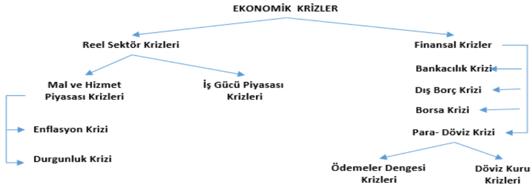
Şekil 1: Ekonomik Krizlerin Gruplandırılması (Kibritçioğlu, 2000: 2).

Amerika Birleşik Devletleri'nde bulunan Kriz Yönetimi Enstitüsü'ne göre krizler; " doğal afetler, mekanik problemlerin oluşturduğu krizler, insan hatalarından kaynaklanan krizler, yönetsel kararların/kararsızlıkların yol açtığı krizler " olmak üzere 4'e ayrılmaktadır (Yılmaz, 2008: 296). Ekonomik anlamda kriz ise; " herhangi bir mal, hizmet, faktör veya döviz piyasasındaki fiyat veya miktarlarda kabul edilebilir bir değişme sınırının dışında gerçekleşen dalgalanmalar " olarak tanımlanmaktadır (Kibritçioğlu, 2000: 1-2).