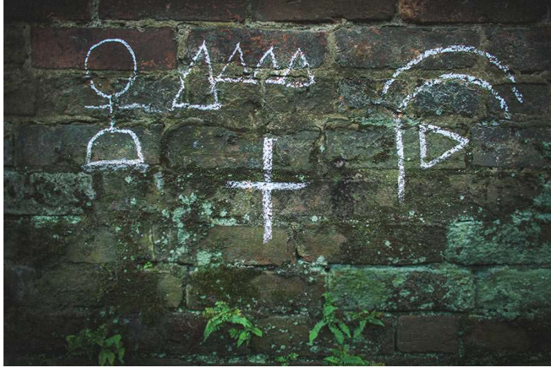
Görsel 2: “Hoş bir hanımefendi burada yaşıyor, yemekte dini konuşmalar yapacak ve sen buradaki çatı katında uyuyabilirsin.” anlamına gelmektedir (Buckholtz, 2016).