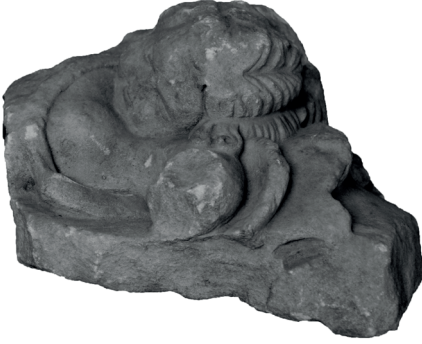
Görsel 4. Uyuyan Eros Yontusu (E.2)