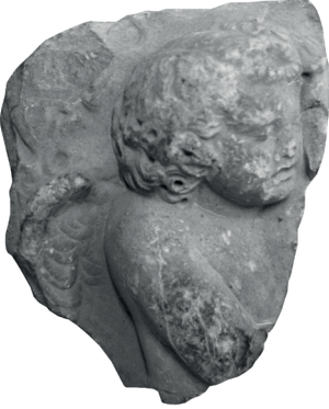
Görsel 1. Uyuyan Eros Yontusu (E.1)

Literatür taramalarını içeren araştırmalar sonucunda Mastaura ad Khrysaorium antik kentine ait plastik eserler ile ilgili herhangi bir çalışma bulunmadığı anlaşılmaktadır. Dolayısıyla bu çalışma içeriğinde ele alınan bir Eros yontusu (E.2), Mastaura antik kenti heykeltıraşlık eserlerinin temsili olarak sunulmaktadır.