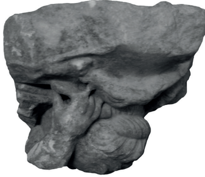
Görsel 6. Uyuyan Eros Yontusu (E.2)