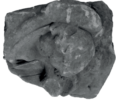
Görsel 5. Uyuyan Eros Yontusu (E.2)