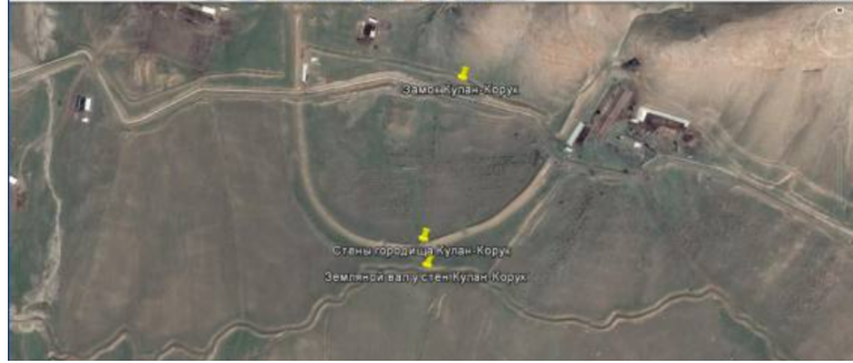
Resim 2: Chih-chih Ch'an-yü'nün kale-şehrinin kalıntıları olduğu düşünülen Kulan Koruk Yerleşim Yeri. http://kghistory.akipress.org/