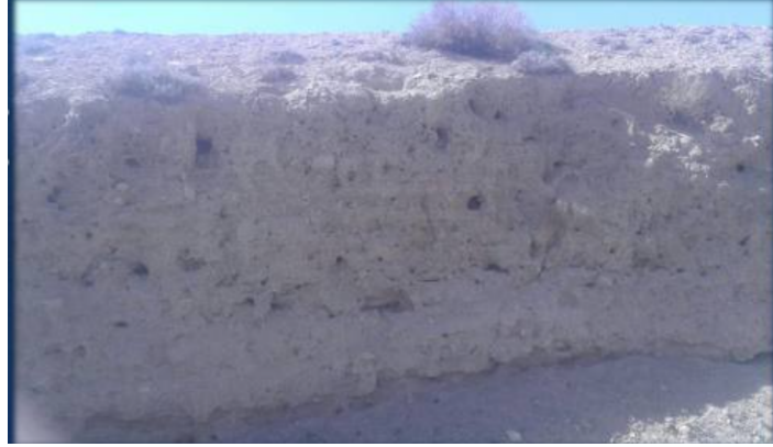
Resim 6: Tarihi kaynaklara göre Chih-chih Ch'an-yü'nün kale şehri olduğu düşünülen Kulan Koruk Yerleşim Yerinin Duvar Temeli.