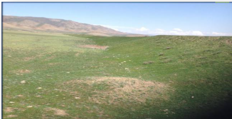
Resim 3: Chih-chih Ch'an-yü'nün kale şehri olduğu düşünülen Kulan Koruk Kale Duvarının Kalıntıları(Güney Tarafı). http://kghistory.akipress.org/