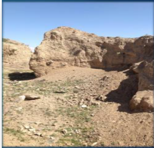
Resim 5 : Chih-chih Ch'an-yü'nün kale şehri olduđu düşünölen Kulan Koruk Yerleşim Yerinin Güney Kapısı Tarafında Bulunan Toprak Tabya Kalıntıları.