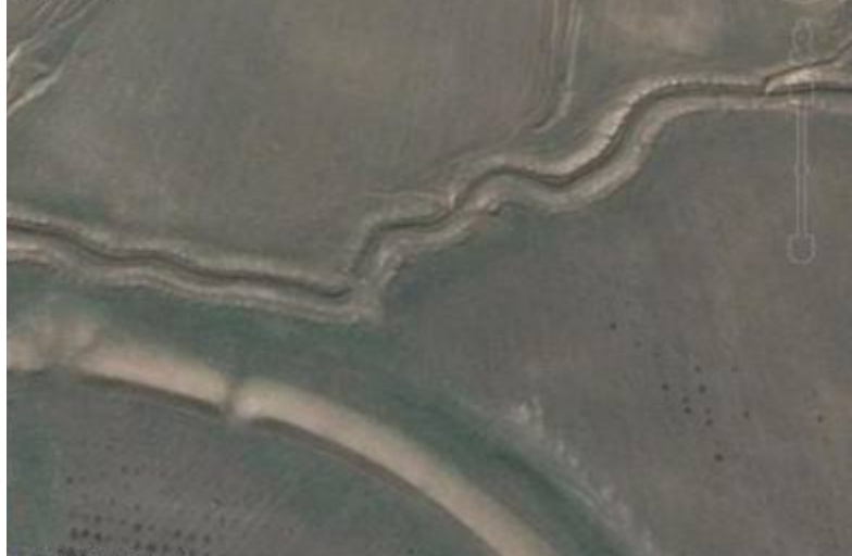
Resim 7: Tarihi kaynaklarla örtüşen Kulan Koruk'un Güney Kapısının Toprak Setleri. Böyle bir kalenin Türkistan'da muadili yoktur. Kulan Koruk, kadim bir şehir olan Chih-chih Ch'an-yü'nün kale şehridir.