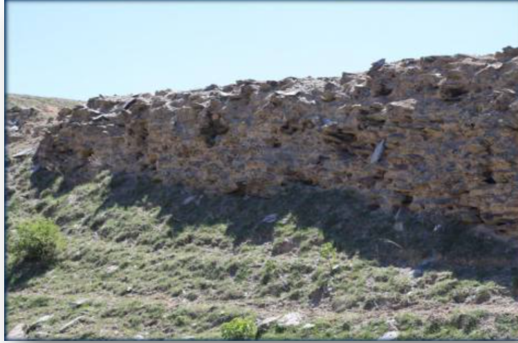
Resim 4: Chih-chih Ch'an-yü'nün kale şehri olduđu düşünölen Kulan Koruk Kale Duvarının Kalıntıları (Batı Tarafı).