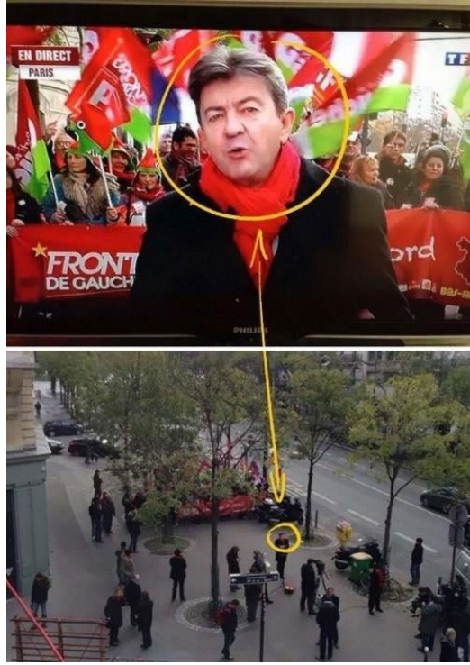
Görsel-5 Çerçeveleme kullanılarak yapılan manipülasyon.