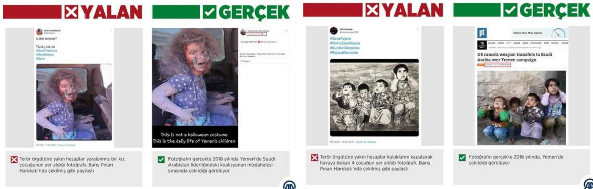
Görsel-7 Anadolu Ajansı tarafından gösterilen manipülasyon örnekleri (aa.com.tr)

Fotoğrafta manipülasyon yöntemlerinden bir diğeri ise fotoğrafın çekim açısıdır. Görsel-6'da Prens William'ın farklı açılardan çekilmiş fotoğrafları, açı farkı ile gerçekliğin nasıl manipüle edilebileceğini açık bir şekilde göstermektedir. Prens gerçekte sağ eliyle üç işareti yaparken diğeri açıdan olan fotoğrafta, basın mensuplarına el hareketi yapıyormuş gibi görülmektedir. Fotoğrafa hiçbir eklemecikartma yapmadan, bilgisayar yardımı ile üzerinde oynama yapmadan sadece açı farkı ile gerçekliğin değiştirilebileceği, fotoğrafçının etik ahlak ve ilkelere bağlı kalmasının önemini açık bir şekilde göstermektedir.