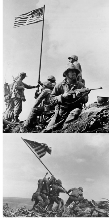
Görsel-8 İwo Jiwa 'da ilk çekilen fotoğraf ve daha sonra Joe Rosenthal tarafından tekrar çekilen fotoğraf.

Propaganda aracı olarak en çok kullanılan yöntemin kurgusal fotoğraf olduğu söylenebilmektedir. Bu yöntem ile yapılan propaganda çalışmalarında fotoğraf karesinin içindeki her şey, kurulmak istenen ideolojiye hizmet edecek şekilde tasarlandığı için en etkili yollardan biri olarak görülmektedir. Kurgusal fotoğrafta, fotoğrafçı gerçekte olmayan bir anı veya gerçekte yaşanmış olan fakat gerçekleştirilmesi ümit edilen propaganda etkisinden uzak olan bir anın tekrar canlandırılmasıyla oluşturulabilir. Bu konudaki artık ikonikleşmiş örnek ise 23 Şubat 1945 tarihinde Associated Press (AP) fotoğrafçısı Joe Rosenthal tarafından çekilen "Iwo Jima'ya Bayrak Dikilirken" adlı fotoğrafıdır.