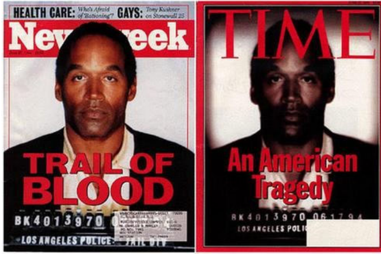
Görsel-4 Aynı fotoğrafın Newsweek ve Time dergilerinde kullanım

daha kolay ve ulaşılabilir olması, sonuçlarının çoğu zaman gözle tespit edilemeyecek kadar başarılı olması günümüzde çok daha yaygın bir biçimde kullanılmasına sebep olmuştur.