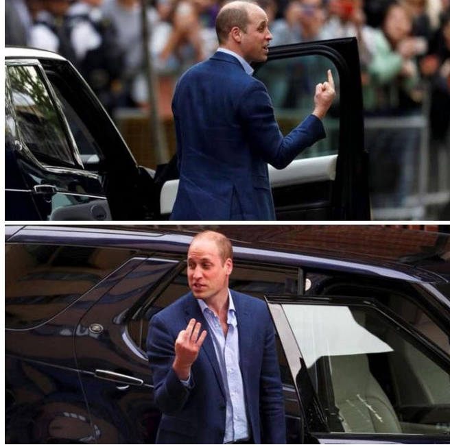
Görsel-6 Prens Williams'ın farklı açılardan çekilmiş fotoğrafı

Fotoğrafta manipülasyon yöntemlerinden bir diğeri ise fotoğrafın çekim açısıdır. Görsel-6'da Prens William'ın farklı açılardan çekilmiş fotoğrafları, açı farkı ile gerçekliğin nasıl manipüle edilebileceğini açık bir şekilde göstermektedir. Prens gerçekte sağ eliyle üç işareti yaparken diğeri açıdan olan fotoğrafta, basın mensuplarına el hareketi yapıyormuş gibi görülmektedir. Fotoğrafa hiçbir eklemecikartma yapmadan, bilgisayar yardımı ile üzerinde oynama yapmadan sadece açı farkı ile gerçekliğin değiştirilebileceği, fotoğrafçının etik ahlak ve ilkelere bağlı kalmasının önemini açık bir şekilde göstermektedir.