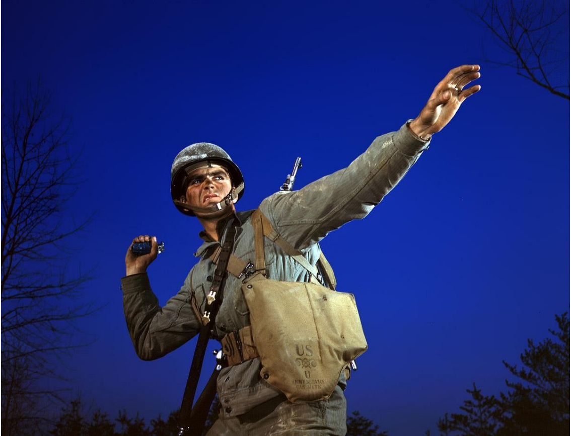
Görsel-9: American Pineapple, Alfred T. Palmer 1942. (loc.gov)

Gözünü sözde düşmana dikmiş olan askerin suratında kin, cesaret ve öfke ifadesi vardır. Fotoğrafın sol tarafında, bir bölümü görülen yapraksız ince bir ağaç bulunmaktadır. Fotoğrafın sağ tarafında ise üstten kadraja giren gene yapraksız ve ince bir dal parçası görülmektedir. Aynı zamanda, sağ alt tarafta ince yapraklı bir ağacın üst kısmı görülmektedir. Bu ağaca benzer, yan yana diziliş birkaç ağaç üst kısımları fotoğrafta çok az görülecek şekilde, fotoğrafın sağ tarafından sol tarafına doğru sıralanmıştır. Fotoğrafın sağ, sol ve alt kısmını çok az kaplayan ağaçlar ve merkezdeki askerin dışında kalan her yer lacivert gökyüzüdür. Fotoğrafın altında çok az görülen ağaçlar hariç hiçbir şey üst üste binmez. Şafak vakti alacakaranlıkta çekilen fotoğraf, sağ taraftan güçlü bir beyaz ışıkla, sol tarafından ise dolgu ışığıyla desteklenmiştir.