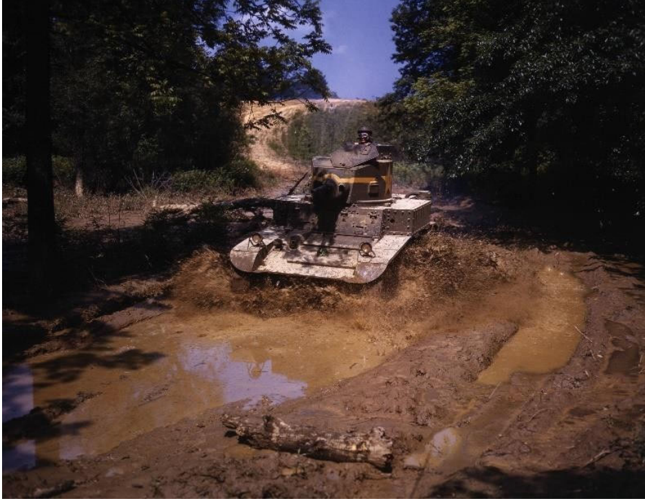
Görsel- 10: Light tank going through water obstacle', Alfred T. Palmer 1942. (loc.gov)