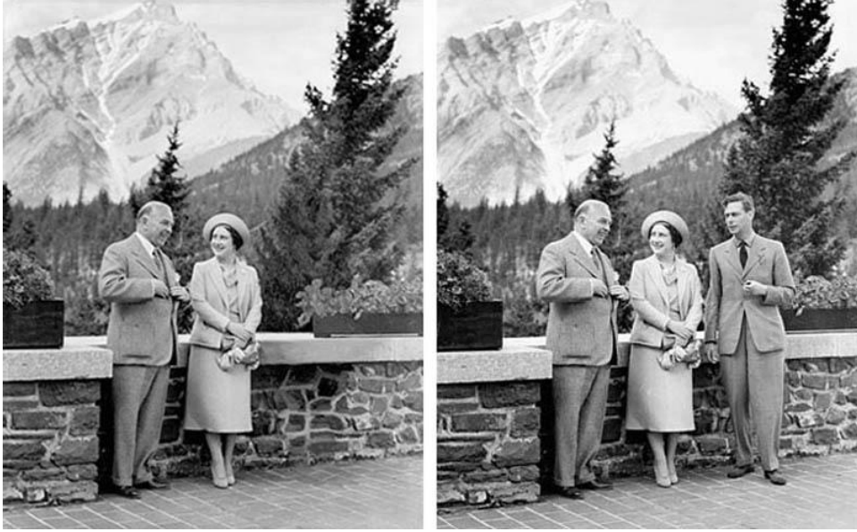
Görsel – 3 Solda William’ın fotoğrafının servis edilen hali, sağda ise orijinali görülmektedir.

Görsel-3’te görüldüğü üzere Kanada Başbakanı William Lyon Mackenzie King 1939 yılında çekilen fotoğrafta, manipülasyondan yararlanan bir diğer liderdir. William, İngiliz Kraliçesi Elizabeth ve Kral VI. George ile yer aldığı fotoğraftan Kral VI. George’u sildirmiştir. Bu uygulamayla Elizabeth ile baş başa sohbet ediyormuş gibi görünen William’ın amacı açık bir şekilde daha güçlü görünmektir. Kraliçe’nin William’a bakışı, gülümseyişi ve William’ın kendinden emin gülümseyen duruşuyla manipüle edilmiş fotoğraf Kanada Başbakanı’nı daha güçlü göstermeyi amaçlamaktadır.