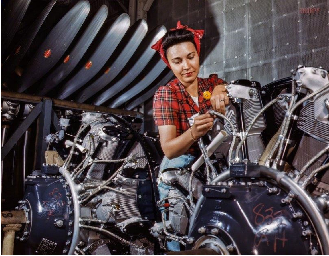
Görsel-11: Alfred T. Palmer, İsimsiz, 1942 (loc.gov)