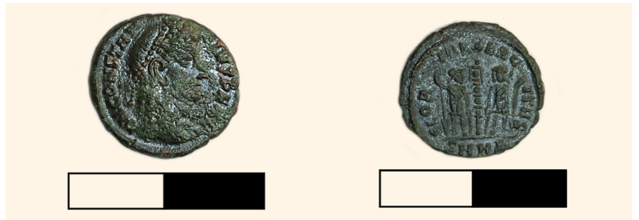
Resim 9 Mozaiklerin alt seviyesinde tespit edilen İS 4. yüzyıla ait bronz sikke.

Bu verilerin yanı sıra mozaik'in yatak harcı seviyesinde I. Konstantinus Dönemi'ne (İS 324-337) ait bir bronz sikke açığa çıkmıştır (Res. 9). Mezar 1 ve duvar kalıntısı arasında yapılan sondaj kazısında bu kısmın önceki dönemlerde yapılmış alt yapı çalışmaları nedeniyle stratigrafisinin zarar gördüğü ve buradaki düzensiz katmanlarda İS 4-5. yüzyıllara ait pişmiş toprak kap parçalarıyla İS 10-11. yüzyıla ait bronz bir sikke tespit edilmiştir.