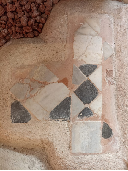
Resim 7 Kazlıçeşme Sanat Galerisi'nin güney cephesinde açığa çıkan opus sectile.

bir veriye rastlanmazken bireylerin kemiklerinden alınan örnekler üzerinden yapılan C14 analizlerine göre ilk örnek İS 221-349 (cal.), ikinci örnek ise İS 241-383 (cal.) tarihini vermektedir 3 . Ayrıca lahdin hemen kuzeyinde (mozaik zemin seviyesinde) ise açık ve koyu renk, üçgen ve eşkenar dörtgen şeklinde kesilmiş taşlarla oluşturulmuş opus sectile döşemenin küçük bir parça bölümü açığa çıkarılmıştır (Res. 7).