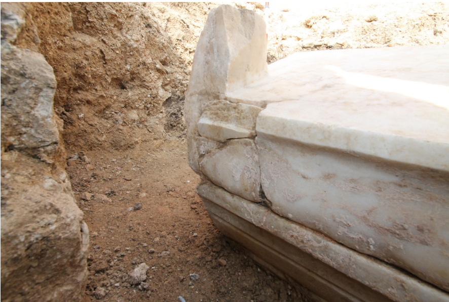
Resim 6 Lahit kapağında görülen onarım izleri (Kazı Arşivi).

işleminde zemin mozaiklerinden bir parçanın kullanıldığı tespit edilmiş, bunun yanı sıra kapakta da eski dönem onarım izleri görülmüştür (Res. 6). İki bireyin defnedildiği lahit içerisinde definlerin dönemlerine doğrudan ışık tutacak