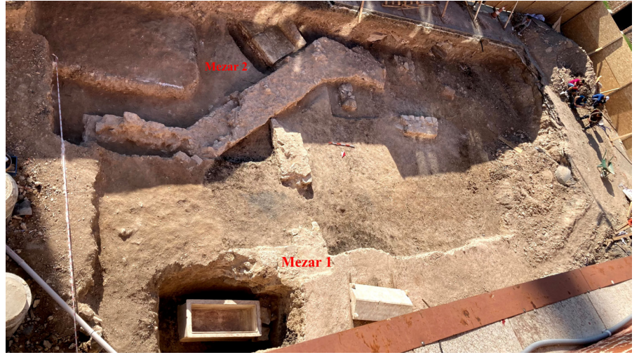
Resim 8 Mozaiklerin alt seviyesinde açığa çıkan duvar ve mezarlar (Kazı Arşivi).

Mezar 2'nin, kuzeyinde yer alan duvara bitişirildiği görülmekte olup duvarın işlevi anlaşılamadığından, mezar 2'nin bir mekânın iç ya da dış kısmında kalıp kalmadığı sorusu şu an için belirsizliğini korur (Res. 8). Mezar, kireç taşı blokların iç yüzeylerinin mermer plakalarla kaplanması suretiyle oluşturulmuş, ancak bireye ait kemikler oldukça kötü durumda ele geçmiştir. Mezar 2 içerisinde kemikler dışında başka bir bulguya rastlanmamıştır.