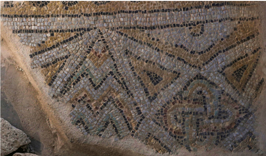
Resim 13 İç içe geçmiş üçgenlerden oluşan dört uçlu yıldız kompozisyonu (Kazı Arşivi).

Düğüm motiflerinin son bulunduğu dalga motifli banta bitişik sarı zemin üzerine iç içe yerleştirilmiş üçgenlerin uç kısımlarının birbirlerine bitleştirilmesiyle oluşturulmuş dört kollu yıldız motifleri bulunmaktadır. Yıldızın iç kısmındaki eşkenar dörtgen içinde Süleyman düğümü, yıldızlar arasındaki boşluklarda ise iç içe geçmiş zikzak motifleri görülmektedir (Res. 13).