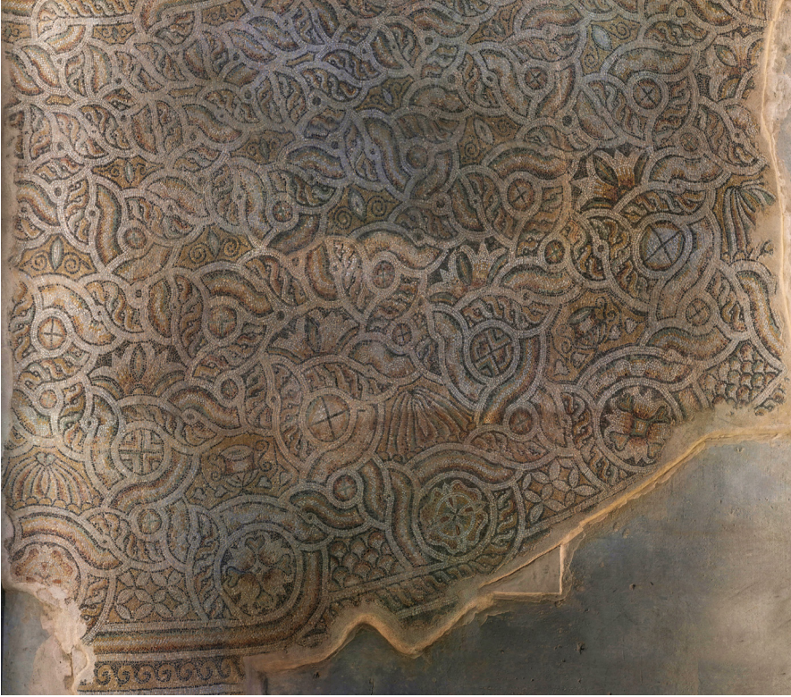
Resim 12 Birbirine bağlı düğüm motiflerinden oluşan kompozisyon (Kazı Arşivi).

vurgulanmış stilize dört yapraklı çiçek motifleri bulunur. Düğüm çapları gibi merkezden dışa doğru genişleyen düğümler arasındaki alanlarda sırasıyla iki yanında sarmaşık dalları bulunan iğ motifleri, ikili lotuslar, stilize kantharoi ve sarmaşık yapraklarıyla çevrili kantharoi , en sondaki en geniş boşluklardaysa balık ağı ve dört yapraklı çiçek motifleri görülür. Dar boşluklarda tek motif tekrarlanmış olarak kullanılmışken daha geniş olanlarda iki farklı motif bir sıra atlayarak tekrar eden şekilde kullanılmıştır. Düğüm motiflerinden oluşan kompozisyon en dışta açık renk zemin üzerine koyu renk dalga motifli bir bantla son bulmaktadır.