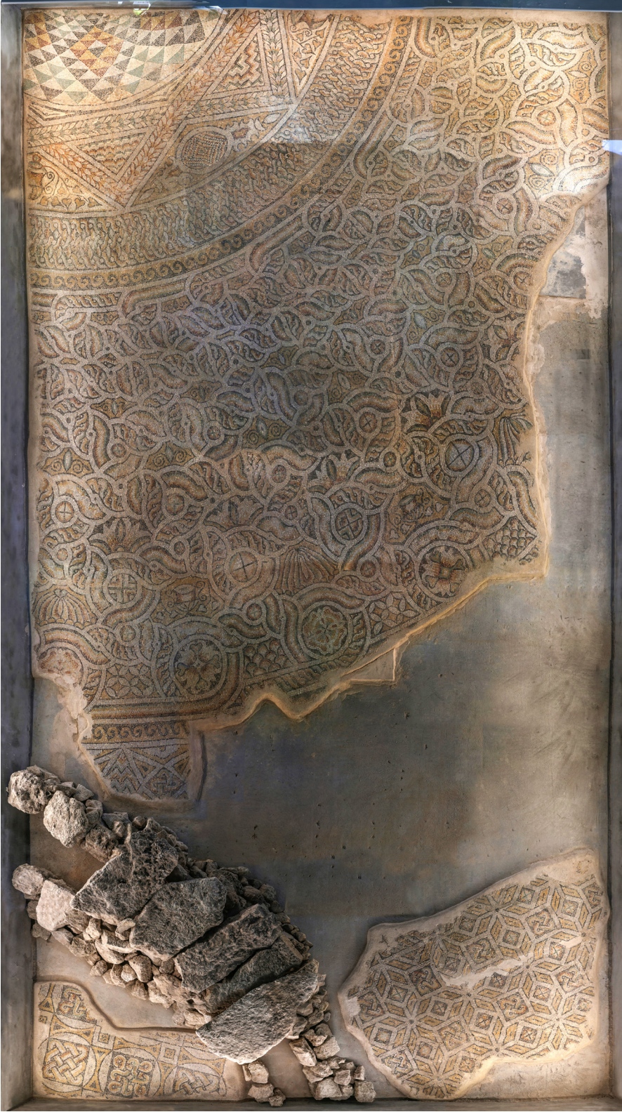
Resim 10 Yapı içerisinde tespit edilen mozaikler.

ve örgü motifli iki daire içine yerleştirilmiş sekizgen yıldız, bu merkezi dizaynı çevreleyen birbirine bağlı düğüm motifleri, iç içe geçmiş üçgenlerden oluşan dört uçlu yıldız kompozisyonu, paralelkenar dörtgenlerden oluşan sekiz uçlu yıldız motifleriyle birbirine teğet geçen dairelerin iç kısmına yerleştirilmiş karelerden oluşan geometrik kompozisyonlardır.