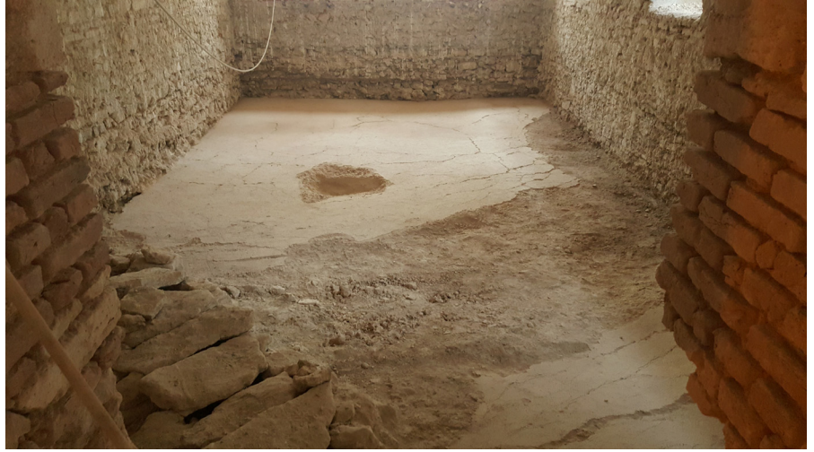
Resim 3 Kazlıçeşme Sanat Galerisi'nde oda içerisindeki mozaik zeminin kazı sonrası görünümü.