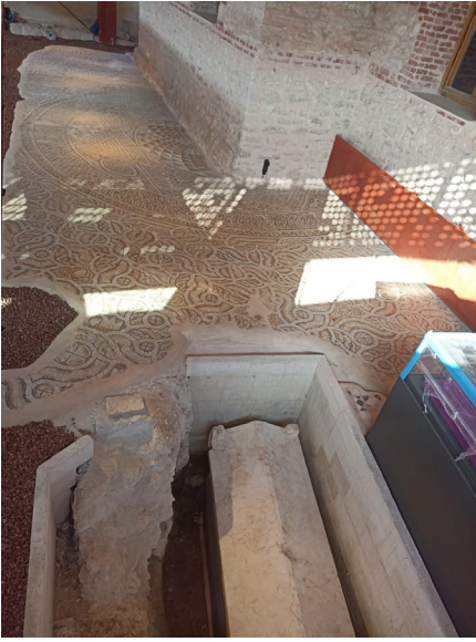
Resim 4-5 Kazlıçeşme Sanat Galerisi'nin güney cephesinde açığa çıkan mozaikler.

alana yayılım gösteren bölümü tespit edilmiştir (Res. 4-5). Bu kısımda yapılan çalışmalarda mozaik bütünlüğünün bina içindeki kadar sağlam koruna gelmediği görülmüştür.