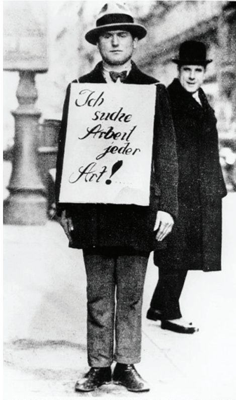
Resim 1. Kriz sonrası Berlin sokaklarında bir işsiz, 1930, (LeMO - Lebendiges Museum Online) Pankartta yer alan ifade: İş arıyorum, her türlü!

1. Dünya savaşı sonunda itilaf devletleri ile savaşta mağlup olan Almanya arasında, 1919'da Versay Barış antlaşması imzalanmıştır. Almanya, ağır maddelere rağmen, ablukadan kurtulmak için, anlaşmayı kabul etmek zorunda kalmıştır. Almanya, bu anlaşmayla toprak kaybetmenin yanında, yüksek savaş tazminatı ödemek zorunda kalmıştır. Yine bu anlaşmayla, Almanya'da deniz altı ve uçak üretimi durdurulmuştur. Ayrıca Almanlara, en fazla yüz bin kişilik bir ordu bulundurabilme hakkı tanınmıştır. Bu ağır şartlar ve yükümlülükler 1920-1923 arası dönemin buhranlı geçmesine yol açmıştır. Bazı tarihçiler, Almanya'da aşırı milliyetçiliğin yükselişini ve Hitler'in başa gelmesiyle Weimar Cumhuriyeti döneminin son bulmasını, bu ağır şartlara bağlamışlardır.