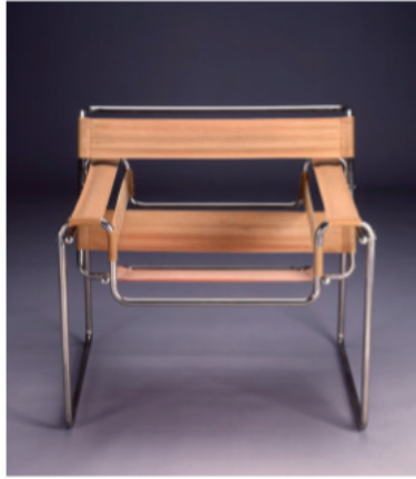
Klubsessel Modell B 3, 1926