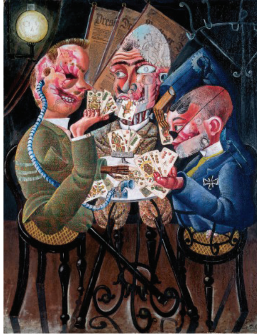
Resim 3. Otto Dix, Kart oynayan savaş sakatları (Kartenspielende Kriegskrüppel), 1920, Berlin