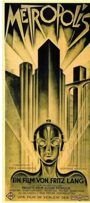
Resim 5. Metropolis film afişi, 1927

Hem Ekspresyonist (dışavurumcu) hem de Yeni Nesnellik sanat anlayışına uygun filmler çekilmiştir. Yönetmenliğini Robert Wiene’nin yapmış olduğu Dr. Caligari’nin Muayenehanesi ( Das Cabinet des Dr. Caligari, 1920), Alman dışavurumcu sinemasının ilk örneklerindedir. Bu sessiz film bir alman kasabasındaki esrarengiz seri cinayetleri konu olarak işlemiştir. Film aynı zamanda kurgu ve kamera kullanımı açısından sinema tarihindeki müstesna yerini almıştır.