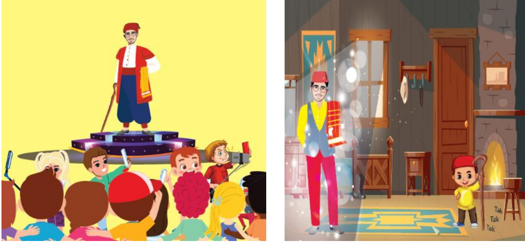
Görsel 2: "Zamanın Ötesinde Bir Meddah" kitabından bazı görseller (Demir, 2023).

Yazar Avanođlu – Günümüzde bu sanatın tanınan ve bilinen bir temsilcisi olarak geleneđin unutulmasını engellemek için görüş ve önerileriniz var mıdır?