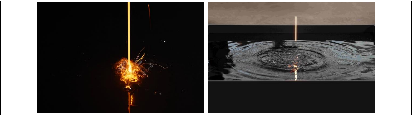
Şekil 6 ve 7. Arcangelo Sassolino,2022, Diplomazija Astuta, Enstalasyon, Venedik Bienali.

Sanatçı, 59. Venedik Bienali Malta Pavyonu için “Diplomazija Astuta” adlı kinetik heykel enstalasyonu kurgular. Dünyanın ilk “karbon nötr” sertifikasına sahip olan bu çalışma, Paris anlaşmasının CO2 emisyonlarına ilişkin 2023-2050 hedeflerine uygun olarak üretilir. Çalışmanın kurulum aşamasından sergi süreci dahil tüm aşamalarında uygulanan özel müdahaleler sayesinde uluslararası mevzuata uygun olarak sera gazı emisyonları önlenir (Giodano, 2023).