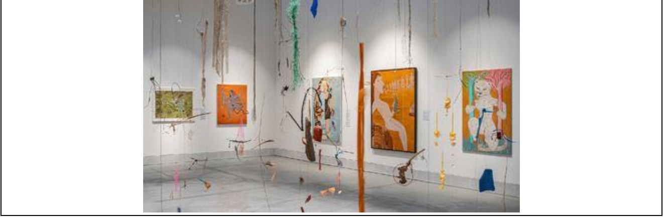
Şekil 2. Cecilia Vicuña, 2022, NAUfraga, Venedik Bienali.

"Bienalde ayrıca çoğu 1970'lerde üretilen tabloları yer alır. Bunlar insan ve insan olmayan karakterlerin son derece senkretik kompozisyonlarıdır. İzleyiciye başka dünya görüşleri hakkında konuşan, samimi, kadınsı ve daha çok Latin Amerika dünyası hakkında bilgi veren hayvan ve fantastik karakterler yer alır. Görüntüler gerçeküstülikle bağlantılıdır ama aynı zamanda sanatçının büyüdüğü Latin Amerikayı protesto eden vinillerini de hatırlattır." (Martinez, 2022).