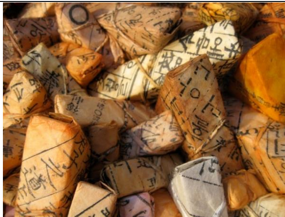
Şekil 4. Chun Kwang Young’un çalışmasından detay.

Young, 2022 Venedik Bienali için “Times Reimagined” (Yeniden Tasarlanan Zamanlar) adlı 40 adet rölyef çalışma tasarlar. Giriş pavyonunda yer alan bu çalışma mimar Stefano Boeri tarafından tasarlanan Hanji evinde sergilenir. Çalışmasında bio- çeşitlilik, sürdürülebilirlik ve iklim değişimleri konularını ele alır. Venedik Bienali’nin tamamlayıcı etkinliği olarak tasarlanan bu çalışma, dut ağacının kabuğu kullanılarak üretilen, geleneksel el yapımı Kore kâğıdı olan Hanji ile 40 adet rölyef sunulur.1300 yıldan fazla ömrü olan bu malzeme, dayanıklılığı ve yaşam döngüsü gibi kavramları ifade ederken aynı zamanda ekolojik üremeği ve dolaşımı da ifade eder. Kullanılan malzeme ekolojik açıdan sürdürülebilir bir malzemedir; tüketildiğinde geri dönüştürülebilir ve hızla doğaya geri dönebilir özelliğe sahiptir.