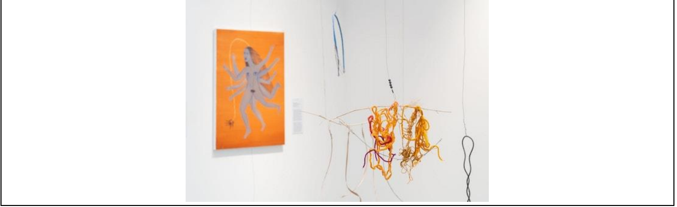
Şekil 1. Cecilia Vicuña, 2022, NAUfraga, Venedik Bienali.

Yerli insanların hafızada tutmak ve belgelemek için oluşturduğu Quipu tekniğini sanatçı, çalışmalarında kendi bilgi ve anılarını kaydetmek için kullanır. Düğümler ve renkli iplikler ile dokunulabilecek kavramsal bir dil oluşturur. Ayrıca yerli insanların kullanmış olduğu bu tekniği çağdaş dünya ile tanıştırır. (Cortese vd., 2019).