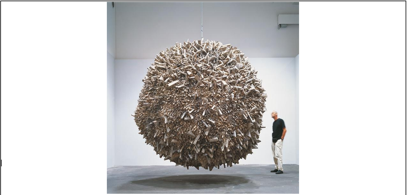
Şekil 3. Chun Kwang Young, 2003, Yeniden Tasarlana Zamanlar, Kore dut kağıdıyla karışık teknik, 450cm, Venedik Bienali.

Ritüel ve imalara dayandırdığı çalışmalarında, doğal dünyaya ve temas edilmemiş kültürlere gönderme yapar. Sanatsal araştırmalarının odak noktası, geçicilik duygusu ve yeniden canlanmadır. Doku ve Quipu tekniği ile yeni anlamlar yaratmak için daha önce hiç yapılmamış şeylerin gelecekteki potansiyellerini araştırır. Bienalin amacı olan insanlarla doğa arasındaki bağlantıyı/dengeyi yeniden sağlamak için doğal malzemeleri ve yöntemleri kullanır.