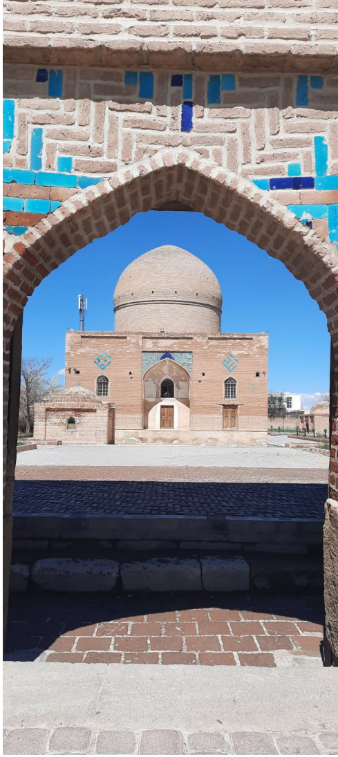
Resim 1. Şeyh Safiyüddin'in baba ve dedelerinin mezarının bulunduğu Kelhoran

Hanedanın ve tarikatın kurucusu olarak kabul edilen Şeyh Safiyüddin'den Şeyh Cüneyd'e kadar geçen sürede postta oturan bütün Safevî şeyhleri, devrin siyasi aktörleriyle dengeli bir ilişki içinde olmuşlar ne şeyhler hükümdarlardan ne de hükümdarlar post-nişinlerden herhangi bir siyasi tehdit algılamışlardır. Bilakis Şeyh Safiyüddin'in kendisini insanları irşatla görevli telakki etmesi Moğolların ona yönelik teveccühünü artırmış, böylece bölge halkı onun sayesinde Moğolların daha büyük katliamına maruz kalmaktan kurtulmuştur 9 .