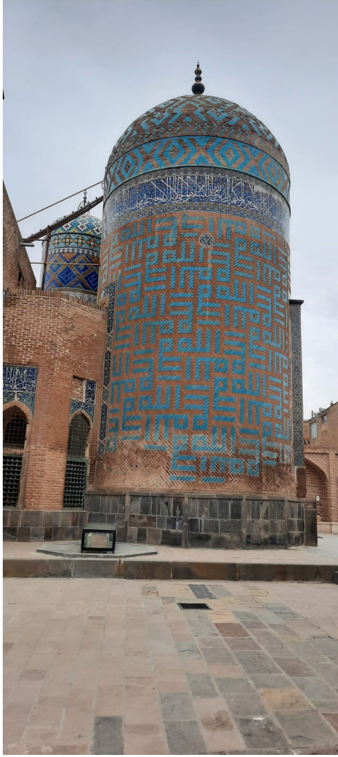
Resim 3. Şeyh Safiyüddin Türbesi