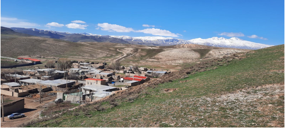
Resim 2. Şah İsmail'in vefat ettiği Mankutay