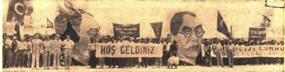
Adana hava meydanında dün Celâl Bayarın uçağını bekleyen halk ve D. P. ileri