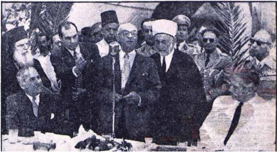
EK 6: Cumhuriyet, 20 Haziran 1955, Sayı:11097.