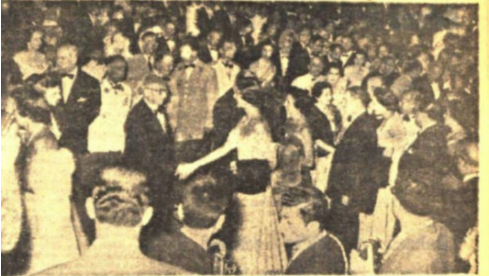
Beyrutta yapılan kabul resminde Cumhuriyet Reisi Celâl Ba yar ve Lübnanlı davetliler