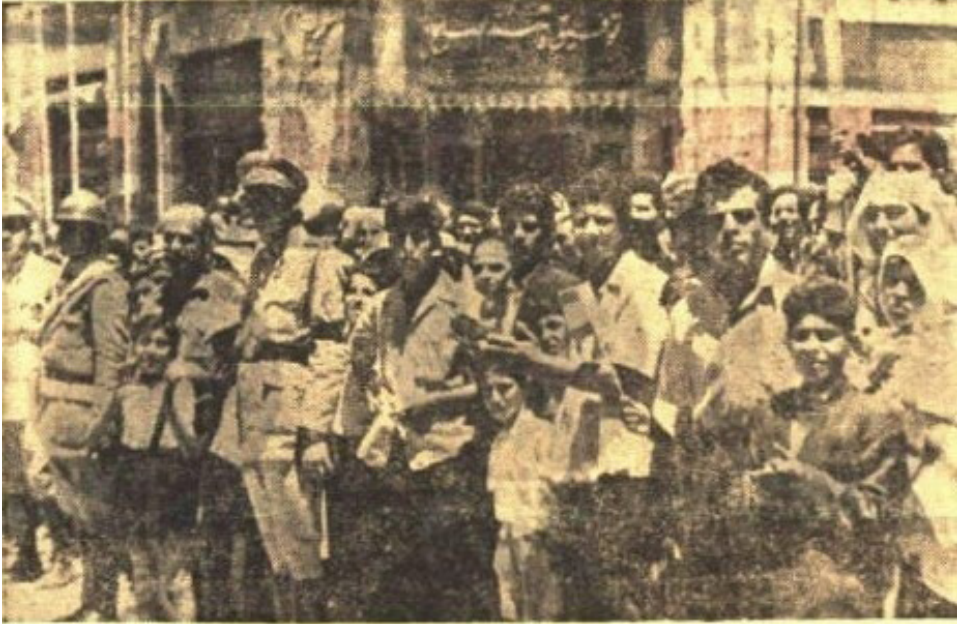
Trablusşam sokaklarında Cumhuriyet Reisi Celâl Ba yarı alkışlayanlar