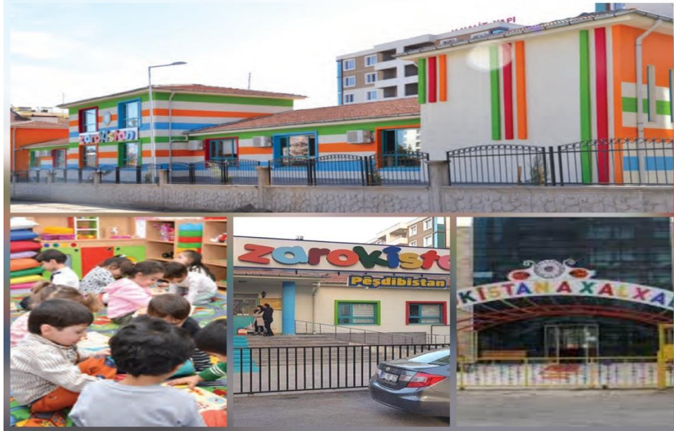
Kaynak: Diyarbakır Büyükşehir Belediyesi, 2015: 77

Diyarbakır Büyükşehir Belediyesi Sosyal Hizmetler Daire Başkanlığı Çocuk Şube Müdürlüğü tarafından Bağcılar'da 1, 450 Evler Gündoğan Mahallesi'nde 1, Hasırlı ve Ben-u Sen'de 4, Yeniköy'de 1, Sümer Park'ta 4, 500 Evler'de 1 olmak üzere toplamda 12 kreş kurulmuştur. Bu kreşler ilk kurulduklarında oyun odaları olarak adlandırılmış ve değişen siyasal konjoktüre göre isimleri değiştirilerek Zarokistan yapılmıştır. Eğitimler öğleden önce ve sonra olmak üzere iki kademeli gruplar halinde sürdürülmüştür. Zarokistanlara öğrencilerin kayıtları, genellikle öğretmenler tarafından yapılan ev ziyaretleri sonucunda veya kişilerin kendilerinin başvuru yapmasıyla alınmıştır. Bu Zarokistanlarda eğitim gören çocuklar özel günlerde düzenlenen etkinliklere yerel kıyafetleri ile katılmış, ana dillerinde şarkılar söylemiş, halaylar çekmişlerdir. Belediye eliyle yapılan bu hizmet geleceğe yapılan bir yatırım şeklinde değerlendirilmiştir 12 . Zarokistanlar 2016 yılındaki kayyım atamalarına kadar faaliyetlerini sürdürmüş, kayyımların atanmasıyla bu kreşler ya kapatılmış ya da faaliyetleri değiştirilmiştir.