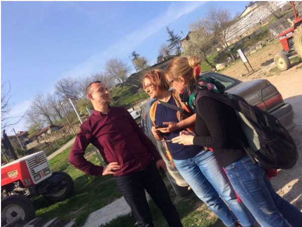
Şekil 7. Kaynak kişilerle yapılan görüşme