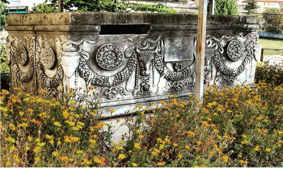
Şekil 5. Konuralp Arkeoloji Müzesi'nin bahçesinde sergilenen lahit mezar