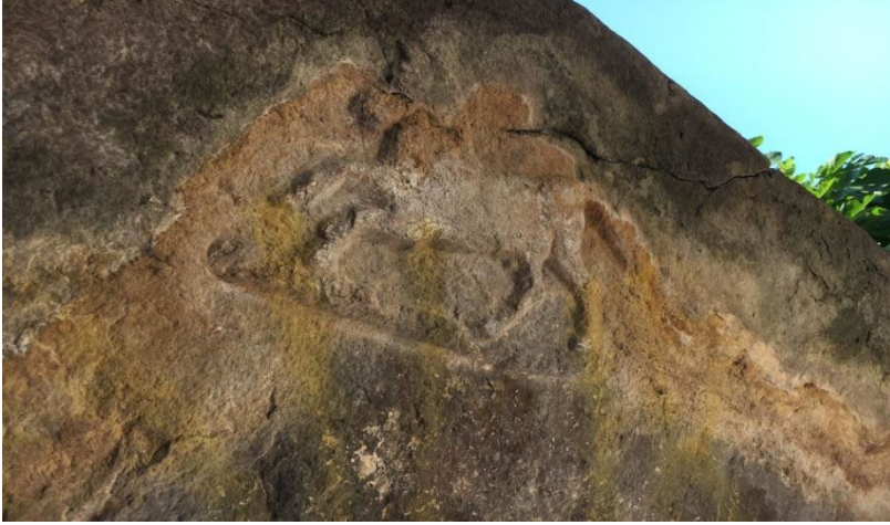
Şekil 4. Atlı Kapı

Atlı Kapı'nın adının, orada yaşayanlar tarafından, üzerinde at tasvirinin bulunmasının ve bu kapıdan atlıların geçmesiyle ilgili olduğu düşünülmektedir (R. Polat; kişisel iletişim, 2017). Üzerinde at tasviri olan bu kapı lentosu, atlı araçların geçebileceği genişliktedir. Kentin batı ve güneyinde kısmen korunan surların günümüzde yok olma tehlikesi altında olduğu görülür. (Dikmen ve Toruk, 2017, s. 190).