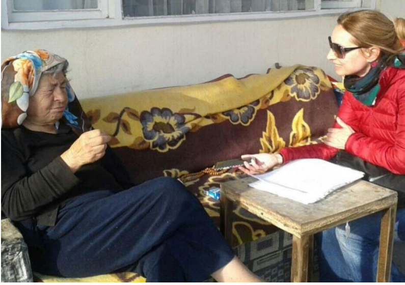
Şekil 6. Kaynak kişilerle yapılan görüşme

Gazi'den dolayı da Konuralp adını aldığı kabul edilmektedir (İ. Odabaş, kişisel iletişim, 2017).