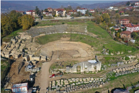
Şekil 8. Prusias ad Hypium tiyatrosu hava fotoğrafı güneyden bakış (Okan 2022, s. 88)

Konuralp gibi antik kent üzerinde kurulmuş yerleşimler (Şekil 8), tarihsel süreç içerisinde farklı uygarlıklar tarafından iskân edilmiş ve günümüzde de üzerinde halen yaşanmaktadır. Bu çok katmanlı kentlerde çoğu kez arkeolojik alanların önemi yaşayanlar tarafından fark edilmiş ve kentin ortak hafızasında içselleştirilmemiştir. Bunun yanı sıra bir de kentleşme yönünde atılan hızlı adımlar, tarihi kentlerdeki kültürel mirasın korunması, arkeolojik alanların kent yaşamıyla bütünleştirilmesi gibi konularda eksik kalmıştır. Özellikle çok katmanlı kentlerdeki geçmiş uygarlıklara ait maddi kültür buluntuları ile günümüz insanının kimlik bağlantısı konusunda bir takım sıkıntılar yaşanmaktadır (Savrum Kortanoğlu, 2020, s. 123-124). Yapılan çalışmada yerel halkın günümüze daha yakın dönemlere ait –Osmanlı Dönemi- tarihi kalıntılarını daha çok sahiplendiklerini ancak daha erken Yunan ve Roma uygarlıklarına ait kalıntılara karşı daha yabancı/mesafeli oldukları gözlemlenmiştir. İşte bu sahiplenilmeme, o dönemlere ait alanların korunması konusunda sıkıntı yaratmaktadır (Savrum Kortanoğlu 2020, s. 123-124).