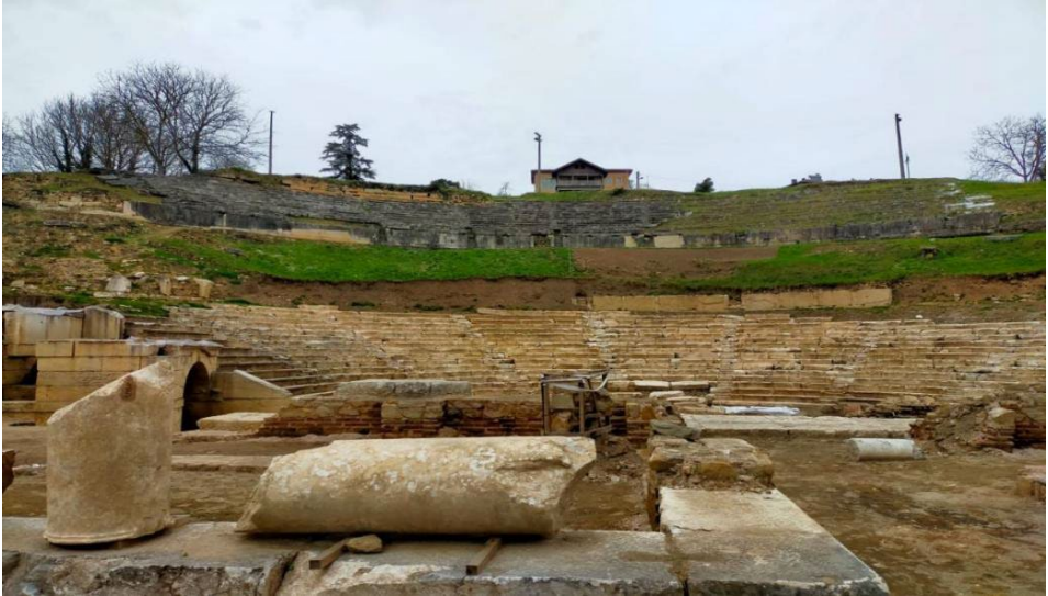
Şekil 3. Kırk Basamaklar

Görüşmeler sırasında Kırk Basamaklar'ın çevresinde tarım yapıldığı aktarılmıştır. Yine bu mekânda bayramlarda buluşulduğu, çocukken oyunlar oynama alanı olarak seçildiği, yakında bulunan bir mezarın çevresinde çeşitli inanışların yaşatıldığı somut olmayan kültürel mirasın ortaya çıkarılması adına son derece önemlidir (Pınarcık ve Sütçü, 2017, s. 389).