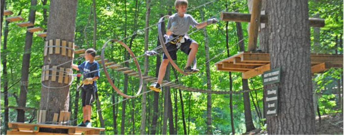
Şekil 7. Ağaçlar üstünde bir dizi aktivitenin yapılabildiği macera parklarına bir örnek (URL-1'den).

faýdalanacaklar mutlaka, bu aktiviteler için bizzat macera parkı işletmesi tarafından verilecek eğitimi almış kişiler olmalıdır.