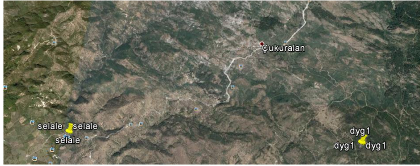
Şekil 2. Nebiler şelalesi ve Çukuralan bisiklet turizmi güzergâhlarının Google Earth görüntüsü.