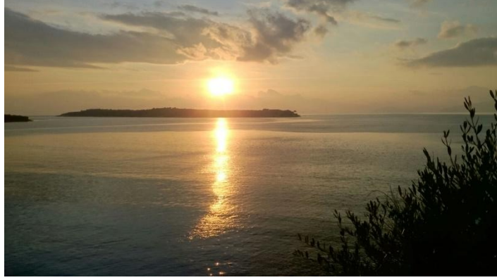
Şekil 5. Sportif olta balıkçılığı - sualtı dalış turizmi - şnorkelle denizaltı gözlemciliğine de uygun adalarda gün batımı.