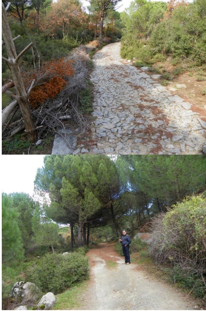
Şekil 6. Üstte kaplamalı, altta kaplamasız bisiklet turizmi yolları.

Tercihen mekân, mümkün olmazsa zaman olarak diğer aktiviteleri etkilemeyecek ve bitkisel tür zenginliğine sahip yahut özelliikli bir bitkiye veya anıt ağaca ulaşmayı sağlayan altı güzergâh sınıfının (1- Aile için, 2- Kolay, 3- Orta, 4- Zor, 5- Sarp, 6- Çok sarp; Anonymous, 20008) mümkünse her birinden asgari birer adet güzergâh, kullanım dönemleri ve taşıma kapasiteleri ile birlikte belirlenip, her güzergâh üzerinde sağlı – sollu 30’ar metrelik şeritlerde veya anıtsal ve/veya özelliikli ot, çalı, ağaççık ve ağaçların bulunduğu yerlere ait konumsal ve fizyografik bilgilerin, türlere ait sistematik ve morfolojik özelliklerin yer aldığı “Dikili Botanik Turizmi Güzergâhları” rehberi hazırlanmalıdır.