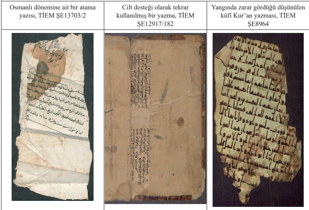
Tablo 1: Kubbe'nin Zaman İçerisindeki Farklı İşlevlerine Şam Evrakı Koleksiyonu'ndan Örnekler