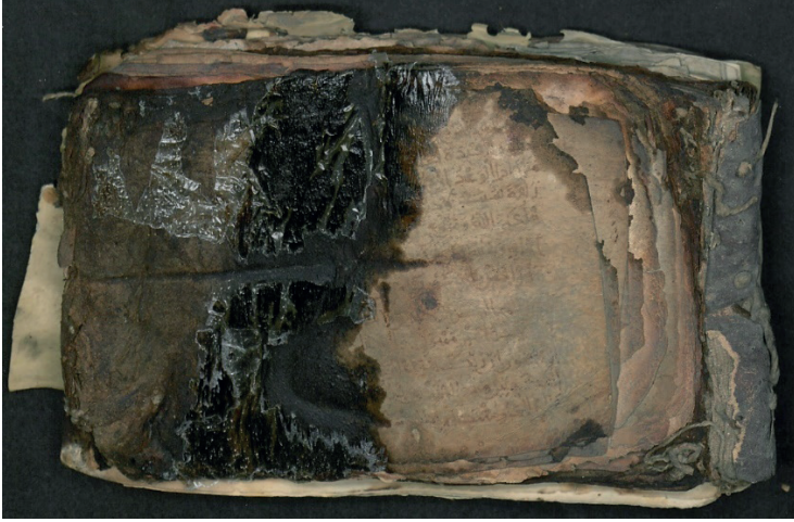
Şekil 1: Şam Evrakı Koleksiyonu'nda yangından izler taşıyan ciltli bir mushaf, TİEM ŞE13697/2

hatlı bir mushafa rastlanmıştır ve tahminen bu mushaf Kubbe'ye olası bir yangından tekrar zarar görmesin diye konulmuştur. 37 Dolayısıyla Şam Emevî Camii'nin geçirdiği yangınlar, bahsi geçen kûfî hatlı mushafın yanı sıra pek çok yazmanın da Kubbe'ye nakledilmesini kaçınılmaz kılmıştır.