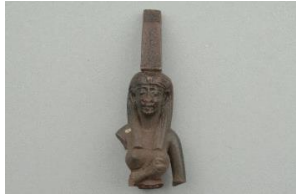
Şekil 19: İsis Lactans, M.Ö. 664-30 Yükseklik: 4.90 cm. Genişlik: 1.78 cm., Johns Hopkins Arkeoloji Müzesi