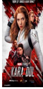
Şekil 35: Natasha Romanoff