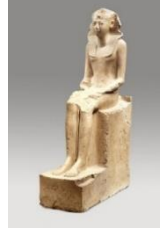
Şekil 14: Oturur Haldeki Hatshepsut, M.Ö. 1479-1458, Yükseklik: 213 cm, Genişlik: 119 cm. Metropolitan Museum