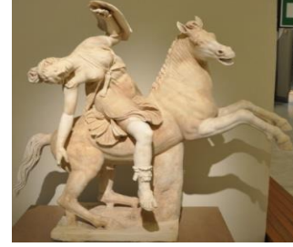
Şekil 18: At Sırtında Amazon Ölüyor, Napoli Ulusal Arkeoloji Müzesi, https://www.livius.org/pictures/a/roman-empire/dying-amazon-on-horseback/