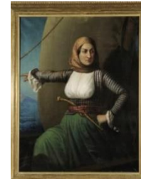
Şekil 12: Laskarina Boubolulina, Yükseklik: 0.99 m Genişlik: 1.24 m, Athena Ulusal Tarih Müzesi