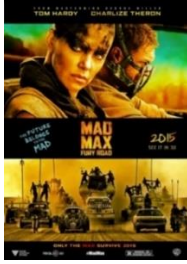
Şekil 37: Furiosa