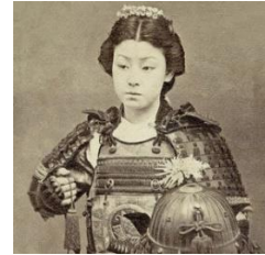
Şekil 21: Nakano Takeko https://www.warriorwomenselfdefense.org/warrior-women-nakano-takeko/