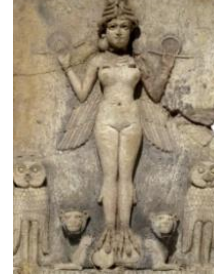
Şekil 9: Burney Rölyefi/ Gecenin Kraliçesi, Yükseklik: 49., Genişlik: 37 cm, British Müzesi