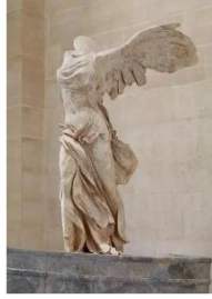
Şekil 8: Helenistik Period, M.Ö. 190, Semadirek'in Kanatlı Zaferi, Yükseklik:2.75 m, Louvre Müzesi