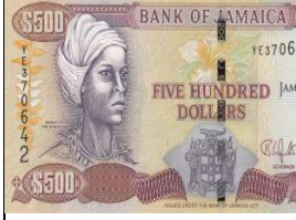
Şekil 5: Rachael Minott, Marronların Nanny'si, 2013, Reading Müzesi