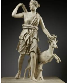
Leochares, M.Ö. 4. "Versailles Dianası, Yükseklik: 2 m, Louvre Müzesi