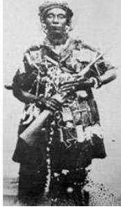
Şekil 16: Yaa Asantewaa Batakarikese (resmi savaş kıyafetleri) tarihlenmemiş fotoğraf http://yaaasantewaahmuseum.ghana0.com/yaa-asantewaa-should-be-re-buried-in-ghana---kwame-mayor.html )