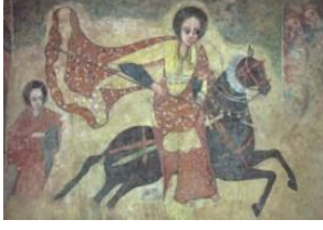
Şekil 13: Gudıt, https://www.linkethiopia.org/ethiopia/learn-about-ethiopia/history/