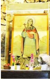
Şekil 10: Hagia Theokleia, Ayatekla Kilisesi, Silifke