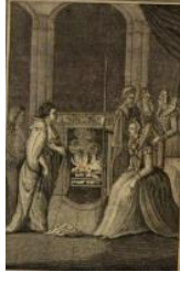
Şekil 4: W. Beaufort delin, Grace O'Malley Kraliçe Elizabeth'e kendisini tanıtmaması (sağda), 1593, Anthologia Hibernica Vol II, page 14, (New York Halk Kütüphanesi)