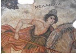
Şekil 11: Melanipe, Haleplibahçe Amazonlar Mozaïği Ayrıntı, Şanlıurfa Müzesi