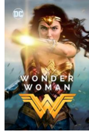
Şekil 38: Prens Diana