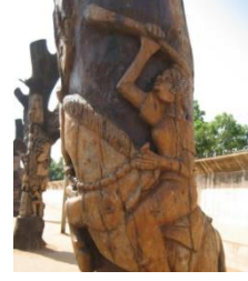
Şekil 15: Ağaç Oyma Yennega, Ouagadougou, Burkina Faso. Fotoğraf: Brenda Gael McSweeney, 2009