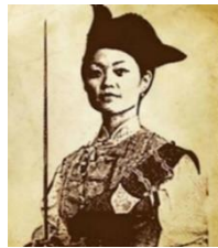
Şekil 20: Ching Shih https://historydaily.org/ching-shih-the-