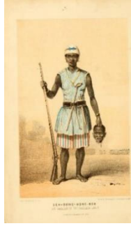
Fotoğraf 17: Seh-Dong-Hong-Beh, Frederick E. Forbes, Dahomey ve Dahomanlar: İki Misyonun Dergilerinde Dohamey ve 1849 ve 1850 yıllarında Başkent, Vol I, London 1851, p22