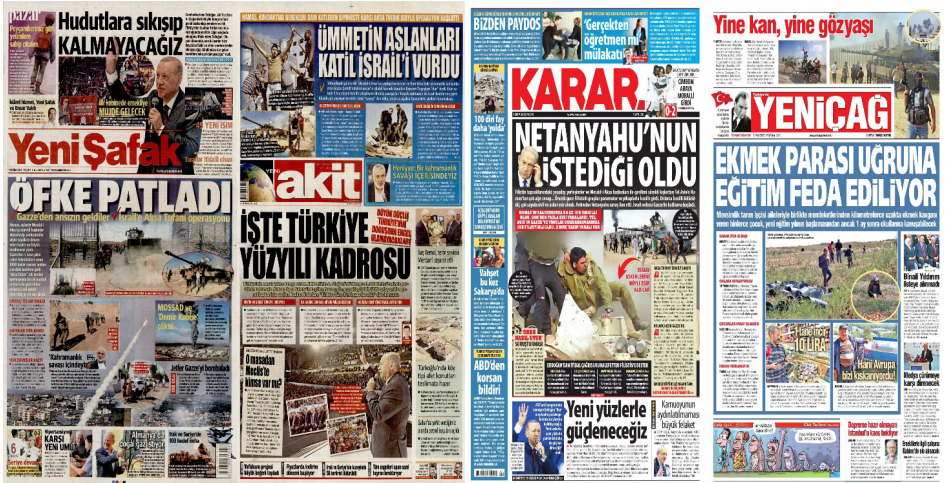
Görsel 4. Muhafazakâr Sağ ve Milliyetçi Gazetelerin 8 Ekim Tarihli Birinci Sayfaları