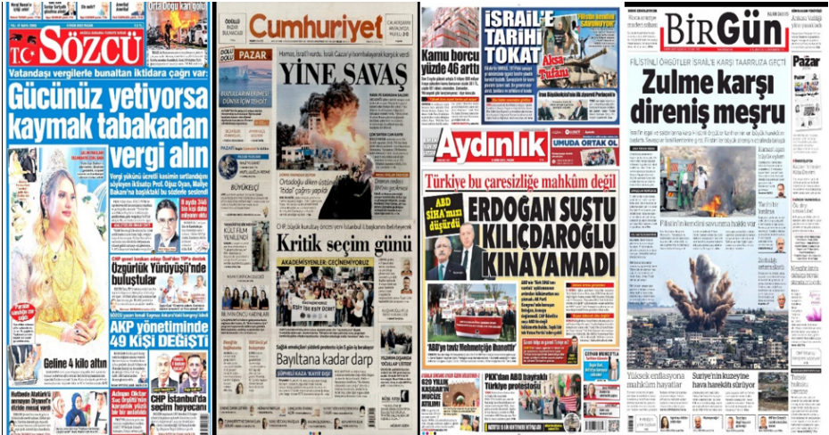
Görsel 2. Sol Eğilimli Gazetelerin 8 Ekim Tarihli Birinci Sayfaları

vermiştir. “Yeni Birlik” gazetesi ise haberi manşetten vermiş, alt başlıklarla desteklediği haberde kullandığı etkili görsellerle nerdeyse tam sayfayı bu habere ayırmıştır (Görsel 3’e bakınız).