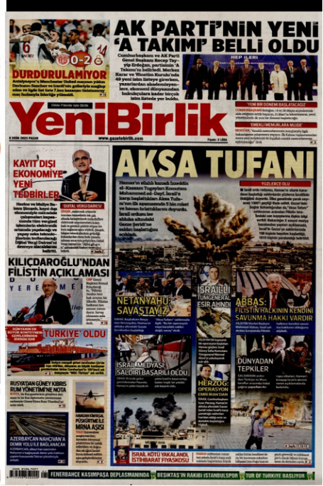
Görsel 3. Merkez Sağ Gazetelerin 8 Ekim Tarihli Birinci Sayfaları