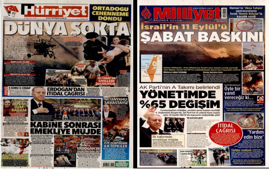
Görsel 1. Ana Akım Gazetelerin 8 Ekim Tarihli Birinci Sayfaları