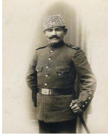
Görsel 4. II. Meşrutiyet Dönemi'nde Polis Kıyafeti

2013). Ancak 1908 Ekim Krizi sırasında Avusturya Devleti'nin Bosna ve Hersek'i resmen ilhak ettiğini açıklaması üzerine ülke genelinde başlayan protesto gösterilerinin ardından fes boykotu sonrasında "atadan yadigâr" kalpak uygulamasına geçilmiştir. Eski hafiyelere mahsus kırmızı fesler atılmıştır (Feridun, 1326). 4 Kasım 1908 tarihinden itibaren polislere kalpak dağıtımına başlanmıştır (Tanin, 1324).