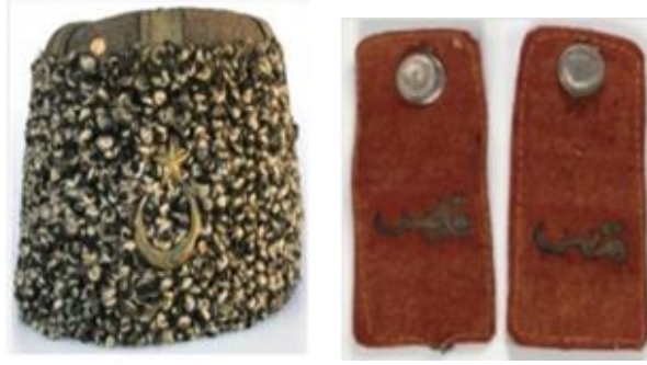
Görsel 5: II. Meşrutiyet Dönemi Serpuş ve Apolet Örneği