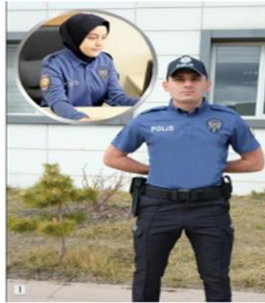
Görsel 17: 2018 Polis Erkek ve Kadın Yazlık Kıyafeti

2018 değişikliği ile polis teşkilatı, kamuflaj giyimine geçmiştir. Sportif görünüm ve rahat giyim tercih edilmiştir. Kamuflaj giyim denilmesinin sebebi pantolonun kesim biçimidir. Yazlık ve kışlık pantolonun rengi aynıdır; lacivert renktedir. 1994'te kullanılmaya başlanan lacivert renk büyük oranda varlığını sürdürmüştür. Aynı zamanda bu renk, kamuflaj pantolon dışında mont, kaban ve yağmurlukta da kullanılmıştır. Sadece yaz döneminde giyilen tişörtün rengi mavi olarak belirlenmiştir. Bir başka ifadeyle bu değişimle beraber Türk polisi yaz döneminde çift renk; lacivert ve mavi üniforma giyerken diğer zamanlarda tek renk; lacivert üniforma giymeye başlamıştır. Kepte herhangi bir değişikliğe gidilmemiştir. Bu değişimle beraber kundura, iskarpin şeklindeki ayakkabı kullanımına son verilmiştir. Kamuflaj giyimini tamamlayıcı olarak postal/bot giyimine yönelim vardır. Kışlık botun bacak boyu uzun iken, yazlık botun boyu kısa tercih edilmiştir. Özellikle yazlık botlarda hava şartlarından dolayı deri kullanımı azaltılmış, kumaş miktarı artırılmıştır. Hem ayak sağlığı ve hem de hafif/rahat kullanım tercih edilmiştir. Ayrıca kadın polisler için lacivert ve siyah renkte başörtüsü kullanımına başlanmıştır.