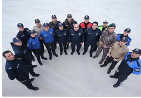
Görsel 16: 2018 Polis Kıyafeti

takmayacaktır. Bunların yerine ütü gerektirmeyen tişört/gömlek ve pantolonlar ile daha rahat kullanıma ve sportif görünüme sahip ayakkabılar kullanılacaktır.