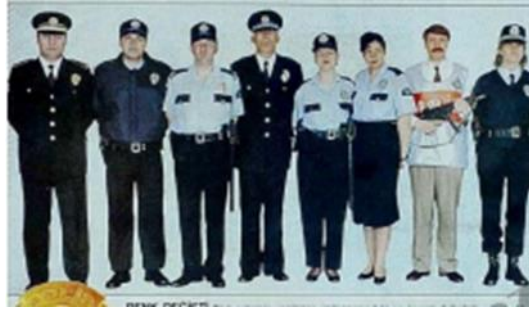
Görsel 15: 1994 Polis Kıyafet Değişikliği

1994 senesinde “Milenyum Çağ” olarak adlandırılan 2000’li yıllara girerken derin gece yarısı ile mor menekşenin karışımından oluşan “Yeni Çağ” rengi olarak nitelendirilen lacivert polis üniforma rengi olarak tercih edilmiştir. Lacivert; mor ve mavi arasında bulunan bir renktir. Mantık, sezgi ve disiplini yaratıcılıkla birleştiren bir renk manasına geldiği bilinmektedir (Dokumacı, 2020, s. 125). Bu doğrultuda teknolojinin hızla geliştiği bir sırada 2000’li yılların arifesinde polis teşkilatının mantık, aklı, bilimi ve sezgiyi çağrıştıran lacivert rengi seçmesinin rastlantı olmadığı anlaşılmaktadır. Diğer taraftan ceket ve güneş siperlikli şapkalar yerine bu değişimle birlikte polisin mont ve kep kullanımına geçmesi, görev sırasında hareket kabiliyetini artırmak isteğiyle açıklanabilmektedir.