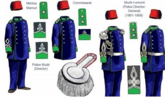
Görsel 3: Abdülhamit Dönemi Polis Üniforması

sorumlulukları artmıştır. Yalnız mutlakiyet gereği özellikle hafiyeler tarafından meşrutiyetçilerin sıkı sıkıya takibi ve onları yakalamak veya sürgüne göndermek için yoğun mesai harcamaları, serbestliği hoş görmemeleri ve her daim baskıcı ve sindirici hal ve hareketleri Abdülhamit Dönemi polisinin kötü ünlenmesine neden olmuştur.