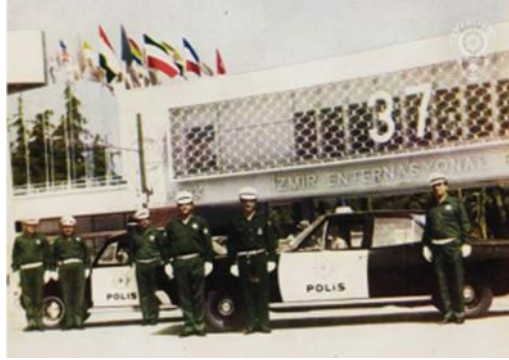
Görsel 13: Trafik Polisleri, 1960’lı Yıllar

teçhizat kemerlerine kadar taşımıştır. Beyaz; diğer insanlardan ayırt eden bir renktir (Akkın vd., 2004, s. 277). Bu bilgi ışığında hareketle trafik polislerinin diğer polislerden üniformanın belli kısımlarındaki beyaz renkten ayrıldığı söylenebilmektedir. Bir başka ifadeyle trafik polisleri diğer polislerden beyaz renkle ayrılmaktadırlar. Yine Görsel 14’te görülen trafik ışık lambalarının henüz kullanılmadığı zamanlarda zıvana tabiri kullanılan koruyucu havuz içinde kavşaklarda trafik akımını yönlendiren kadın polisinin beyaz renkli şapka ve kemeri ile diğer polislerden ayrılarak trafikçi polis görevi icra ettiği söylenebilmektedir.