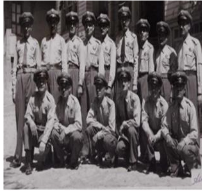
Görsel 11: 1952 polis kıyafeti

Yeni polis üniforması, koyu mavi renktir. Polis teşkilatının kuruluşunun ilk yıllarındaki renge yakın bir renk seçilmiş olmaktadır. Mavi huzurun rengidir (Mazlum, 2011, s. 132). Esasında mavi rengin tercihi polis kamununun huzur ve barışını sağlayarak huzur verici oluşu etken olduğu değerlendirilmektedir. Diğer taraftan mavi rengin koyu olarak seçimi ise depresif bir ortama mazhar olduğu bilinen bir durumdur (Çalışkan, vd., 2010, s. 103). Hükümet yetkililerin polis üniformasındaki mavi rengin koyu şekliyle biçimlendirmiş olması bu sanıyla açıklanamaz olduğu düşünülmekte ve koyu rengin seçiminde başka bir düşüncenin hasıl olduğu değerlendirilmektedir.