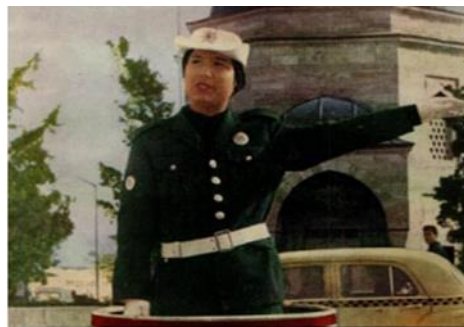
Görsel 14: Zıvana İçinde Kadın Trafik Polisi

Polis unvanıyla sivil kıyafetle sivil birimlerde 1932 senesinde göreve başlayan Türk kadını, ilk defa yeşil üniforma döneminde resmi üniforma giymişleridir (Hürriyet, 1962). Bu yıllarda 1960’lı yıllarda kadın polislerin sayısı bir hayli artınca ve kendileri resmi üniformalar ile saha görevlerine çıkınca kamuoyunda gündem olmuşlardır. Neredeyse her bir basın kuruluşu bu konu hakkında haberler yapmıştır. Örneğin bir haber başlığında “Güzel kızlar polis olmuş, gelin teslim olalım” (Tercüman, 1967) şeklinde mizahi değerlendirmeler yapıldığı dahi olmuştur.