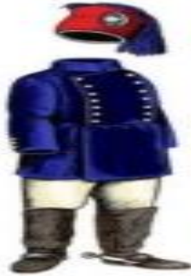
Görsel 2: Osmanlı Polisi Üniforması örneği

üniforma tamamlanmıştır. Baştan ayağa bakıldığında üniforma; mavi, beyaz ve kırmızı renk birleşiminden oluşmuştur. Tek yerine renkli bir giyim ile üniformaya canlılık kazandırılmıştır.