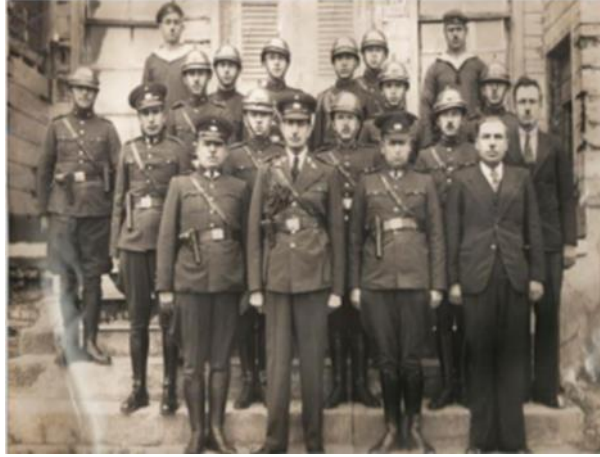
Görsel 9: 1936 Polis Kıyafet Değişikliği