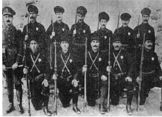
Görsel 7: Mardin Bekçi Teşkilatı

Bu süreçte bekçi teşkilatına merkezi otoritenin güçlendirilmesi adına baştan aşağıya üniforma giydirilmiştir. Kıyafet değişikliği ile bekçilerin kendilerini polis sınıfından görebilecekleri vurgulanmaktaydı. Sadece İstanbul'da en az 500 kişiye yeni bekçi kıyafeti dikilmiştir (Polis Mecmuası, 1341). Tüm ülkede bekçiler hem yeni yeni yapılanmakta ve hem de yeni kıyafetleri ile tanışmaktadırlar. Polis Mecmuası, Mardin'de Bekçi Teşkilatının Polis Komiseri Nazmi Bey'in çabalarıyla kurulduğunu yazmaktadır.