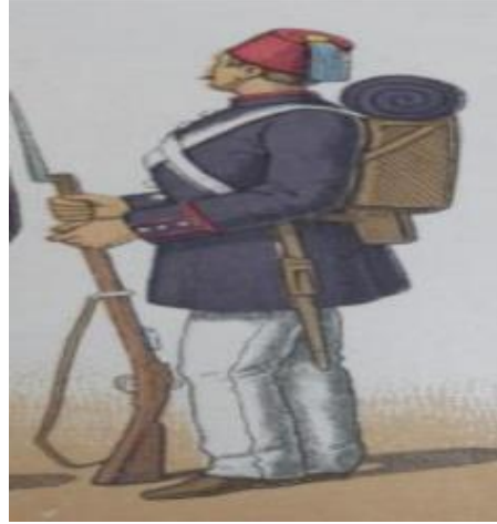
Görsel 1: 1845 Dönemi Osmanlı Asker Resmi

Neferlere aba yağmurluk, başlık, çizme, galoş tabiriyle ayakkabı, beyaz pantolon ve tabanca verilmiştir (BOA, Maliyeden Müdevver Defterler, gömlek no. 12352). Bu bilgiye göre ilk polis neferlerinin başında “başlık” ibaresiyle bir fes, altta beyaz pantolon, ayakta muhtemeldir ki atlı sınıf için çizme, yaya sınıfı için galoş adıyla anılan ayakkabı mevcuttur. Ceket biçimi ve rengi ile ilgili bir bilgi mevcut değildir. Bu nedenle kıyafetlerin askeri ambardan verilmesi nedeniyle dönemin asker üniforması modeline bakıldığında beyaz pantolon üstüne uzun mavi renkte ceket (Mahmut Şevket Paşa, 1325) olduğu Görsel 1’de görülmektedir.