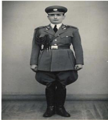
Görsel 10: Polis Müdür Kıyafeti

Üniforma kışlık ve yazlık olmak üzere iki türdür. Kışlık kıyafet, koyu kurşunî renk iken yazlık kıyafet için krem rengi tercih edilmiştir. Meşrutiyet polisinin daha beyaza yakın şekerrengi terk edilmiştir. Yine Meşrutiyet'in kırmızı renkteki zıhları/şeritleri üniformadan çıkarılmış, sadeleşmiştir. Sadece apolette ve spalette kullanımına devam etmiştir. Teçhizat kemerleri bal renginde, yine ceketin üstünde yani dışardan görünür vaziyette bırakılmıştır. Polis Müdürü ilk defa meslek memuriyetinden sayılmış ve kendilerine yanda görüldüğü zere teşkilat tarihinde ilk defa üniforma giyilmiştir. Yalnız gömlek ve kravat kullanımı ilk defa bu sınıfa mahsus kılınmıştır. Sonraki yıllarda kravat ve gömlek kullanımı astta doğru yaygınlaşmıştır. Bu yönüyle gömlek ve kravatlı olarak üniforma giyen sınıf, polis müdürleri olmuştur. Ayrıca teşkilatın kuruluşundan itibaren ilk defa dik yaka ceket, polis müdürlerinde uygulanmamış, devrik yakalı ceketler kullanılmıştır. Gömlek ve kravatla oluğu gibi zamanla devrik yaka ceketler, diğer sınıflarda zamanla kullanılacaktır.