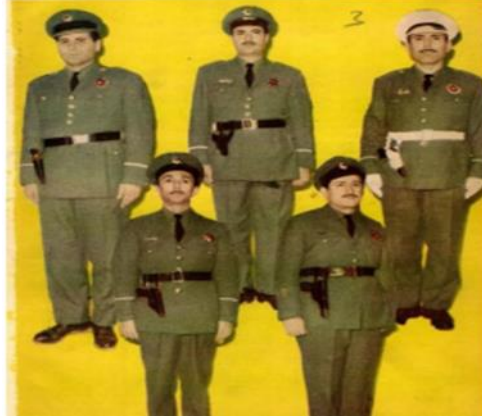
Görsel 12: Polisin İlk Yeşil Üniforması

yeniden eskiye dönülerek krem rengi yazlık cekete geçilmiştir (Resmi Gazete, 1955). 1960 senesinde yapılan bir değişiklikle de polis üniforması koyu mavi renkten koyu lacivert renge geçmiştir (Resmi Gazete, 1960). Kısacası Demokrat Parti Devri'nde Türk polisi "tatlı kibar" tabir edilen mavi tonda renklerle üniforma giymiştir (Polis Mecmuası, 1952). 1962 senesinde ise Askerî Darbe'nin ardı yıllarında, mavi tonda rahatlatıcı (Erim, 2000) polis üniforması yerine asker ile özdeş yeşil renkte üniforma dönemine geçilmiştir (s. 13).