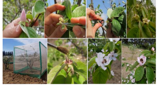
Şekil 1. Polinasyon yöntemlerinde gerçekleştirilen emaskulasyon ve izolasyon süreçleri

Formül 1. Meyve tutum oranı (%) = (Meyve tutan çiçek sayısı/uygulama yapılan toplam çiçek sayısı) x100