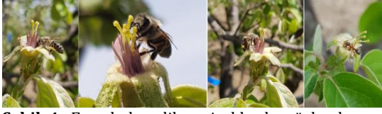
Şekil 4. Emasküle edilen çiçeklerde gözlemlenen tozlayıcı böcek faaliyetleri Figure 4. Pollinator insect activities observed in emasculated flowers.

Tozlayıcı böcekler içerisinde birinci sırada yer alan arılar ile ilgili çalışmalar incelendiğinde, arıların polen toplayıcı, polen ve nektar toplayıcı arılar olmak üzere iki farklı şekilde değerlendirildiği görülmektedir. Arıların çoğu emasküle edilmiş çiçekleri sadece nektar toplamak için ziyaret ederken, az sayıda arı ise anter saplarından polen toplama hareketleri sergilemiştir (Thomson ve Goodell, 2001). Emaskülasyonun arıların davranışlarını değiştirebileceği ve polen toplama ziyaretleri yapmaktan caydırabileceği (K. Goodell ve M. Şahin kişisel gözlem) ve bunun yanı sıra nektar toplarken anormal duruşa neden olabileceği belirtilmektedir (Rademaker de Jong ve Klinkhamer, 1997; Thomson ve Goodell, 2001).