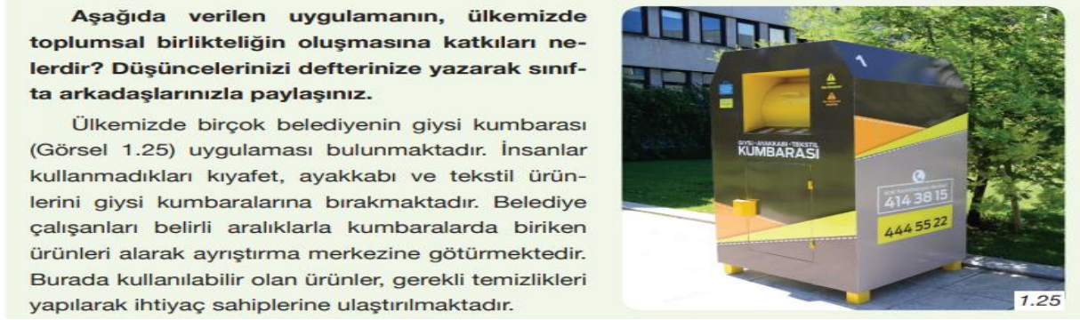
Şekil 8. “Yardımlaşma, Dayanışma, İşbirliği ve Empati” ile İlgili Metin ve Görsel (s.25)

6.sınıf “Biz ve Değerlerimiz” ünitesi “Yardımlaşma ve Dayanışma” başlığı altında çocukların sosyal sorumluluk projesi ile toplumsal birlikteliğin sağlanması adına aşağıdaki metin ve görsel (Şekil 8) verilmiştir.