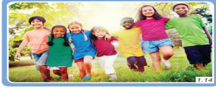
Her bireyin toplumda yeri ve önemi vardır.