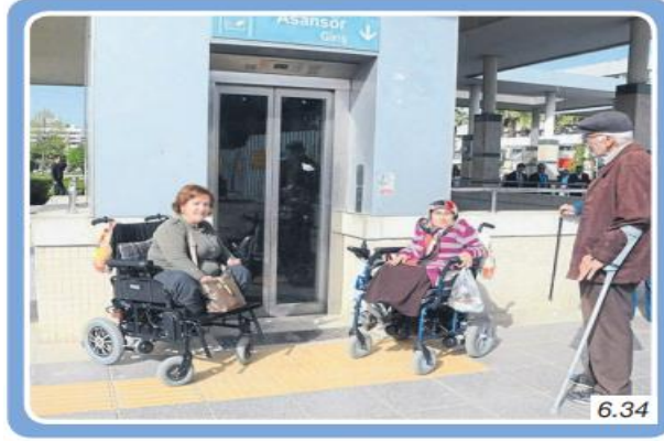
Ülkemizde özel gereksinimi olan bireylere pozitif ayrımcılık yapılmaktadır.

Şekil 10. “Dezavantajlı Grup (Özel Gereksinimli Bireyler)” ile İlgili Görsel (s.230)