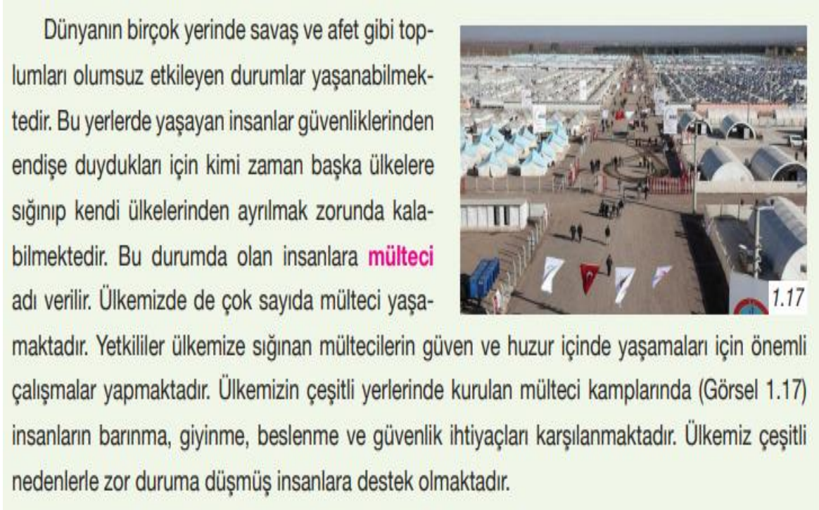
Şekil 2. “Dezavantajlı Gruplar (Sığınmacı)” ile İlgili Metin ve Görsel (s.20)

6.sınıf “Biz ve Değerlerimiz” ünitesi “Farklılıklara Saygı Duyuyorum” başlığı altında çocukların dezavantajlı gruplardan biri olan sığınmacılar konusunda farkındalık yaratmak amacıyla aşağıdaki metin ve görsel (Şekil 2) verilmiştir.