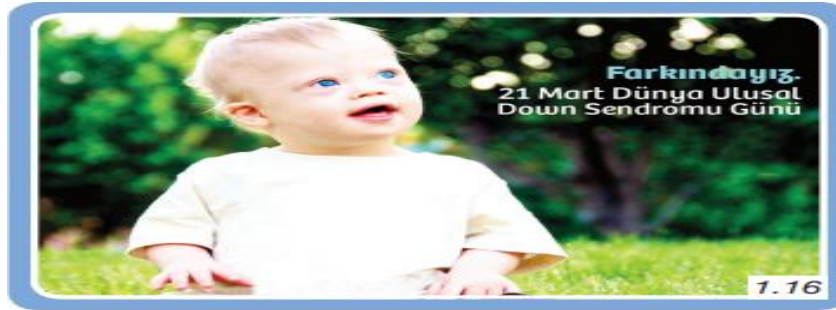
Farklılıklara saygı duymak toplumsal uyumu artırmaktadır.

6.sınıf “Biz ve Değerlerimiz” ünitesi “Farklılıklara Saygı Duyuyorum” başlığı altında çocukların farklı olan bireylere karşı duyarlı olunması ve toplumsal yaşam pratiklerine bunu yansıtmasını aşağıdaki görsel (Şekil 4) verilmiştir.