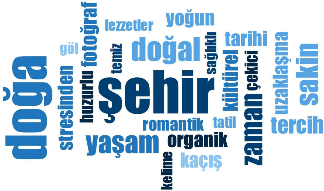
Şekil 1: Katılımcı Görüşlerine Yönelik Kelime Bulutu

Demografik soruya ilişkin verilen katılımcı cevaplarından hareketle, çalışmaya katılan katılımcıların tümünün lisans düzeyinde eğitim aldıkları anlaşılmıştır. Bunların 12'si erkek, 3'ü ise kadındır. Katılımcıların 9'u İstanbul'un Anadolu yakasında ikamet ederken, 6'sı Avrupa yakasında ikamet etmektedir. Katılımcılardan 2'si kamu personeli, 2'si turist rehberi, 1'i fabrika yöneticisi ve geri kalanı ise esnaftır. Katılımcıların 4'ü 30 yaşın altında, 11'i üstündedir. Katılımcılardan 8'i bekar, 7'si ise evlidir. Çalışma kontrol sorusu olduğundan 15 katılımcının tümü daha önce turistik motivasyonlarla Sapanca destinasyonuna seyahat etmişlerdir.