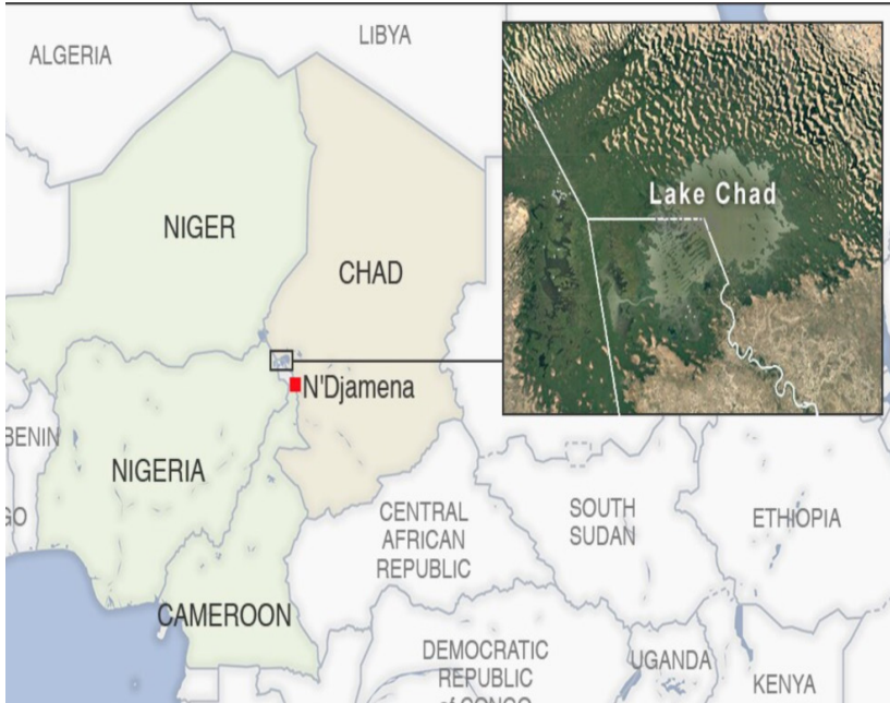
Resim 1:Çad Gölü Havzası

savunmasızlığı ve ekonomik kırılganlığı bünyesinde barındırdığı bir alandır. Bu kronik sorunlarla birlikte ÇGH'sı, duruma göre askeri, isyancı, dini ya da başka bir aidiyete sahip olabilen silahlı grupların sınır ötesi dolaşımından muzdarip bir bölgedir. Dolayısı ile bölge, sorunları fiziksel sınırların dışına taşıyabilen, hacminden daha büyük tehdit kapasitesine sahip bir alanı kapsamaktadır. İşte bu bölgede Boko Haram, ISWAP ve DEAŞ ile bağlantılı diğer gruplar, bölge devletlerini rahatsız eden bir dizi ortak mağduriyetlerden faydalanarak bölgeye kristalize olmayı başarmıştır (Mahmood - Ani, 2018).