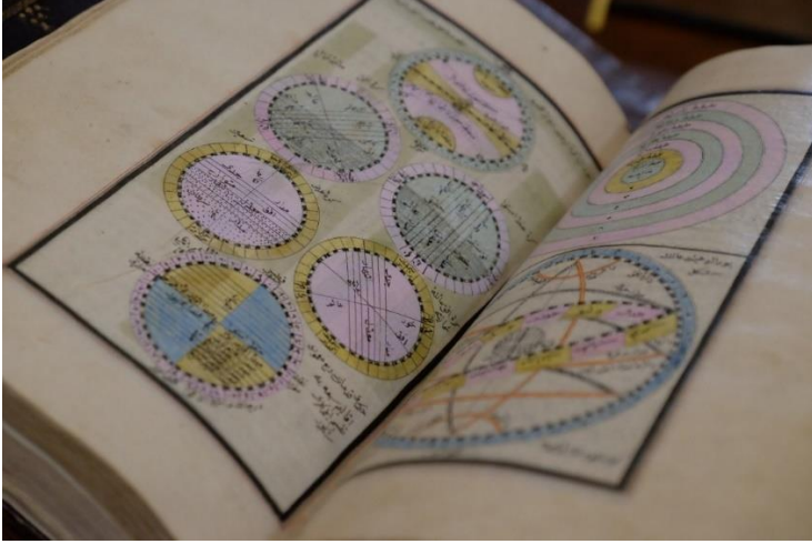
Fotoğraf 2: Erzurumlu İbrahim Hakkı'nın Mâ'rifetnâme Adlı Eserinden Bir Görüntü (Kişisel Arşiv, 2023)