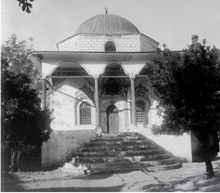
Fotoğraf 5: Necippaşa Kütüphanesinin Revak Bölümünün Camekânla Kapatılmadan Önceki Hali (M. Topuz Arşivi, 1929)