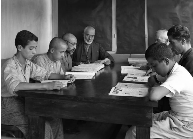
Fotoğraf 3: Kütüphanede Latin ve Arap Harflerini Kullanan İki Farklı Nesilden Bir Görünüm (Y. Göçmen Arşivi, 1963).