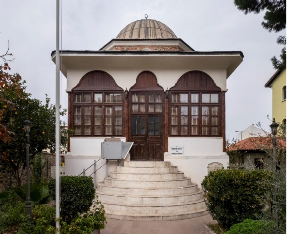
Fotoğraf 1: Necippaşa Kütüphanesinin Güney Cehesinden Bir Görüntü