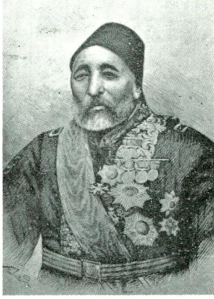
Kayserili Ahmed Paşa'nın ilk Harbiye Nazırlığındaki resmi