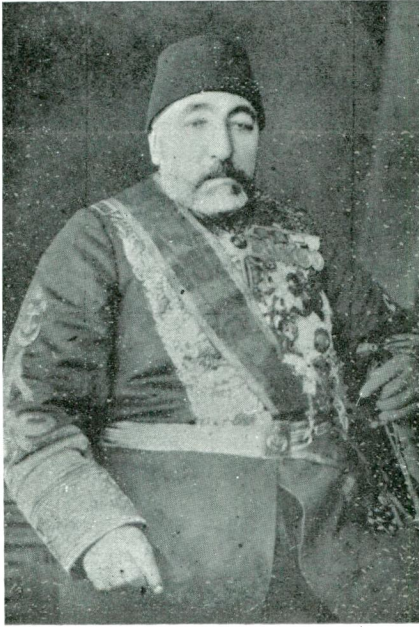
Kayserili Ahmed Paşa'nın son resimlerinden