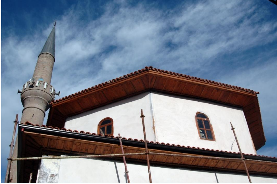
Resim 8- Gaziler Köyü Camii'nin Kubbesi ve Minaresi