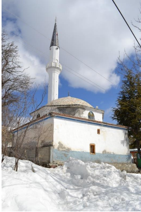
Resim 2- Kayı Köyü Camii'nin Genel Görünüşü