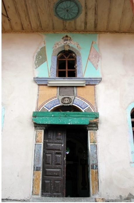
Resim 6- Gaziler K y  Camii'nin Giri 