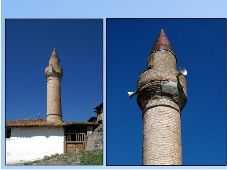
Resim 1- Yerkuyu Köyü Camii ve Minaresinin Görünüşü