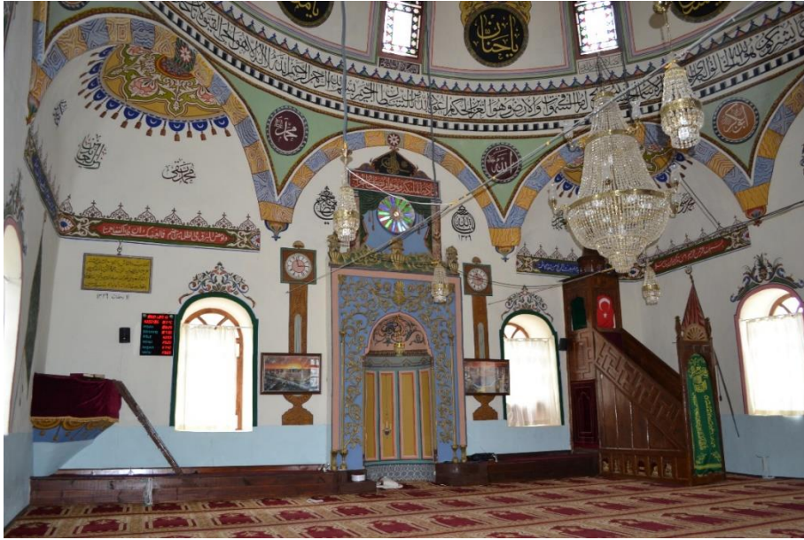
Resim 10- Gaziler Köyü Camii, Minber ve Mihrap