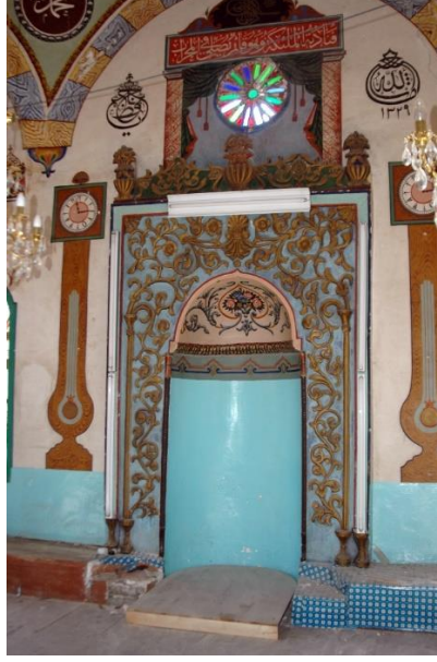
Resim 13- Gaziler Köyü Camii, Mihrabın İki Yanındaki Süslemeler