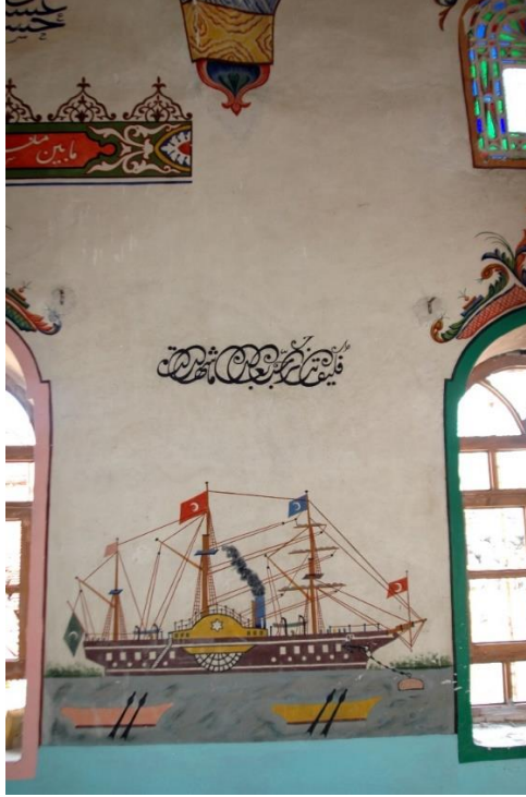
Resim 12- Gaziler Köyü Camii, İç Duvarlar