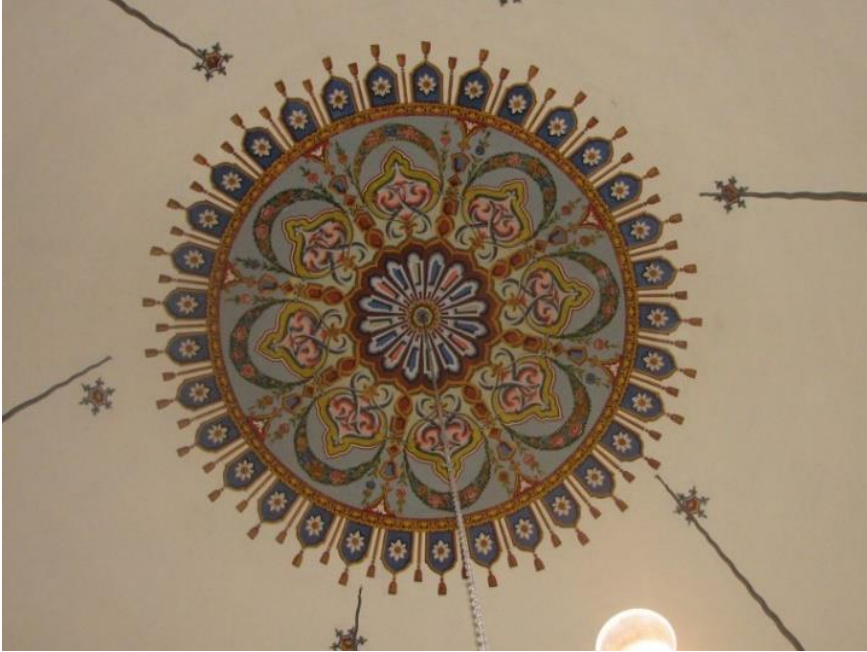
Resim 16- Gaziler Köyü Camii, Kubbe Göbeğindeki Süsleme