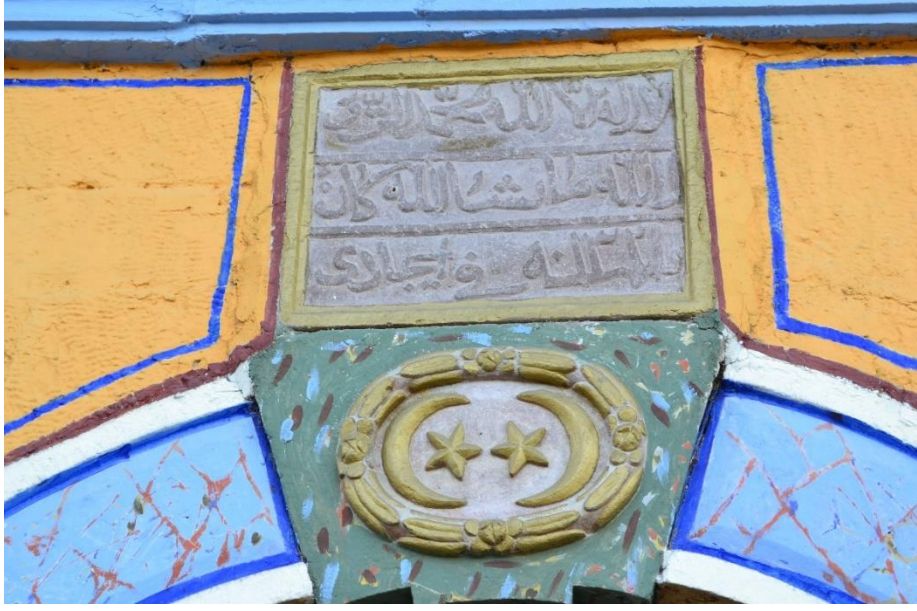
Resim 7- Gaziler Köyü Camii'nin Yapım Kitabesi