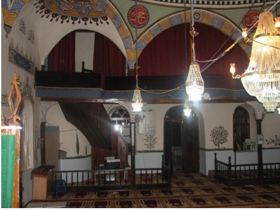
Resim 9- Gaziler Köyü Camii, Kuzeydeki Mahfil