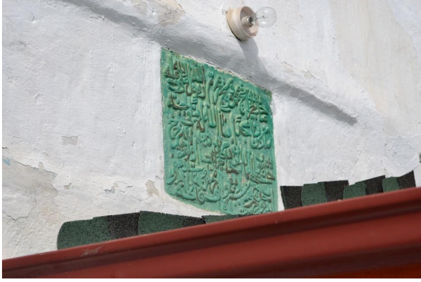
Resim 3- Kayı Köyü Camii Kitabesi