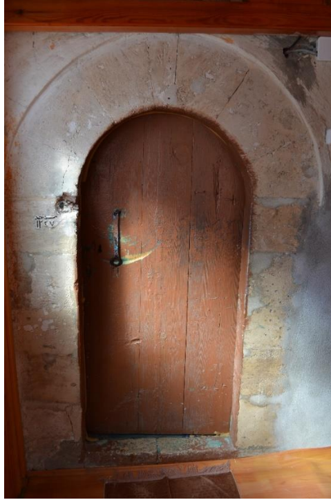
Resim 4- Kayı Köyü Camii Girişi