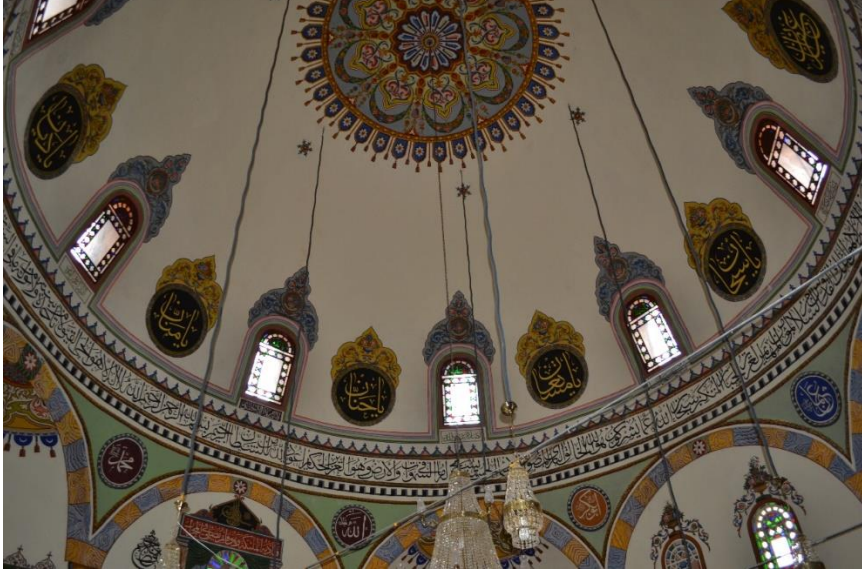
Resim 15- Gaziler Köyü Camii, Kubbe İçi ve Geçişlerdeki Süslemeler