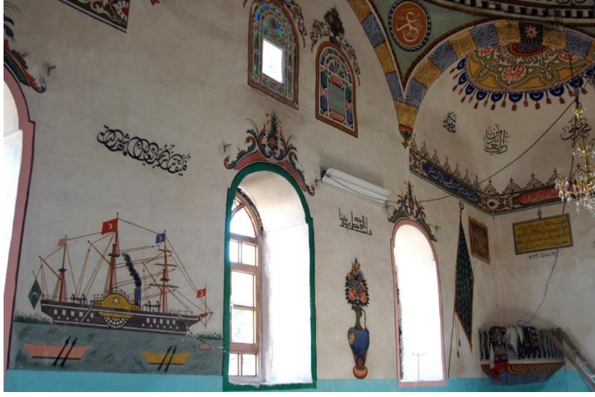
Resim 11- Gaziler Köyü Camii, İç Duvarlar