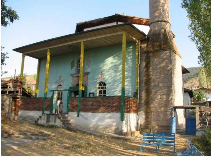
Resim 5- Gaziler K y  Camii'nin Genel G r n f 