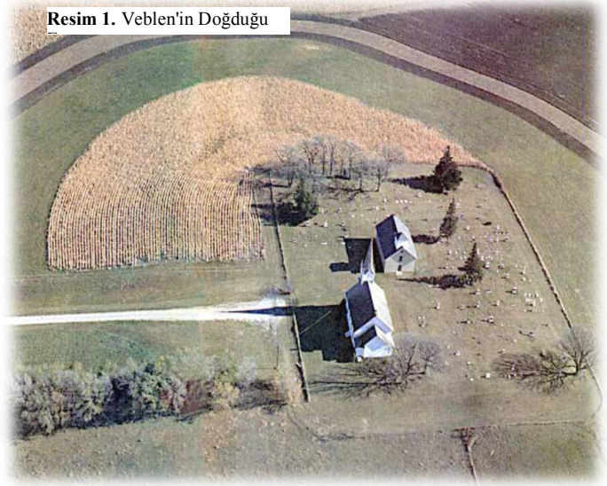
Resim 1. Veblen'in Doğduğu

Veblenin tuhaf hayatı birçok yönden yazdığı kitaplardan daha fazla ilgi çekmiştir. Başka hiç bir iktisatçı anormal davranışlar yönünden onunla boy ölçüşmemiştir. T.B.Veblen geçirdiği bu yabancı çocukluk nedeni ile belki de toplumdan uzak, kurallara uymaz, sessiz ve içine kapanık bir yapıya sahip olmuştur. Ailesi iyi bir disipline sahip ve sıkı kuralları olan Lutherci Protestan dinine inanmakta idi. T.B.Veblen'de papaz olması düşünerek döneminin aydınlanma ve kültür merkezi olarak bilinen Carleton Üniversitesine gönderilmiş fakat T.B.Veblen burayı çok fazla dinsel bulmuş ve ateist inançlarına bağlı olarak yaşamıştır (Dowd, 2000: 3).