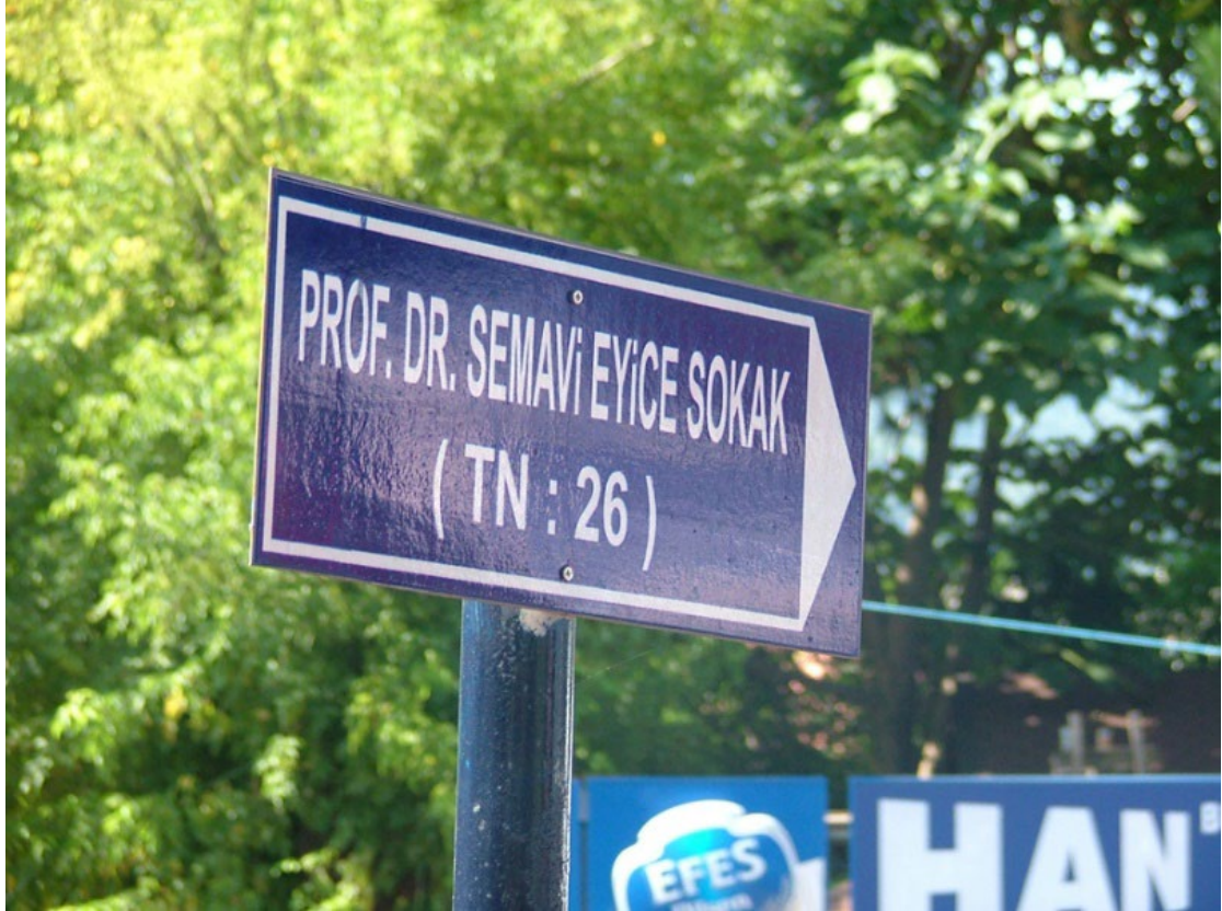
Şekil 10. Prof. Dr. Semavi Eyice Sokađı