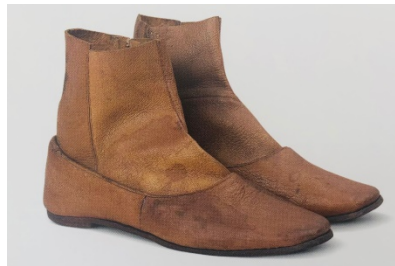
Figür 14: Mevlevi Ayakkabısı (Galata Mevlevihanesi, Divan Edebiyatı Müzesi Env. No:968).

Mevlevilere özel bir ayakkabı yoktur. Herkes gibi onlar da durum, yer ve mevsimine göre, yemeni, kundura, mest, iskarpin gibi ayakkabı giymişlerdir. Yine mevsime göre ince veya yün çoraplar kullanılmıştır. Sema yaparken yalın ayak veya çorap mes kullanılmıştır.