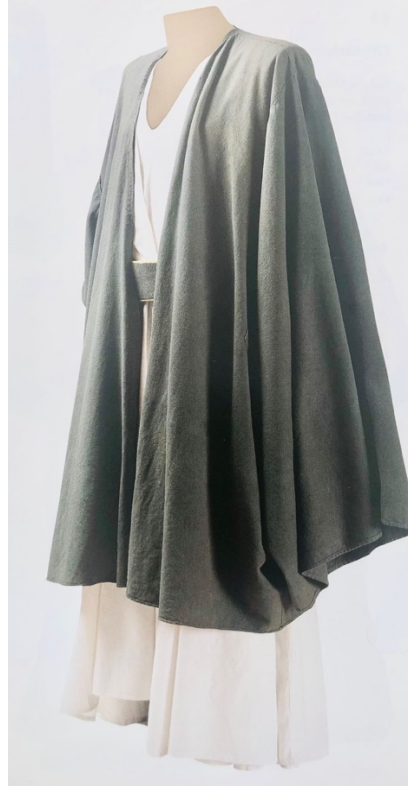
Figür 13:Hırka (Galata Mevlevihanesi, Divan Edebiyatı Müzesi Env. No:467).

Bir başka sembolik anlamı da hem karanlık oluşu hem de üstü örtmek anlamında toprakla ilişkilendirilir ve Mevlevinin kabrini niteler. Semâya başlamadan önce ölüdür ve mezardadır. Semaya başlayınca kabrinden (hırkasından) sıyrılıp, kapalı olan kollarını açarak ellerini havaya kaldır ve uyanıp ilahi âleme yeniden doğarak Allah'a ulaşmayı anlatır.