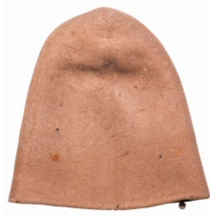
Figür 5: Keçeden yapılmış bir Mevlevi arakiyyesi.

Mevlevilerin sikke dışında başlık olarak kullandıkları ve Arapça ter emici anlamına gelen diğer bir başlık türü de arakiyyedir. Kürevi formda olup genellikle açık renkli ya da deve tüyü renginde, Mevlevi sikkeleri gibi yün ve ya tiftikten keçe ile yapılmıştır. Genellikle tek parça keçe kullanılarak çift kattan yapılmaktadır. Arakiyye yalın kullanılır, sikkede olduğu gibi destar sarılmaz.