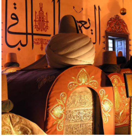
Figür 8: Mevlana Müzesinde bir sanduka üzerinde bulunan istivalı destar.

Mevlevilikte hilafete eren, mutlak hakikati idrak edip kutupluk mertebesine eriştiğine inanan kişinin, sikkesine yerleştiği 2 cm. eninde yeşil bir şerittir. Sikkenin önünden arkaya doğru, sikkenin üstüne ve tam ortasına yerleştirilmiştir. Tennure ve hırkaya da işlendiği görülen istivânın son zamanlarda çok da kullanılmadığı görülmektedir 28 .