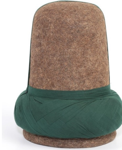
Figür 6: Yeşil Destar sarılmış Mevlevi sikkesi.