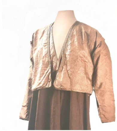
Figür 12: Destegül 44 .

Tennurenin üzerine giyilen; düğmesiz, önü açık, yakasız ve bel hizasında biten uzun kollu bir giysidir. Sema sırasında açılmaması için ceketin sağ alt ucunda ince bir şeritle elifi nemedin kaytanına sıkıştırılır. "Taze, güzel görünümlü ilkbahar güllerinden oluşan demet" anlamına gelir 43 . Gül demetini sembolize ettiğini söylemek mümkündür.