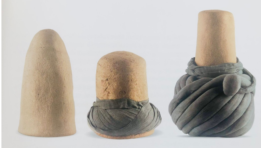
Figür 7: Destarsız sikke, örfi ve cüneydi destar çeşitleri 25 .

Mevlevilikte şeyh ve halifelerin giydikleri destar türleri de renklerine göre ayrılmaktaydı. Peygamber soyundan gelen seyit şeyhler yeşil renk destar sararken, diğerlerinin destar rengi beyazdır. Çelebiler ise siyahımsı mor renk destar kullanırlar böylece renklerle de makamları sembolize etmektedirler 23 . Bir grup Mevlevi de külahına hilafet alameti olarak siyah veya yeşil istiva çekmişlerdir 24 .