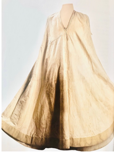
Figür 10: Sema tennuresi (İBB Kütüphaneler ve Müzeler Müd. Env. No:484) 36 .