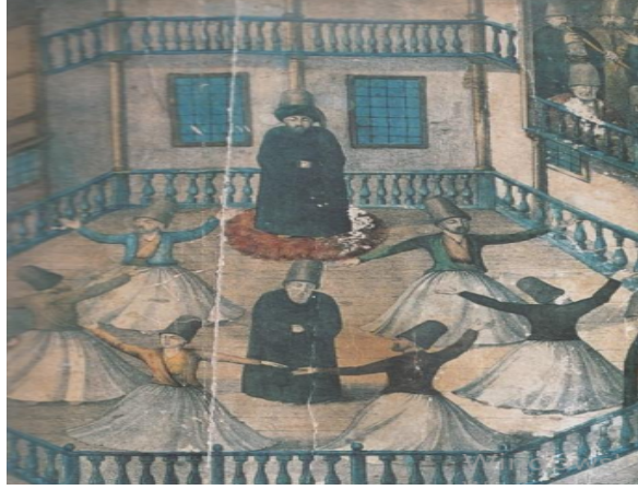
Figür 1: Galata Mevlevihanesi türbe ve semâhanesini gösteren tablo 12 .

Semâhanede meydanın etrafını çeviren sütunların, çatıyı örten kubbeye birleşimi göğü simgelemekte ve hayat ağacı benzeşimi hissedilmektedir 11 . Aynı zamanda semâhane mimarisinde karşımıza çıkan sütun sayıları da Mevlevilikte sembolik anlamlar içermesi açısından önemlidir. Bazı Mevlevihanelerde semâ alanını çevreleyen sekiz, dokuz veya on iki sütun bulunur.