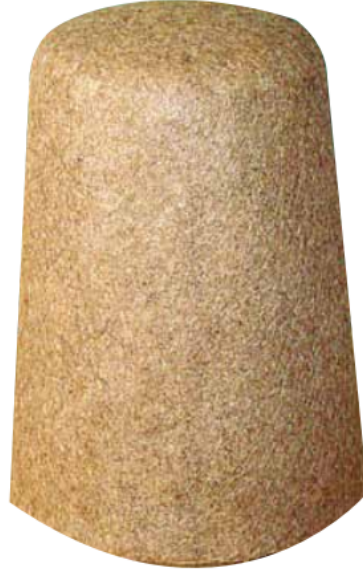
Figür 4: Keçeden yapılmış Mevlevi Sikkesi.

Yapılışında iki kat keçenin birleşmesiyle oluşturulan sikkeler birbirlerine yapışık halde oluşu, çift ile yapılsa da aslında tek bir form alışı; sikkenin derviş, dervişin ise sikke olarak nitelendirildiğini göstermektedir. Sikke aslında tek görünse de aslında bir çifttir. Mevlana'nın deyişiyle "Bende seninle çift, alemde de tek, mücerret olmak isterim" düsturunu yansıtan bir semboldür adeta. Bütün çift olan şeyleri vahdet örtüsü altında gizler 18 . Yani Allah'ın birliğinin işaretidir de tek olmak. Mevlevi dervişleri bu anlayışla sikkeyi başlarına taç yapmışlardır.