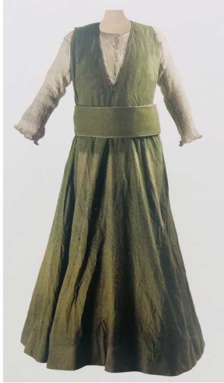
Figür 9: Hizmet Tennuresi (Ankara Etnografya Müzesi Env. No:5586).

Hizmet Tennûresi; günlük işlerde giyilen ve dizi hafif geçen uzunluktadır. Dergâha giren dervişlerin ve görevlilerinin çile doldurdıkları ve hizmet ettikleri matbah-ı şerifteki işlerde giymektedirler. Genellikle siyah ve koyu yeşil renkte kalın kumaşlı olmaktadır.