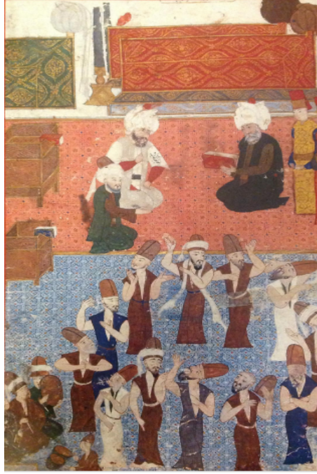
Figür 2: Konya Mevlevihanesinde sema eden Mevlevilerin minyatür çizimleri (Serdar Lala Mustafa paşanın 922/1585 çıktığı Doğu seferi sırasında Konya'da Mevlânâ Türbesini ziyaretinde Mevlevilerin sema edişi, (Nusretname, TSM, H 1363)).

Sembolik olarak ney, sazlığından koparılıp içinin dağlanarak ses çıkarmasına vesile olacak olan deliklerin delinerek oluşturuluyor olması, dervişin çilesini sembolize ederken “İnsan-ı Kâmil” vasfını da nitelemektedir.