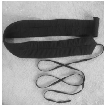
Figür 11: Elifi-Nemed 40 .

Keçe parçası ile dostluk etmektir anlamını taşımaktadır 38 . Bu isimle anılması, uzun keçeden oluşundandır. Arap alfabesindeki ( l = Elif) harfine benzediği için de bu adla anıldığını söylenir. Kumaştan hazırlanılmış kuşağın içine, ince keçe yerleştirilerek yapıldığı için “Elfe-nemed” adı mahiyetini daha güzel anlatır 39 .