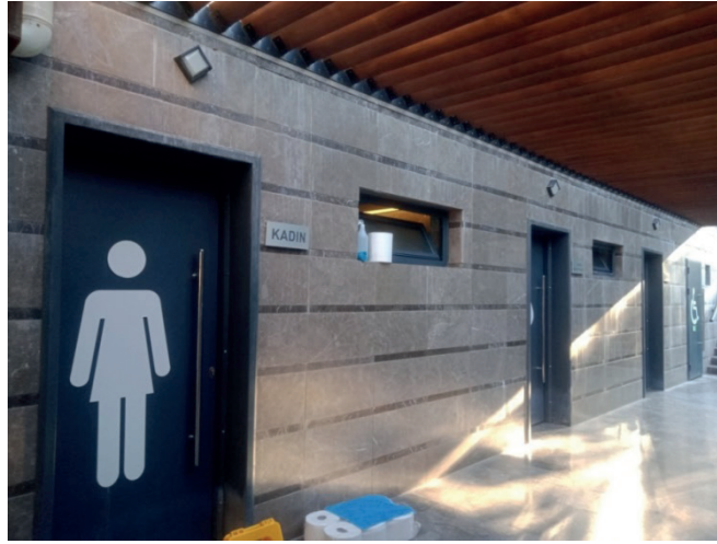
Fotoğraf 12: Zağnospaşa Cami Tuvaletinin Konumu Değişen ve Yenilenen Görünümü (2023)

Kent merkezinde camilerden bağımsız ücretsiz belediye hizmeti olarak sunulan 8 kamusal tuvalet bulunmaktadır. Bunlardan ikisi Toplu Taşıma Merkezi'nde (TTM) yer almaktadır. TTM kentsel ulaşım ağının önemli bir kavşak noktası ve oldukça işlek bir kullanım alanıdır. Buradaki tuvaletlerden biri (Fotoğraf 13) merdivenle inilen yer altı bir konuma sahipken diğeri TTM açık alanında yer almaktadır (Fotoğraf 14).