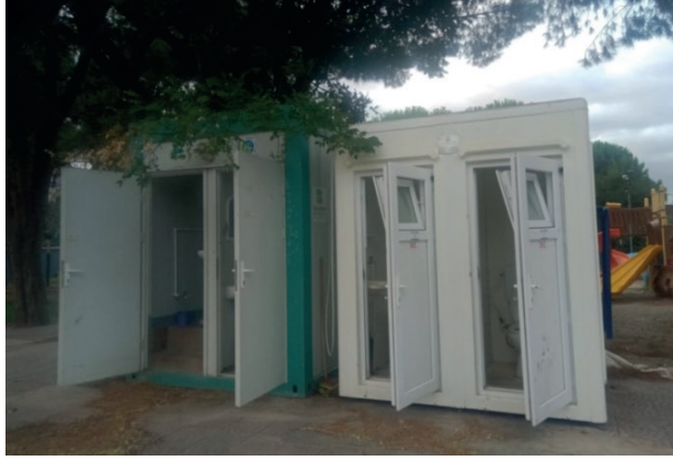
Fotoğraf 1: 75. Yıl Parkı ve Cumartesi Pazarı Bölgesinde Konumlanan Kamusal Tuvalet

Araştırma sahasındaki kamusal tuvaletlerin yarısını cami tuvaletleri oluşturmaktadır. Bunlar içerisinde İbrahimağa Cami, kentin işlek caddelerinden Atalar caddesi ile Kızılay Caddesi arasındaki bir ara sokakta konumlanmıştır. Bu caminin tuvalet konumlanmasında (Şekil 1’de yer alan 2 numaralı) tuvaletler cami avlusu içerisinde 6 yer almakla birlikte erkekler tuvaletinin ön cephede, Bay levhası ile belirgin olmasına karşın kadınlar tuvaleti, herhangi bir levha gösterimi bulunmaksızın yan-arka cephede yer almaktadır. Ayrıca kadınlar tuvaletinin kapısı üzerine “WC BAYAN ERKEK GİREMEZ” ifadesi sonradan el yazısı ile yazılmıştır (Fotoğraf2). Tuvaletlerin konumu bakımından cami içerisinde yer almanın kadınların erişimini zorlaştırmasının yanı sıra erkek tuvaletinin ön cephede ve bir tabela ile gösterilirken kadınlar tuvaletinin hem arka-görünmeyen cephede yer alması hem de bir tabela ile de gösterilmemiş olması cinsiyet temelli eşitsizliğin karşılığıdır. Söz konusu fark kadın tuvaletine ilişkin dışlayıcı bir mekânsal inşadır. Bu tuvalette kadınlar için 1 kabin ve 1 el yıkama yerine karşın erkekler için 2 kabin ve 2 el yıkama yeri mevcuttur. Kadınlar tuvaleti saha araştırması sırasında 2 kez kilitli bulunmuştur. Kadınlar tuvaletinin bulunduğu arka cephede cinsiyet gösterimi olmayan tabelasız bir engelli tuvalet düzenlemesi mevcuttur.