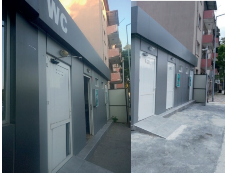
Fotoğraf 15: Robotik Otoparkın Yanında Konumlanan Kamusal Tuvalet

Bir diğer kamusal tuvalet BBB robotik otoparkın bitişğinde yer alan kamusal tuvalettir (Fotoğraf 15). Bu kamusal tuvalette de bay ve engelli tuvaletlerinin önü açık iken kadın tuvaletinin önündeki paravan nedeniyle saklı bir mekânsal inşa dikkati çekmektedir. BBB Robotik otopark yanındaki kamusal tuvalette hem erkekler hem de kadınlar için 2 şer el yıkama yeri ve tuvalet mevcuttur. Ayrıca engelli tuvalet düzenlemesi de bulunmaktadır.