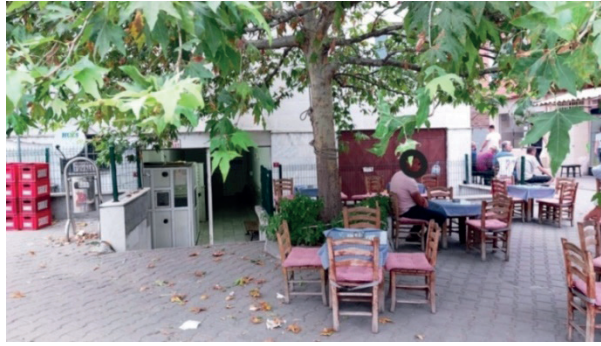
Fotoğraf 6: Köprübaşı Hacı Mehmet Ağa Cami Tuvaletinin Önünde Yer Alan Çay Ocağı Tabureleri

Köprübaşı Hacı Mehmet Ağa Camisi'ne yakın bir noktada yer alan yer alan Kız Dede Cami ve Mescidi tuvaletleri de yine merdiven ile inilerek erişilen bir diğer cami tuvaletidir (Fotoğraf 7). Kız Dede cami tuvaletinde de kadın ve erkek tuvaletlerine ait bay-bayan tabelalarının yanı sıra sonradan duvara yapıştırılmış A4 kağıtlarında erkekler tuvaleti için “erkek wc” kadınlar tuvaleti için ise “bayan wc” işareti mevcuttur. Tabelalardaki bu farklar kadın ve erkek bedenine dair toplumsal anlamlandırmaların mekânsal temsilleridir. Kız Dede cami kamusal tuvaletinde kadınlar için 2 el yıkama yeri 4 tuvalet kabini bulunurken erkekler için 5 el yıkama yeri, 5 pisuvar ve 8 tuvalet kabini bulunmaktadır.