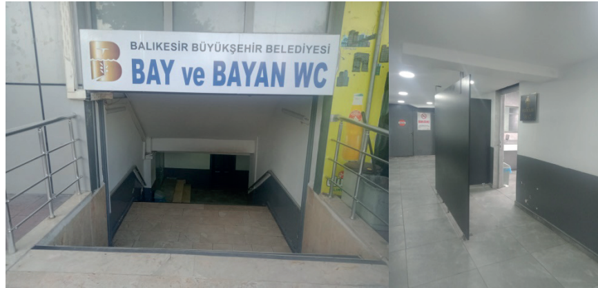
Fotoğraf 13: TTM'de Yer Altı Konumda Yer Alan Kamusal Tuvalet 9 .

Kent merkezinde camilerden bağımsız ücretsiz belediye hizmeti olarak sunulan 8 kamusal tuvalet bulunmaktadır. Bunlardan ikisi Toplu Taşıma Merkezi'nde (TTM) yer almaktadır. TTM kentsel ulaşım ağının önemli bir kavşak noktası ve oldukça işlek bir kullanım alanıdır. Buradaki tuvaletlerden biri (Fotoğraf 13) merdivenle inilen yer altı bir konuma sahipken diğeri TTM açık alanında yer almaktadır (Fotoğraf 14).