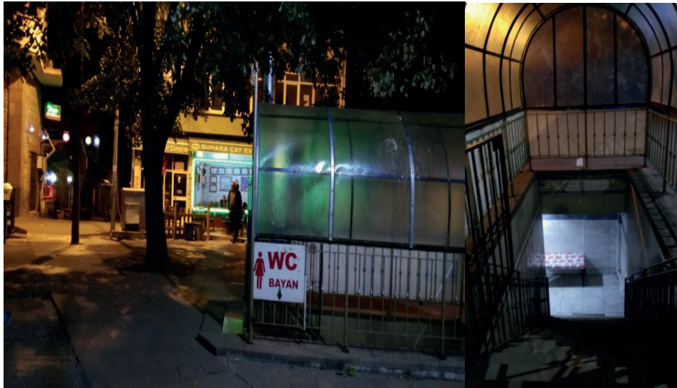
Fotoğraf 11: Zağnos Paşa Camisi Kadınlar Tuvaletinin Yenilenmeden Önceki Görünümü

Zağnospaşa Cami tuvaleti yakın zamana dek diğer cami tuvaletlerinde yaygın olarak görüldüğü şekilde merdivenle inilen yer altı bir konuma sahipti (Fotoğraf 11). Yakın bir zamanda Zağnospaşa cami tuvaleti hem cami avlusundan ayrılmış hem de yer altı konumundan kurtarılmıştır. Buna, yenilenme, aydınlatılma, bebek bakım odası, bayan ifadesi yerine kadın ifadesinin kullanıldığı bir tabela gibi düzenlemeler de eşlik etmiştir 8 (Fotoğraf 12). Zağnospaşa cami tuvaletinde kadınlar için 8 el yıkama yeri ve 8 tuvalet kabini bulunurken erkekler için 14 kabin, 5 pisuvar ve 15 el yıkama yeri mevcuttur.