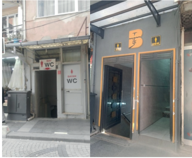
Fotoğraf 16: Yeřilli Caddesi Kamusal Tuvaleti Yenilenmeden Önce (2016) ve Yenilendikten Sonra (2023) Görünümü

Kent merkezinde çarşı bölgesinde, ayakkabıcılar çarřısı, kuyumcular çarřısı gibi adlarla anılan bölgede bir tarafta kadınlar için ve hemen karřısında da erkekler için oluşturulmuř büyükşehir belediye tuvaleti yine diđer tuvaletler gibi merdivenlerle inilen yeraltı konuma sahiptir (Fotoğraf 17). Bu kamusal tuvalette kadınlar için 3 el yıkama yeri ve 3 tuvalet kabini bulunurken tam karřısında yer alan erkekler tuvaletinde 4 el yıkama yeri, 6 tuvalet kabini ve 7 pisuvar bulunmaktadır.