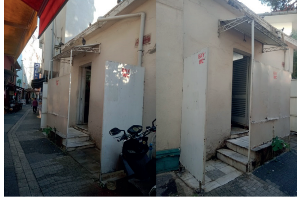
Fotoğraf 8: Çiviciler Sokakta Yer Alan Kamusal Tuvaletin Her İki Yandan Görünümü

Kent merkezinde yine bir cami bağlantısı bulunan, Alaca Mescidi bitişiğinde (Milli Kuvvetler Caddesi ile Cumhuriyet Caddesi arasında) Çiviciler Sokağı'nda konumlanan kamusal tuvalette eşitsizliğin en ilkel hallerinden biri karşımıza çıkmaktadır. Bu kamusal tuvalet sadece erkekler için oluşturulmuş olup ne kadınlar, ne de engelli bireyler için herhangi bir bölme ayrılmamıştır (Fotoğraf 8). Söz konusu sokak boyunca ne de yakınında kadınlar için ayrılmış bir düzenleme yoktur.