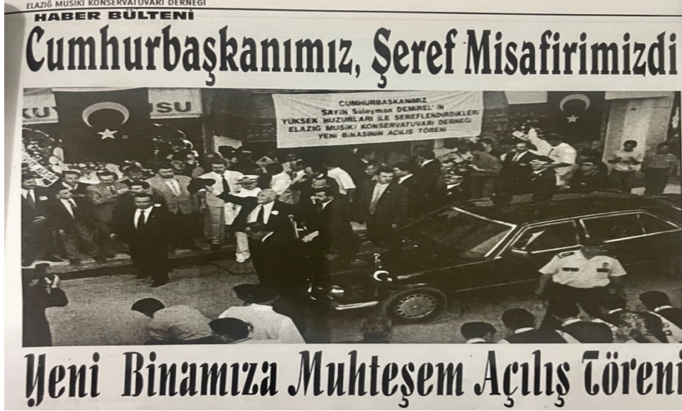
Resim 8: Sn. Süleyman Demirel Elâzığ Musiki Konservatuvarı Derneğinin yeni bina açılışında 9

çıkarak, onu geliştirerek mümkün olabildiğini her defasında ifade edip; “Ben sanatın ve müziğin bütün dallarına destek veriyorum, sanatın bütün dallarına ve müziğin ülkemini her köşesine yayılmasını istiyorum” diyerek bu düşüncelerinde ne kadar duyarlı olduğunu derneğe üye olarak bir kez daha göstermiştir (haber bülteni, 1999: 6)