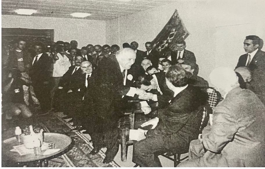
Resim 10: Elâzığ Musiki Konservatuarı Derneği üyesi Sanatçı Mustafa Keser ve Sn. Süleyman Demirel 11