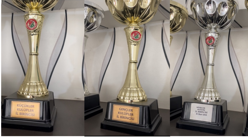
Resim 6: Elâzığ Musiki Konservatuvarı Derneğinin aldığı ödüllerden bazıları