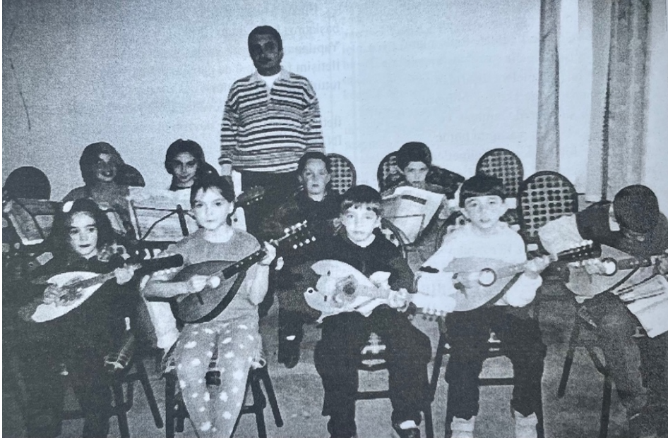
Resim 2: Elâzığ Musiki Konservatuvarı Derneğinde Mandolin Eğitimi 3