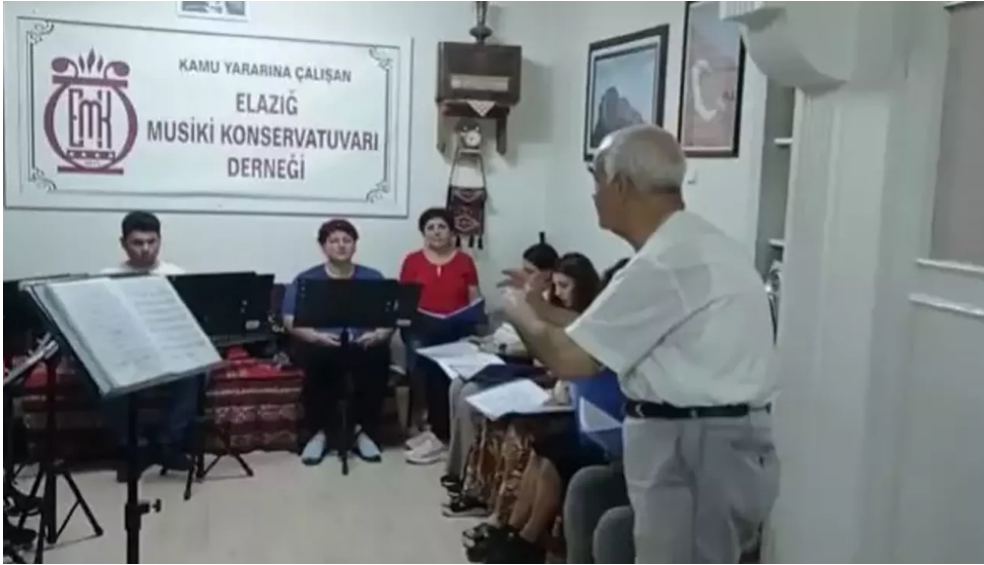
Resim 1: Elâzığ Musiki Konservatuvarı Derneğinde Koro Çalışması 2

Elâzığ Musiki Konservatuvarı Derneğinde ayrıca yöresel halkoyunları eğitimi verilmektedir. Her yıl yapılan sayısız yöresel konserler içerisinde de yer verilen halkoyunları gösterilerinin, il içi ve il dışı yarışmalara katılarak önemli dereceler alması, birçok bölgede halk oyunları kültürünü tanıtması, yöresel müziğe ve kültüre önemli katkılar sağlamaktadır.