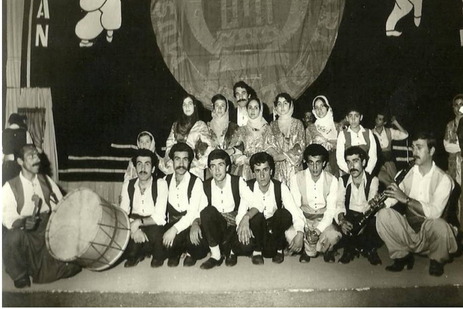
Resim 3: Elâzığ Musiki Konservatuvarı Derneği Halk Oyunları Gösterisi 4