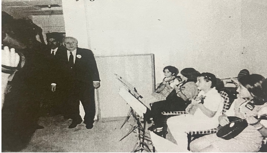
Resim 11: Sn. Süleyman Demirel Elâzığ Musiki Konservatuarı Derneği kurslarını gezerken 12