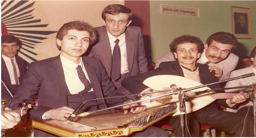
Resim 5: Elâzığ Musiki Konservatuvarı Derneği Konseri 7