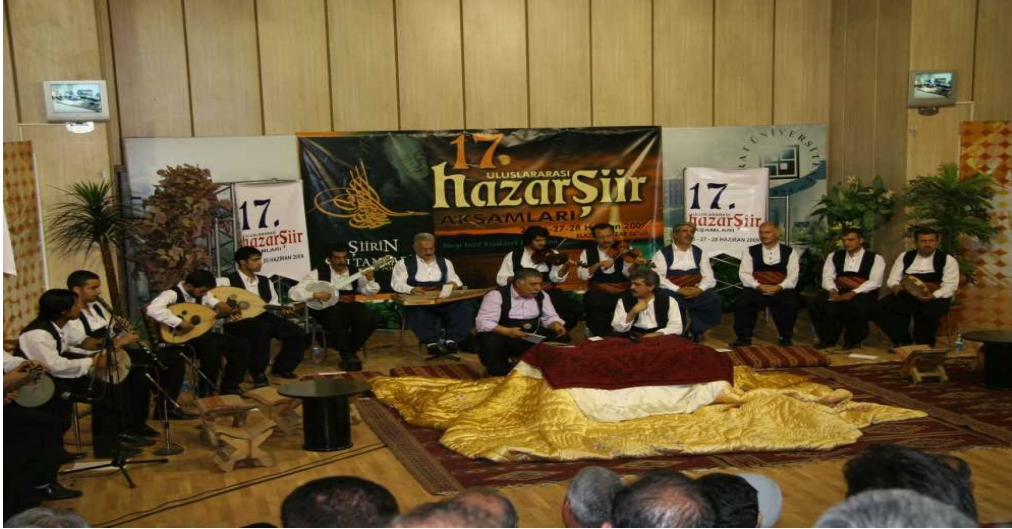
Resim 4: Kürsübaşı Konseri 6

Kürsübaşı Geleneğinin Unesco Kültür Mirasları listesine kazandırılmasında; “Somut olmayan kültürel mirasın korunması kapsamında, Kültür ve Turizm Bakanlığı, Araştırma Eğitim Genel Müdürlüğü tarafından Türkiye’deki sohbet toplantıları konusunda bir çalışma başlatılmıştır. Valiliğin de katkılarıyla Elâzığ-Kürsübaşı geleneği, Şanlıurfa-Sıra Geceleri ve Balıkesir-Barana Geceleri hakkında bir dosya hazırlanarak dünya kültür mirası listesine alınması talebiyle UNESCO’ya sunulmuştur. UNESCO somut olmayan kültürel mirasların korunmasına bağlı olarak yapılan çalışmalarla, 2010 yılında kürsübaşı geleneği UNESCO Dünya Kültür Mirası temsili listesine kabul edilmiştir. Bu konu kapsamında 24-27 Aralık 2010 tarihleri arasında Elazığ’da Kültür Müdürlüğü koordinasyonu ile TRT ve Kültür ve Turizm Bakanlığı tarafından “Kürsübaşı Sohbetleri” belgesel çekimleri gerçekleştirilmiştir. 5