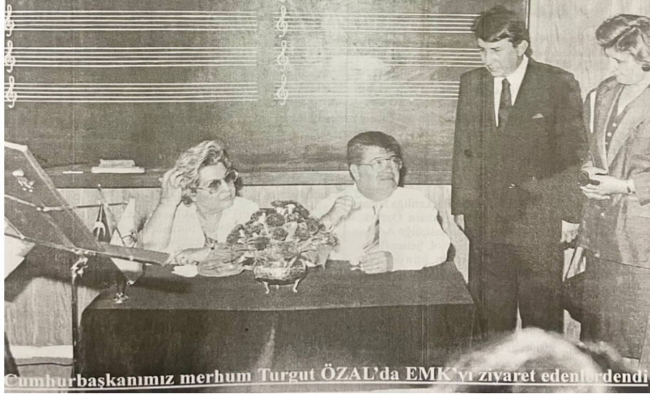
Resim 12: Sn. Turgut Özal'ın Elâzığ Musiki Konservatuvarı Derneği Ziyareti 13