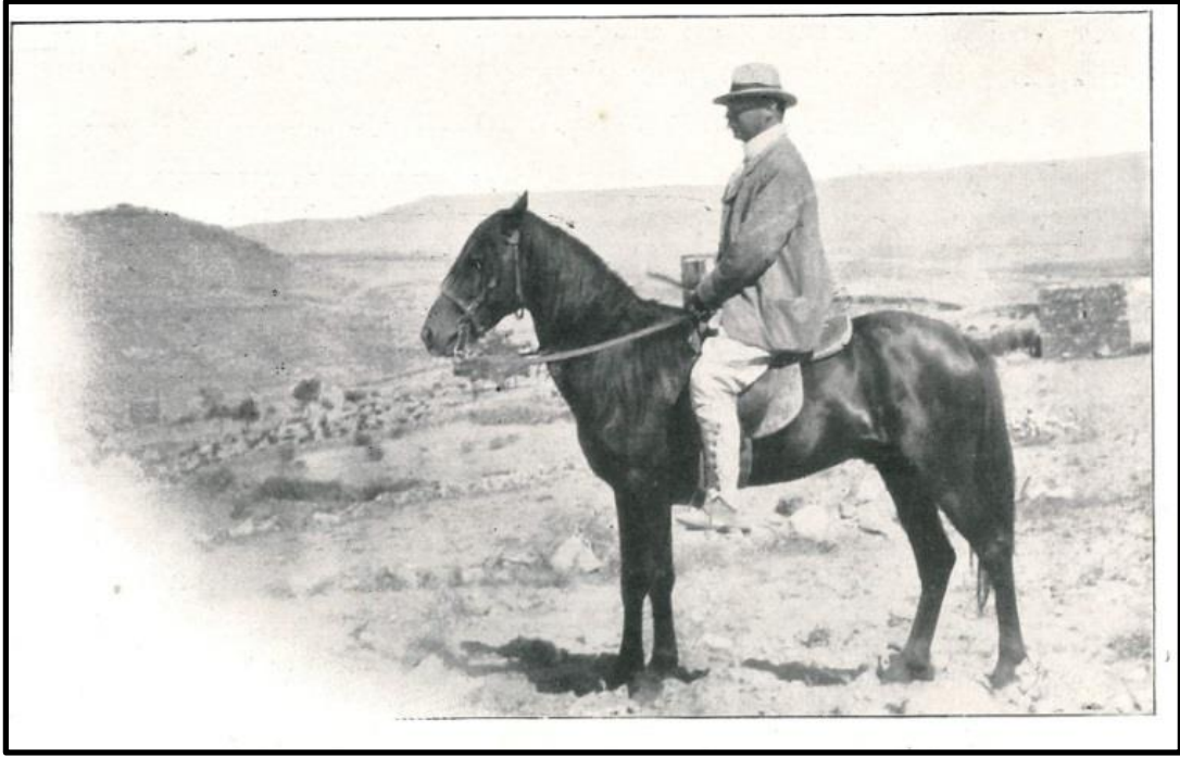
Şekil 1: Alman seyyah Hans Hermann Schweinitz, Kayseri yakınlarında

Hans Hermann Schweinitz, 21 Şubat 1865'te bugün Polonya sınırları içinde kalan eski Alman şehri Liegnitz'te (Legnica) doğdu. Bir alman subayı olan Schweinitz, ayrıca Afrika'da keşifler yapmış bir seyyah ve yazardı. Subaylık eğitiminden sonra Almanya'da göreve başladı, 1891 yılında Doğu Afrika'da faaliyet gösteren kölelik karşıtı komiteye tayin edildi. Bu görevini icra etmek için 29 Ekim 1891'de Napoli'den hareket ettiğinde, sonraki hayatının ayrılmaz bir parçası olan ve 19. asırda yaşayan her insanın arzusu olan seyahatliği de başlamış oluyordu. 9 Kasım'da Yemen'in güneyindeki liman şehri Aden'e ulaştı. 4 Şubat 1893'te Doğu Afrika'daki görevini tamamlayarak Almanya'ya döndü. 1893'te Prusya Savaş Akademisi'nde görevlendirildi. Sonraki yıllarda Anadolu, Kafkaslar, Ortadoğu ve Basra Körfezi'ne uzanan seyahatler gerçekleştirecek olan Schweinitz, 9 Şubat 1918'de Berlin yakınlarındaki Charlottenburg'da öldü. 1