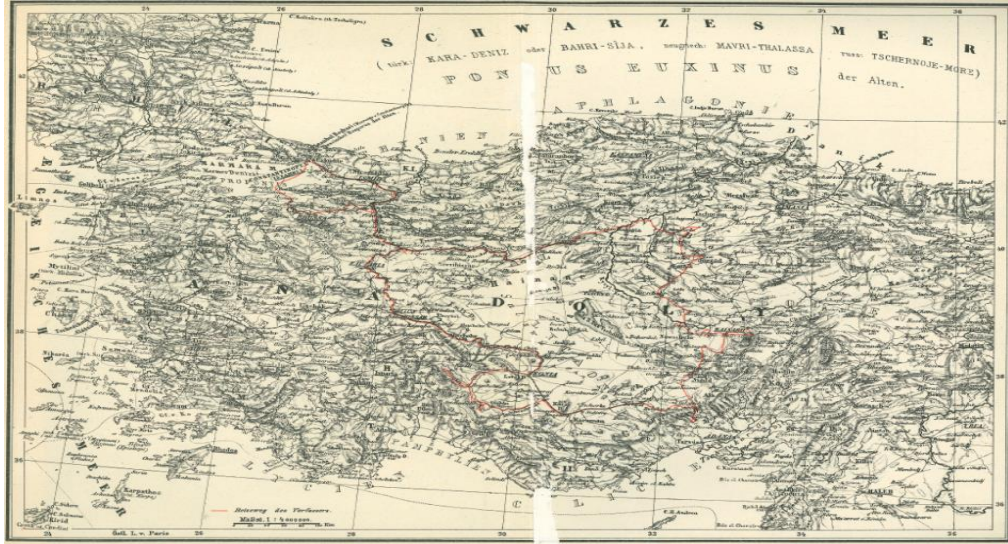
Şekil 6: Schweinitz'in Orta Anadolu seyahati esnasında takip ettiği rota (Kaynak: Hans Hermann Schweinitz, in Kleinasien, Ein Reitusflug durch das Innere Kleasiens im Jahre 1905 , Dietrich Reimer, Berlin 1906)

Kont Schweinitz bu seyahatin ardından 21 Temmuz 1908 tarihinde Alman sefaretinden bir başka izin daha istedi. 1905 yılında irade-i seniyye ile Konya ve Ankara civarında seyahat eden kontu bu defa Batum'dan Trabzon'a, oradan Erzincan, Harput, Diyarbakır, Musul, Bağdat tarihiyle Basra Körfezi'ne kadar bir seyahat icra edebilmesi ve ilmî araştırmalarda bulunabilmesi için kolaylık sağlanmasına dair gerekli tavsiyemelerin verilmesi yönünde iltimas edilmesi isteniyordu. 4 Ağustos 1908'de Doğu Karadeniz'den başlayıp Doğu Anadolu üzerinden Irak ve Suriye'yi içine alarak Basra Körfezi'ne kadar uzanacak bu ikinci seyahat için de irade-i seniyye sadır oldu. 6 Yazar bu seyahatini, 1910 Yılında Türkistan ve İran'ın Kuzeydoğusu'na Oryantalist Seyahat ismiyle kitaplaştırdı. 7 Schweinitz'in Deutsch-Ost-Afrika in Krieg und Frieden, 1894 (Alman Doğu Afrika Savaşı ve Barış, 1894) ve Helenendorf. Eine deutsche Kolonie im Kaukasus, 1910 (Helen köyü. Kafkasya'da bir Alman sömürgesi, 1910) isimli iki eseri daha mevcuttur.