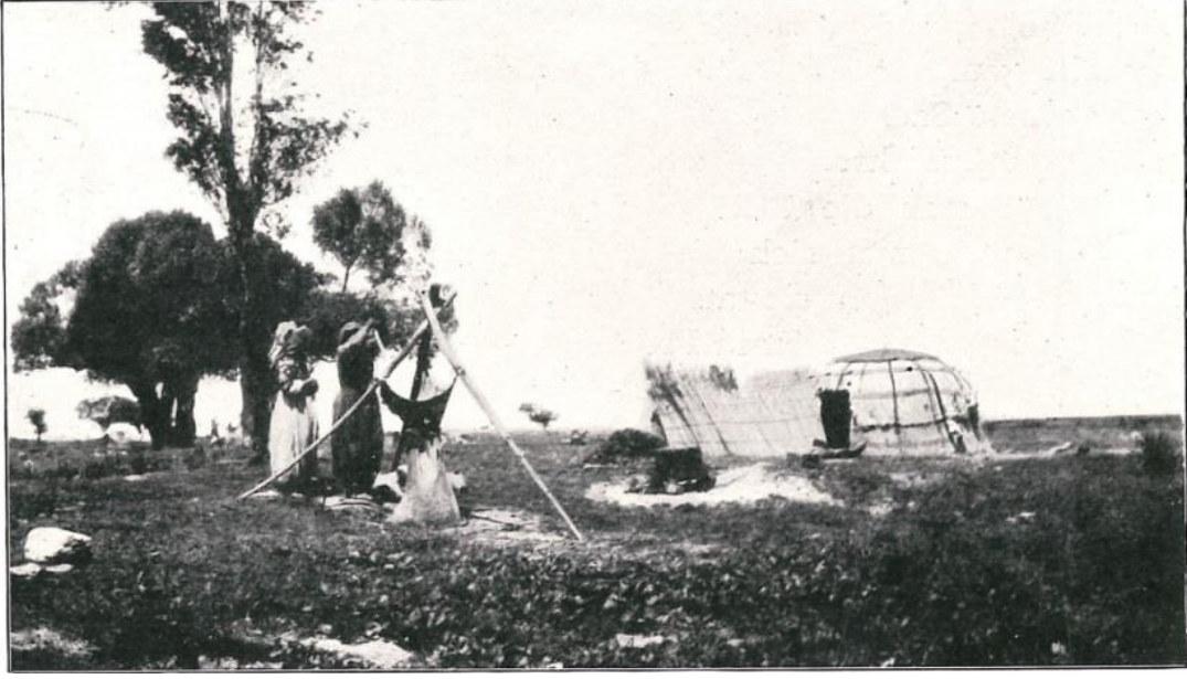
Şekil 4: Konya Ereğli'de yayık yayn yörük kadınları

Kont Schweinitz'in 1905 senesi haziran, temmuz ve ağustos aylarında Orta Anadolu'ya yaptığı seyahatle ilgili kitabında aşağıdaki başlıklar ön plana çıkmaktadır: