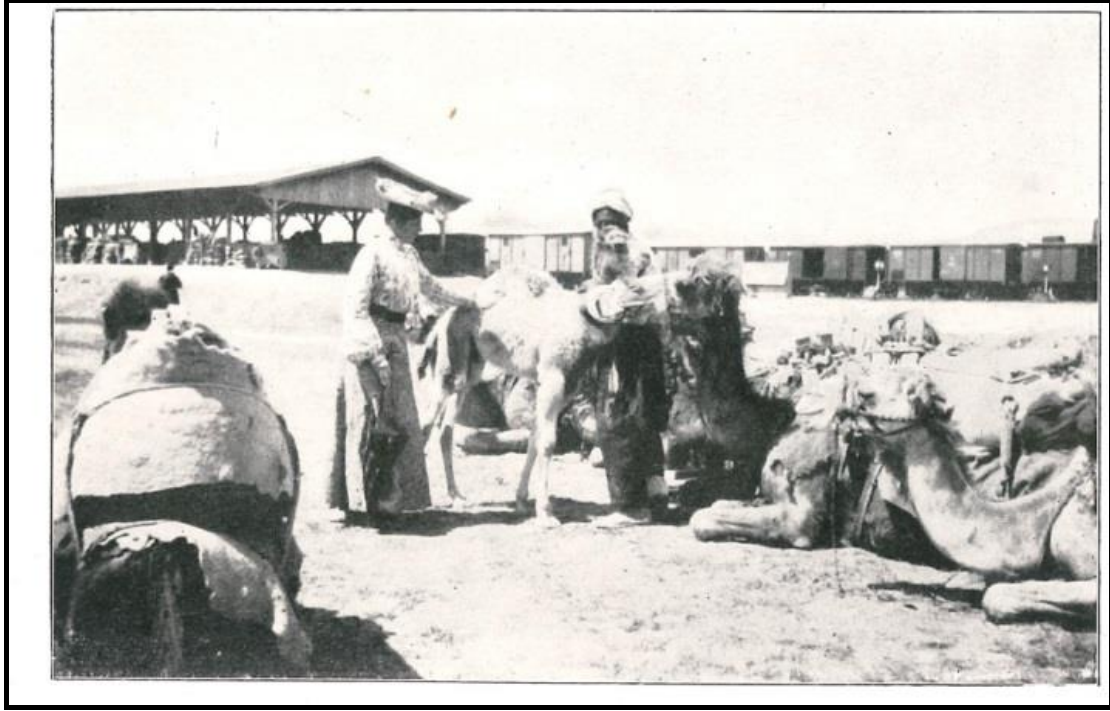
Şekil 3: Konya'da sefer hazırlığı (Kaynak: Hans Hermann Schweinitz, in Kleinasien, Ein Reitusflug durch das Innere Kleinasiens im Jahre 1905 , DietrichReimer, Berlin 1906)

Schweinitz, Orta Anadolu'da gerçekleştirdiği bu seyahatini 1906 yılında Almanya'da yayınladı. Eser, 14 bölümden oluşuyordu. Bölüm başlıkları şöyle idi: