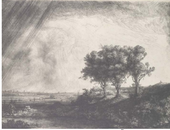
Görsel 3. Rembrandt Harmenszoon van Rijn "Üç Ağaç", Gravür, 1643.

Bu araştırmada; Samuel William Reynolds'ın mezzotint tekniği ile ürettiği peyzaj konulu eserleri incelenmiştir. Bu eserlerin ele alınması sanatçının teknik yaklaşımı ve üretim mantığının anlaşılması açısından önemlidir. Barok dönem özellikleri ile eser üreten sanatçının benimsediği çalışma yöntemini değerlendirmek amaçlanmıştır. Mezzotint tekniğinin sağladığı olanakları ve üretimlerinin ışık gölge ile sunduğu tonal değer aralıkları neticesinde diğer baskıresim tekniklerinden farklılaşması bu araştırmanın yapılmasındaki gerekçelerden biri olmuş ve döneme bu bağlamda ışık tutulmaya çalışılmıştır.