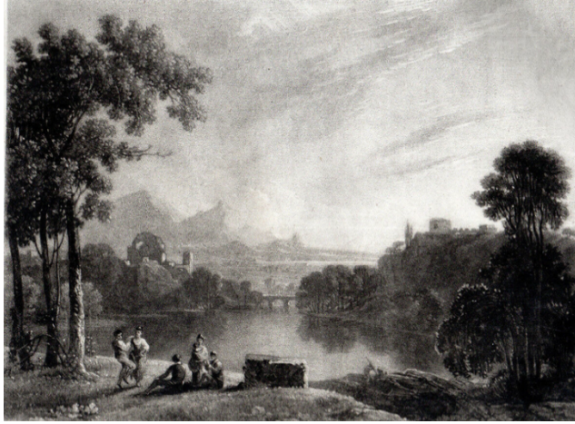
Görsel 10. Samuel William Reynolds, Akşam, 1824.

canlılığı birebir aktarmaktadır. Mezzotint tekniğinin de sunduğu olanaklarıyla ışık yansımaları, kâğıt beyazı, ışığın etki edemediği yerler ise en koyu karanlıkları barındırmaktadır. Reynolds'un ustalığını övmek adına söylenmiş sözlerden bir diğeri de "Belirli bir miktardaki dehasını işine rahatlıkla aktarabiliyordu. Vasat ressamın berbat işleri dahi olsa onları yeni güzelliklere çevirebilir" (Whitman, 1903) şeklindedir.