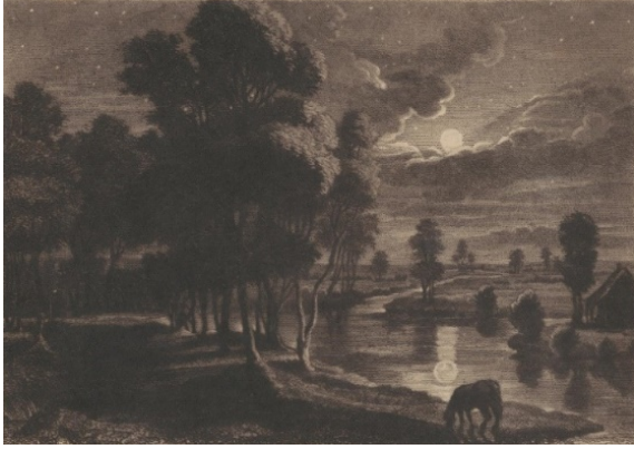
Görsel 7. Samuel William Reynolds, "Hollanda Okulu", 1825.

olmasından Reynolds'un manzaralara karşı büyük bir sevgisi olduğu anlaşıldığı gibi Southall'daki bahçeleri ve Morley Kontu'nun Mount Edgecombe'daki malikanesi tasarladığı da bilinmektedir (wax, 1953, s. 99-100). 1812 yılında Avrupa'nın geneline yaptığı gezilerden sonra deneyimleri doğrultusunda itibarı artmış ve manzara ressamı olarak İngiltere'ye dönmüştür. Reynolds bir mezzotint ustası ve aynı zamanda portre ve manzara ressamı olarak kabul edilmiştir. Samuel Cousins ve David Lucas'a ders vermiş ve ardından devam eden süreçte çırak olarak eğitmiştir. (Delaborde, 1886, s. 317-320) Anlatılarında, Reynolds'un bir gecede büyük bir portreyi hazırlayıp baskısını yaptığı belirtilmiştir.