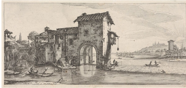
Görsel 2. Jacques Callot "İtalyan Manzaraları", Gravür, 1635. (2312)