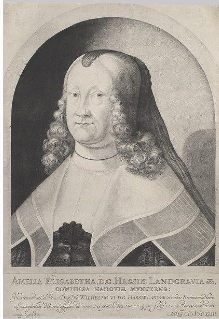
Görsel 4. Ludwig von Siegen, “Hessen-Kassel'den Amelia Elizabeth Landgrave”, 1642.

Çukur baskı yöntemlerinden biri olan mezzotint, Wax'ın (1953, s.13) “akıl çağının bir ürünü” şeklinde tanımladığı mezzotint tekniği, bizlere sunduğu kadifemsi etkiler sonucu diğer çukur baskı tekniklerinden ayrılarak farklı bir konuma sahip olmuştur. Baskıresim tarihi boyunca sanatçılar, kendi özgün çalışmalarını için veya resimlerinin adisyonlarını çoğaltmak amacıyla bir tekniği bir diğerine tercih etme eğiliminde olmuşlardır. Gerekçeleri hem uygulamaya yönelik hem de estetik olmuştur. Gravür, oyma baskıya oranla daha zengin, spontane bir çizgi ve lekellik sunmuştur. Çizginin ön planda olduğu çukur baskı tekniklerinin sunabileceğinden daha zengin siyahlara ve daha geniş bir tonalite yelpazesine fırsat tanıyan tekniklere olan ihtiyaçlara cevaben aquatint ve mezzotint geliştirilmiştir (Balamber, 2020, s. 1).