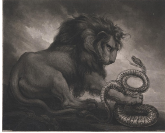
Görsel 5. Samuel William Reynolds, "Aslan ve Yılan", 1799.

Tekniğin icat edildiği 1642 yılından günümüze kadar, bu teknikte ustalaşan ve eserler üreten birçok sanatçı tarihte yer almıştır; Wallerant Vaillant, John Smith, Valentine Green, James Walker, Charles Turner gibi birçok adı duyulmuş sanatçı bunlardan birkaçıdır. Her ne kadar sanat üslupları bir öncekinin devamı niteliğinde olsa da zaman içerisinde değişime uğramışlardır. Barok sanatının, heyecanlı ve hareketli ışık kompozisyon anlayışının, mezzotint tekniği üzerindeki etkisinin, dönem sona erdikten sonra bile bazı sanatçılar için bu etkinin devam ettiği görülmektedir (Görsel 5). Samuel William Reynolds'un ünü diğer sanatçılar kadar olmasa da yapmış olduğu mezzotint baskılarında, özellikle de peyzaj kompozisyonlarında, heyecanlı ve hareketli ışık üslubunu kullandığı görülebilen ve hem eserlerine hem de şahsına değinilmesi gereken bir sanatçıdır.