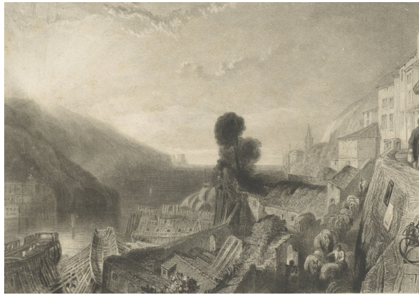
Görsel 9. Samuel William Reynolds, "Dartmouth, Dart Nehri Üzerinde", Mezzotint, 1825.

1806 yılında kurulan İngiliz Enstitüsü'nün tüm sergilerine manzaraları ile katılmış ve benzeri etkinliklere de destekte bulunmuştur (Görsel 7). Çırağı Cousins'in yardımları ile hayatı boyunca 600'den fazla mezzotint plaka oyan Reynolds'ın çalışmalarının geneline baktığımızda yetenekli ve üretken bir sanatçı olarak görülmektedir. Ön planda bir sanatçı ve gözlemcinin yer aldığı, arka planda ise tepelerin üzerindeki binaların yer aldığı manzara sanatçı tarafından barok tonal değerlerinin etkisi ile titizlikle işlenmiştir (Görsel 8).