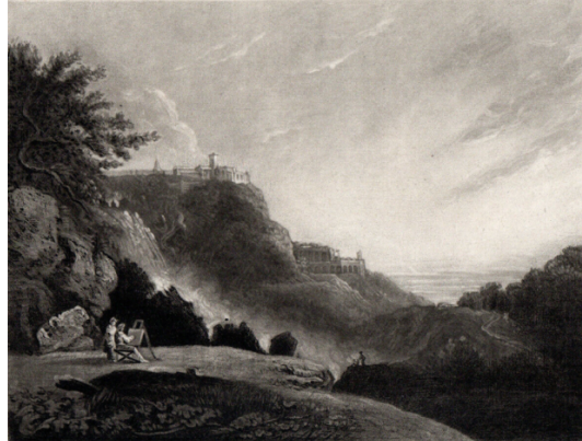
Görsel 8. Samuel Samuel William Reynolds, "Mecenas Villa", 1823.

1806 yılında kurulan İngiliz Enstitüsü'nün tüm sergilerine manzaraları ile katılmış ve benzeri etkinliklere de destekte bulunmuştur (Görsel 7). Çırağı Cousins'in yardımları ile hayatı boyunca 600'den fazla mezzotint plaka oyan Reynolds'ın çalışmalarının geneline baktığımızda yetenekli ve üretken bir sanatçı olarak görülmektedir. Ön planda bir sanatçı ve gözlemcinin yer aldığı, arka planda ise tepelerin üzerindeki binaların yer aldığı manzara sanatçı tarafından barok tonal değerlerinin etkisi ile titizlikle işlenmiştir (Görsel 8).