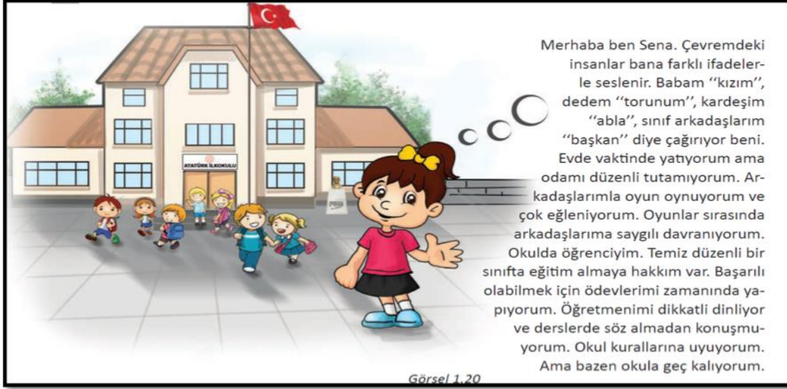
Şekil 1. SB.5.1.3. Kazanımına ilişkin örnek. (Evirgen, Özkan, Öztürk, 2019, s. 22).

“İnsan ve Toplum” kategorisi ile ilişkili kazanım örneğinde yer alan metinde bireyin farklı toplumsal gruplardaki rollerinin üzerinde durulmuştur. Örnek metin yardımıyla bireyin kendi hayatlarıyla benzerlik kurmaları istenmiş ve benzerlik üzerinden toplumsal gruplardaki roller anlatılmıştır. Şekil 2’de “İnsan ve Toplum” kategorisi ile ilişkilendirilmiş sorumluluk kavramına ilişkin örnek verilmiştir.