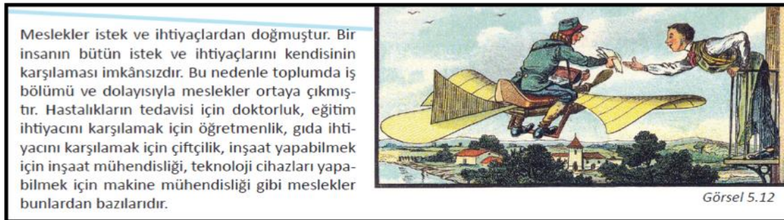
Şekil 3. İş birliği becerisine ilişkin örnek. (Evirgen, Özkan, Öztürk, 2019, s. 123).

“İnsan ve Toplum” kategorisi çerçevesinde sorumluluk kavramına dair sunulan örnek metinde, sorumluluk kavramını anlamı açıklanmış ve öğrencilerden hak ve sorumluluk kavramlarını ayırt etmelerini sağlayacak bir etkinliği tamamlamaları istenmiştir. “Toplumsal Değişme” kategorisi ile ilişkilendirilmiş iş birliği becerisine ilişkin örneğe Şekil 3’te yer verilmiştir.