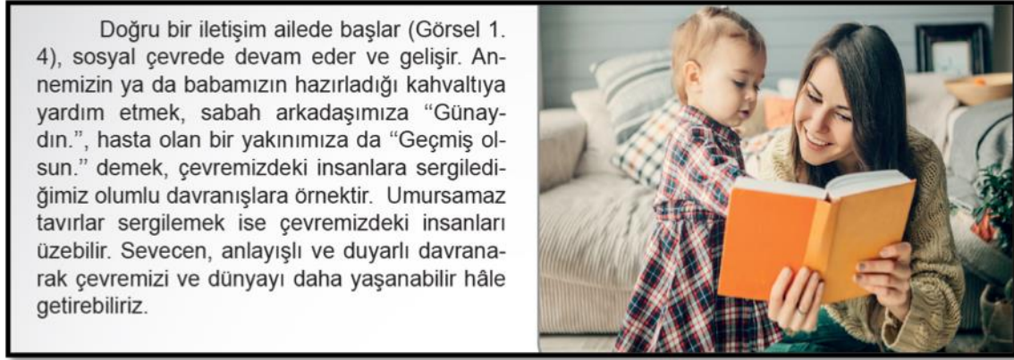
Şekil 10. SB.7.1.2. kazanımına ilişkin örnek. (Açıl, Güvenç, Hayta, Kılıç, 2019 s. 13).

“İnsan ve Toplum” kategorisi ile ilişkilendirilmiş SB.7.1.2. “Bireysel ve toplumsal ilişkilerde olumlu iletişim yollarını kullanır” kazanımına ilişkin örnek Şekil 10’da sunulmuştur.