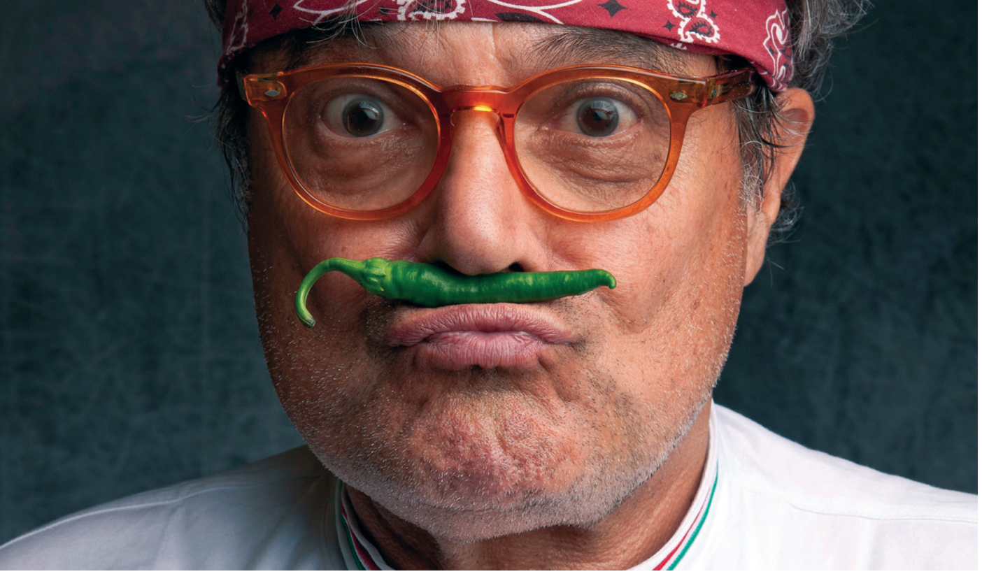
Resim 1. Oliviero Toscani

İtalyan fotoğrafçı ve reklamcı Oliviero Toscani, 28 Şubat 1942 Milano'da dönemin önemli fotoğrafçılarından biri olan Fedele Toscani'nin oğlu olarak dünyaya gelmiştir (Resim 1). 1930-1970 yılları arasında İtalya'nın önemli olaylarını fotoğraflayan Baba Toscani, İtalya'nın ünlü gazetesi Corriere Della Sera'da gazetenin ilk belgesel fotoğrafçısı olarak çalışmış ve görevini faşizm döneminde de sürdürerek çektiği Mussolini fotoğraflarıyla ün kazanmıştır. Farklı ve özgür kişiliği ile tanınan Fedele Toscani'nin, oğlu üzerinde büyük etkileri olduğu ve Oliviero Toscani'nin sanatla iç içe büyümesinin kariyerinin ileriki aşamalarını şekillendirici bir rol oynadığı bilinmektedir. Okul yıllarında derslerine karşı ilgisizliğiyle dikkat çeken ve ders zamanlarını sinemaya gidip film izleyerek geçiren Oliviero Toscani, mimarlığa ilgi duymasına rağmen babasının izinden gitmeyi tercih etmiş ve fotoğrafçılık eğitimi almıştır. Züriç'de bulunan Hochschule for Gestaltung und Kunst'da fotoğrafçılık eğitimi alan Toscani; mezuniyet sonrası-