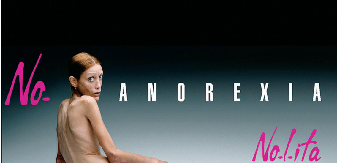
Resim 6. No Anorexia, 2007

Toscani, bu farklılığı aktivist tavırlarıyla, geleneksel reklam anlayışına karşı çıkararak, sosyal sorumluluk çerçevesinde dünyayı sarsan fotoğraflarıyla ve reklam kampanyalarıyla tasarım dünyası içinde fark yaratarak yapmıştır.