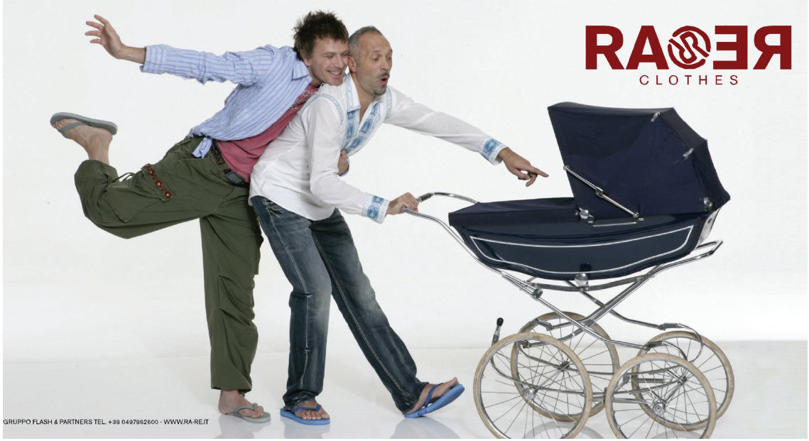
Resim 4. Ra-Re, 2005

rolü hakkında yapılan yorum ne olursa olsun, Hıristiyan ve Nazi haçlarının üst üste konulmasıyla, Hıristiyan inancının, nazi barbarlığı ile müttefik yapıldığını söylemiştir. (Gürel ve Bakır, 2008: 23).