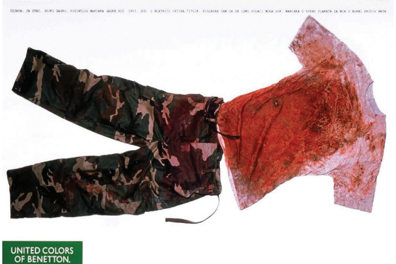
Resim 3. Bosnian soldier, 1992

Bu nedenle Toscani'nin tasarladığı afişin yasaklanması istenmiştir. Paris'te açılan dava ya konu olan afiş, gamalı haç ile Hıristiyan haçını birlikte betimlediği için filmin içeriğinden daha fazla afişin kendisi, filmin gösterime girme gününü tehlikeye sokmuştur. Katolik piskoposlar konferansı başkanı Jean-Pierre Ricard, savaş sırasında kilisenin