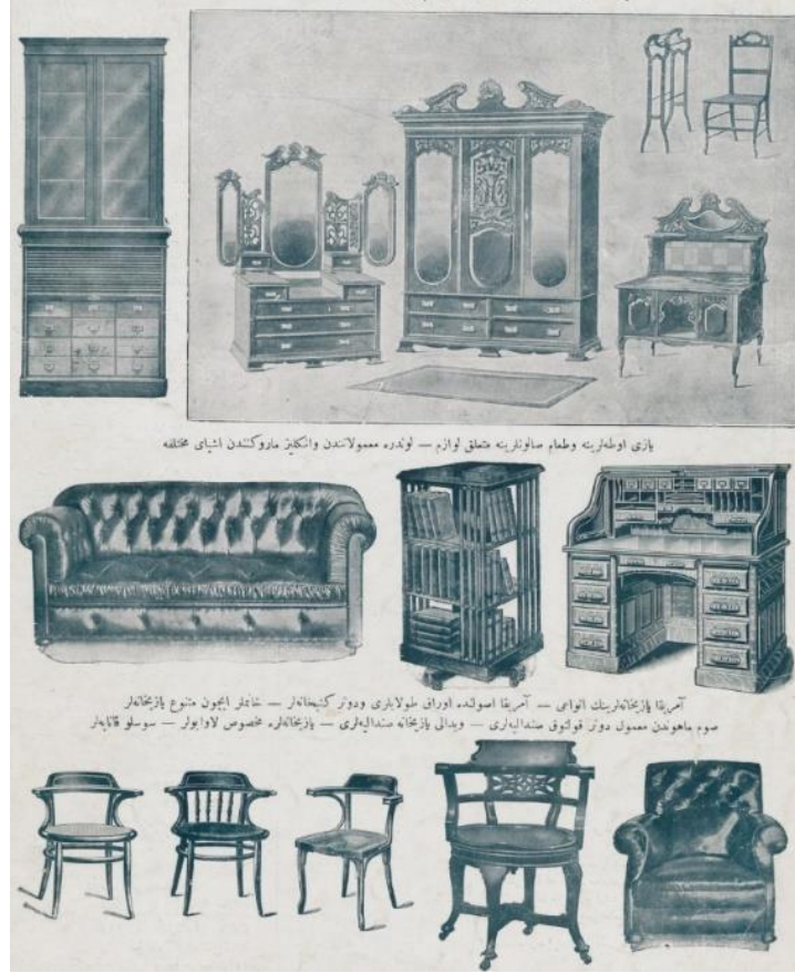
Resim 10. Şehbal Dergisinden Mobilya Reklamı. (Kaynak: Şehbal Dergisi, 1911)

Thonet türevi sandalyeler ve Chesterfield kanepesi biçimindeki oturma mobilyalarının Erken Cumhuriyet Dönemi öncesinde Osmanlı Dönemi'nde yayınlanan Şehbal Dergisi reklamlarında da yer aldığı görülmektedir (Resim 10).