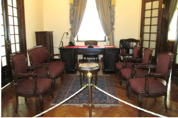
Resim 3. II. Türkiye Büyük Millet Meclisi Cumhurbaşkanlığı Çalışma Odası Mobilyaları

Resim 2'de Erken Cumhuriyet Döneminde, Ziraat Bankası Ankara şubesinde kullanılmış olan koltuk günümüzde restore edilmiş hali yer almaktadır. Sentetik deri kullanıldığı görülen mobilyanın üretildiği dönemde farklı bir malzeme ile kaplandığı; sırt kısmında yer alan kapitone döşemede, kolçaklarda ve oturma alanında doğal malzeme boyanmış deri kullanımının söz konusu olduğu düşünülmektedir. Berjer türündeki bu koltuk üslubun tipik özelliklerinden olan kabriyol bacakları ile Rokoko üslubundadır.