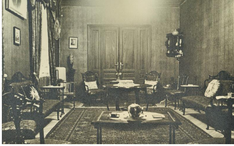
Resim 5. Pembe Köşk Kabul Salonu