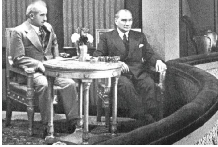
Resim 4. İsmet İnönü ve Mustafa Kemal Atatürk, Halk Evi (Türk Ocağı) Salonunda; Fotoğraf: Cemal Işıksel, 1934 (Kaynak: Türk Dil Kurumu, 2019)

Fransız İhtilali sonrasında ortaya çıkan Ampir üslubunda, önceki dönemlere göre daha hafif işçilik gereken mobilyalar üretilmiştir (Boyla, 2012). Bu mobilya üslubu, 19. yüzyılda Napolyon Dönemi'nde ortaya çıkmıştır (Boyce, 2014). Neoklasik özellikteki bu üslupta mobilya ayakları düz bir şekilde yere iner, arkalık kısımları ise oval ya da kare biçimindedir (Baytar, 2012, s. 43). Ayaklar, kare veya daire kesitli olarak görülür (Kurtoğlu, 1989, s.86). Sütun biçimindeki ayakların üzerinde yükselen kütleler, genel hatların temel geometrik biçimlerde olması, alegorik desenler, rozetler, ahşap üzerine metalik süsleme uygulamaları bu üsluptaki oturma mobilyalarında sıkça görülmektedir (Rouaix, 1893, s.49). Bu üslubun en belirgin özelliklerinden biri kolçakların ön ayaklarla uyumlu biçimde silindirik olarak devam etmesidir (Kurtoğlu, 1989, s. 86).