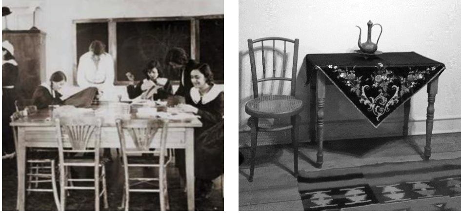
Resim 8. (Solda) Bursa Necati Bey Kız Enstitüsü Dikiş Atölyesi (Kaynak: Aydın ve Özdemir, 2019, s.180); (Sağda) Ankara Keçiören Vehbi Koç Bağ Evi, (Kaynak: Yazar Arşivi, 2018)

Bursa Necati Bey Kız Enstitüsü Dikiş Atölyesi'ne ait görselde (Resim 8) Thonet üslubuna ait tipik bir sandalye örneğinin kullanıldığı görülmektedir. Burada eğrisel formlardan oluşmuş bir sırtlık kullanımı ile 'Fanback' ismini alan bir Thonet türevi sandalye olduğu anlaşılmaktadır. Masif ahşap parçalardan oluşan yüksek sandalye ayak kısımlarında kayıtlara sahiptir. Sırtlık kısmında iki eğimli ahşap parça bulundurmaktadır. Bir başka örnek; Ankara, Vehbi Koç Bağ Evinde bulunan ve Erken Cumhuriyet Dönemi'nde de kullanıldığı anlaşılan sandalyenin (Resim 8), başta dairesel formuyla ayakları birleştiren kayıt parçası olmak üzere birden çok bükülmüş ahşap parçası bulunmaktadır. Oturma yüzeyinde Thonet üslubu ile yaygınlaşan hezeran örgü bulunmaktadır. Bu örnekler, Thonet üslubuna benzer oturma mobilyasının kamusal mekanlarda kullanımının yanı sıra eğitim ortamlarında ve günlük yaşama ait konutlarda da kullanıldığını göstermektedir.