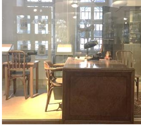
Resim 7. Türkiye İş Bankası İstanbul Şubesi (1928) Banka Çalışanları Oturma Alanları

Osmanlı Döneminde Thonet türevi sandalyeler, Osmanlı Bankasının ülkenin dört bir yanındaki şubelerinde kullanılmıştır. 1928 yılında Türkiye İş Bankası İstanbul Şubesi olarak kullanılmaya başlayan yapıda (Resim 7), Thonet türevi oturma mobilyaları mevcuttur. Resim 7'de masaya yanaştırılmış biçimde orta kısımda yer alan sandalyenin eğimli parçaları ve yay formunda kolçak biçiminde devam eden ahşap sırtlık detayı görülmektedir. Thonet'in tasarlayıp ortaya koyduğu biçimde masif ahşap bükme parçalara sahiptir. Görselin sağ ve sol uçlarında yer alan sandalyelerin sırtlık ve ayaklar olarak devam eden parçasında da ahşap bükme işlemi kullanıldığı veya bu işlemde referans olarak bu formların oluşturulduğu anlaşılmaktadır.