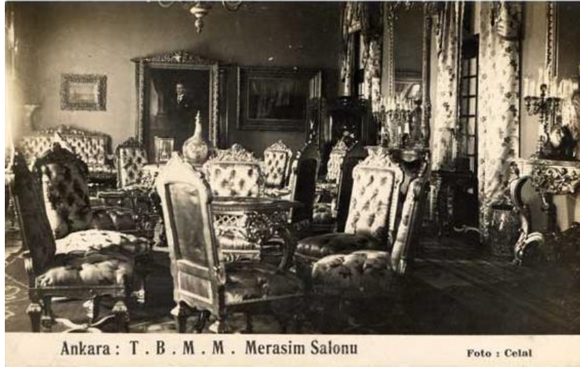
Resim 1. II. Türkiye Büyük Millet Meclisi Merasim Salonu.

ayaklar ve ayakların arasında yer alan kayıtlarda vurgulu şekilde bulunmaktadır (Boyla, 2012). Barok üslubu mobilyalarda ayaklar, tipik olarak ana hattı yere dik açıda uzanır şekildedir (Hincman, 2009, s.232) ve mobilya ayakları arasında çapraz kayıt kullanımı karakterize olarak kendini göstermektedir (Elibol vd., 2014). Resim 1’de, 1924-1960 yılları arasında II. Türkiye Büyük Millet Meclisi olarak kullanılan yapının Merasim Salonundaki oturma mobilyaları görülmektedir. Bu yapıdaki bir grup mobilyanın İstanbul’daki saray veya kasırlardan sağlandığı ifade edilmiştir (Kılıç, 2021, s. 81). Resim 1’de görülen mobilyaların üslup özellikleri Osmanlı Dönemi’nden beri kullanımda olan saray veya kasır yapılarından sağlanan gruptan olduğu düşünülmektedir. Nitekim, Göcek (1999, s. 98) Barok üslubunun Osmanlı mimarisi ve sanatındaki görünümünün 18. yüzyılda olduğunu ve 19. yüzyılda özellikle cami bezemelerinde görüldüğünü belirtmiştir. Resim 1’de görülen oturma mobilyalarının biçimsel özellikleri incelendiğinde, parlak kumaşla kaplı döşenmiş oturma alanı ve sırtlık dikkat çekmektedir. Bu dönemde kullanılan temel malzemelerden biri olan masif ahşap, mobilyaların iskeletini oluşturmaktadır. Ayak kısmında Barok üslubunu ifade eden temel unsurlarından çapraz ara kayıt bulunmaktadır. Yoğun kapitone içeren ve kabarık döşemeleri ve taç kısmında simetrik ahşap bezemeleri, mobilyaların Barok üslubunda şekillendiğini gösterir niteliktedir.