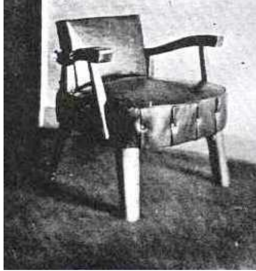
Resim 12. Sedat Hakkı Eldem'in Tasarladığı Mobilya (Kaynak: Eldem, 1931, s.274)

Almanya'da bulunan Bauhaus okulunun etkileri, Erken Cumhuriyet Türkiye'sinde fonksiyonun öne çıktığı sade biçimli mobilyalar olarak ortaya çıkmıştır (Uzunarslan, 2002, s. 105). 1930-1940 yılları arasında İstanbul Güzel Sanatlar Akademisinde olan hocalar çeşitli çağdaş mobilyalar üzerinde çalışmış ve üretmiştir (Küçükerman, 1999, aktaran Şumnu, 2013, s.41). Bu hocaların da içerisinde yer aldığı bir grup mimar, modern hareketin getirdiği biçimsel özellik ve nitelikleri taşıyan konut mekanları ve mobilyalar tasarlamıştır (Gürel, 2009). Günümüzde bu dönemde tasarlanmış çağdaş mobilya örneklerine Dokümantasyon ve Arşivleme Türkiye'de Modern Mobilya (DATUMM) projesi kapsamında oluşturulan envanterden erişmek mümkündür (Ultav ve diğerleri, 2016).