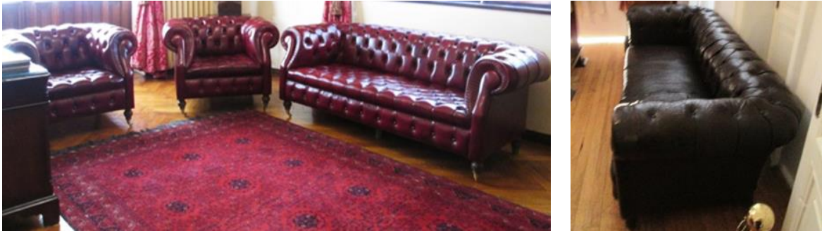
Resim 9. (Solda) II. Türkiye Büyük Millet Meclisi Başkanlık Odasında Bulunan Chesterfield Kanepesi ve Koltukları; (Sağda) Direksiyon Binası'nda Mustafa Kemal Atatürk'ün Çalışma Odasında Bulunan Chesterfield Kanepesi.

Chesterfield olarak adlandırılan kanepelerin genel olarak devlet idaresinin gerçekleştirildiği kamu yapılarında kullanıldığı ve birer statü imgesi taşıdığı anlaşılmaktadır. Bu mobilyaların yüzey kaplama biçimlerinde farklı tasarım yaklaşımlarının olduğu görülmektedir. Örneğin; II. Türkiye Büyük Meclisi yapısı, meclis başkanlığı odasında bulunan koltuklar ve kanepenin (Resim 9) üç adet ayak ekleri hariç tüm yüzlerinin deri kaplanmış olduğu görülmektedir. Kolçaklar ve sırtlıktaki dairesel devam eden kapitoneler dikkat çekmektedir. Oturma kısmı ve ön yüzeylerinde de kapitone işlemi devam etmiştir.