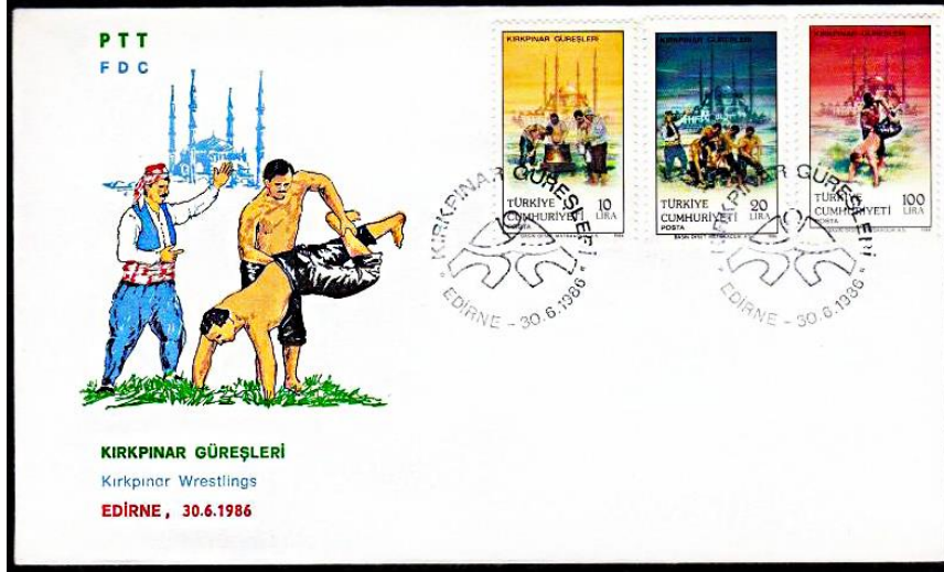
Şekil 7. Kırkpınar güreşleri temalı ilk gün zarfı (Pulhane, 1986)

Şekil 7'de 30.06.1986'da PTT tarafından tedavüle çıkarılan ve Kırkpınar güreşleri başlıklı çalışmayı oluşturan 155,00 ETL bedelli bir adet ilk gün zarfına yer verilmiştir (Pulhane, 1986). Yatay formata sahip olana bu tasarımın sağ üst kısmına Kırkpınar güreşleri başlıklı çalışmada kullanılan üç adet anma pulu yerleştirilmişken sol kısmına yukarıdan aşağıya doğru Selimiye Camii görseli hemen altına çift dayak pozisyonu ile iki elinin üzerine duran bir güreşçi ve onu yakalayan diğer güreşçi, yanına ise müsabakayı yönetmek üzere hakem komitesi tarafından görevlendirilen bir hakem figürü yerleştirilmiştir. Kırkpınar güreşleri ifadesinin Türkçe ve İngilizce karşılıklarının yer aldığı bu tasarımdaki her üç pul, üzerinde Kırkpınar amblemi bulunan bir damga örneği ile iptal edilmiştir.