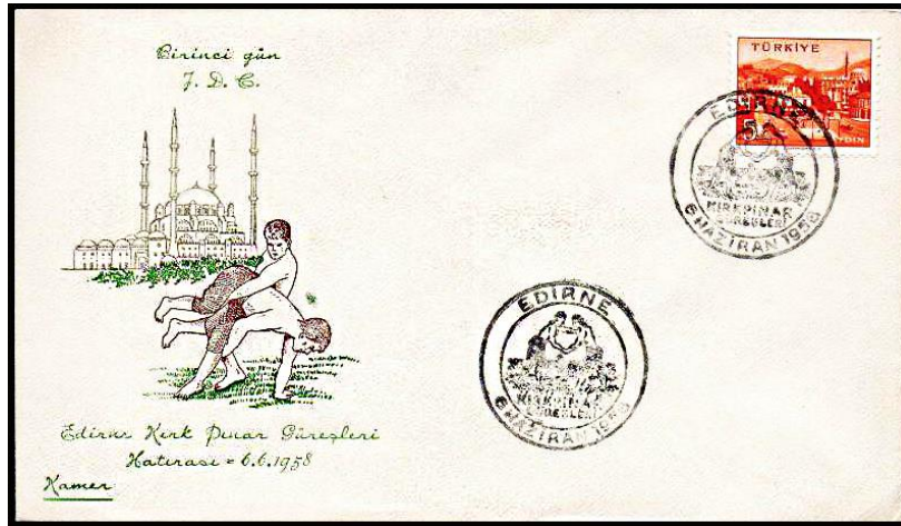
Şekil 2. Edirne Kırkpınar güreşleri temalı özel gün zarfı (Kitantik, t.y.)

Din, dil, kültür, bölge ve ırk ayrımı yapılmaksızın her yıl Edirne’de gerçekleşen Kırkpınar Yağlı Güreş Festivali 40 yaşını geçmemiş ve lisansı bulunan her yaş grubundan erkeğin katılabileceği bir etkinliktir (Resmî Gazete, 1998: 7; Kırkpınar Yağlı Güreş Şenliği, t.y.).