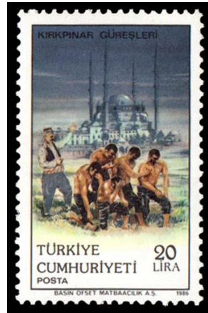
Şekil 5. Kırkpınar güreşleri temalı anma pulu (Kişisel Arşivden)

Kırkpınar Yağlı Güreş Festivali öncesinde altın kemer kentte gezdirilmekte, cuma namazı ile birlikte Selimiye Cami'nde dualar okunmakta sonrasında cazgır tarafından pehlivanların isim, unvan ve yetenekleri okunmak suretiyle her bir pehlivan dinleyicilere tanıtılmaktadır (Kırkpınar Yağlı Güreş Şenliği, t.y.).