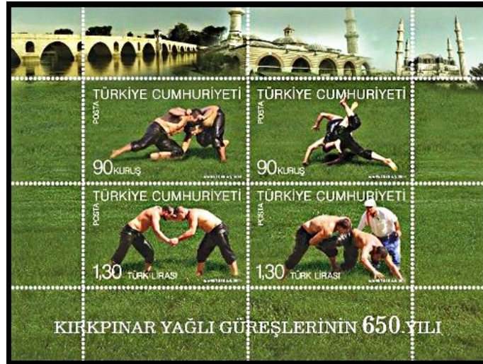
Şekil 8. Kırkpınar yağlı güreşlerinin 650. yılı temalı anma pulu (Pulhane, 2011)

Bir kişiyi veya belirli bir olayı anmak üzere çıkarılan ve üzerine genellikle o kişi veya olay ile alakalı motif ve resim bulunan zımbalı veya zımbasız pul tabakları anma bloku olarak işlem görmektedir (PTT Pul Müzesi, t.y.).