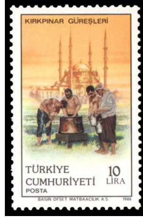
Şekil 6. Kırkpınar güreşleri temalı anma pulu

Geçmiş yıllardaki yağlanma işlemi yağ ibriğini taşıyan her bir ibrikçinin taşıdığı yağı, güreşçinin avuçlarına dökmesiyle karşılanmaktaydı. Tarihî bir geleneği yaşatmak adına Şevket Ödül'ün teklifiyle birlikte 1945 yılından sonra artık kazanın başına gelen başpehlivanların (0) asit zeytinyağıyla önce kendilerini sonrasında ise rakiplerinin sırtını yağlaması uygulaması başlatılmıştır (Kahraman, 1997: 132).