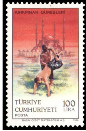
Şekil 4. Kırkpınar güreşleri temalı anma pulu (Kişisel Arşivden)

Görsel 4, 5 ve 6'da 30.06.1986'da PTT tarafından tedavüle çıkarılan ve Kırkpınar güreşleri başlıklı çalışmayı oluşturan 100+20+10 ETL bedelli anma pullarına yer verilmiştir. Baskı sayısı 600.000 olan ve 100'lü tabakalar hâlinde bastırılan seri 3 puldan oluşmaktadır. Basın Ofset Matbaacılık A.Ş. Ankara adresinde baskıya çıkarılan pulların grafik tasarımını ise Baber Kocamanoğlu yapmıştır (Pulhane, 1986).