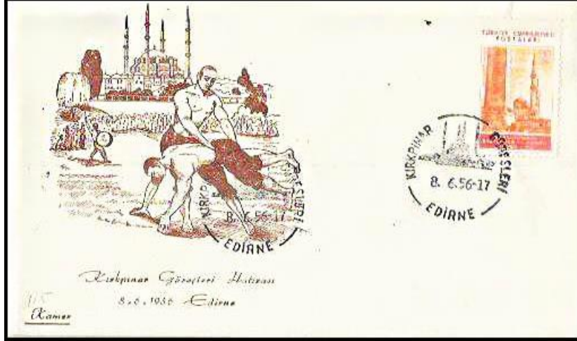
Şekil 1. Kırkpınar güreşleri hatırası temalı özel gün zarfı (Kitantik, 2019)

Şekil 1’de 08.06.1956’da Kırkpınar güreşleri hatırası başlığıyla yayımlanmış olan Kamer antetli bir adet özel gün zarfına yer verilmiştir (Kitantik, 2019). Yatay formata sahip olana bu tasarımın sağ üst kısmına X. Milletlerarası Bizans Tetkikleri Kongresi anısına bastırılan Sultan Ahmet Cami ve Dikilitaş temalı pul yerleştirilmiş iken sol kısmına Selimiye Cami görseli ve belden kavrama pozisyonu ile iki elinin üzerine duran bir güreşçi ve onu yakalayan diğer güreşçinin figürü yerleştirilmiştir. Kırkpınar er meydanını çevreleyen izleyiciler ve bir de davulcu figürü tasarımın fonunu oluşturmaktadır. Ayrıca hem pulun hem de tasarıma konu olan görselin üzeri içeriğe uygun olarak hazırlatılan 08.06.1956-17 tarih ve Kırkpınar güreşleri-Edirne temalı bir damga örneği ile mühürlenmiştir.