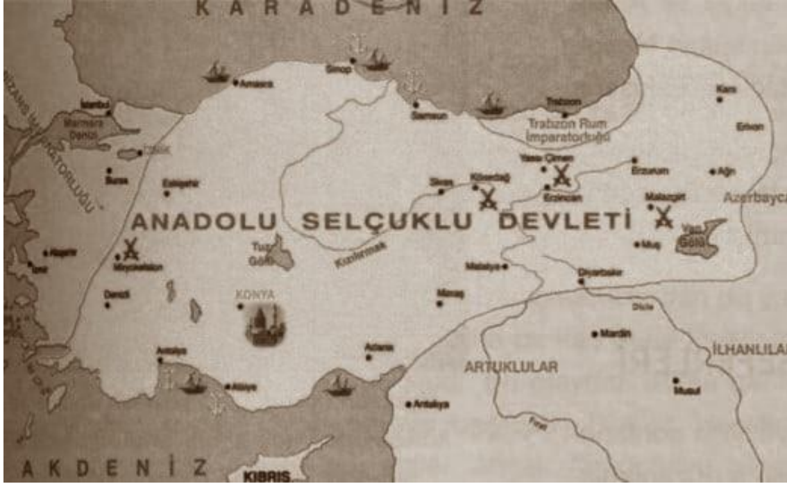
Harita 1. Anadolu Selçuklu Devleti sınırları (1243)