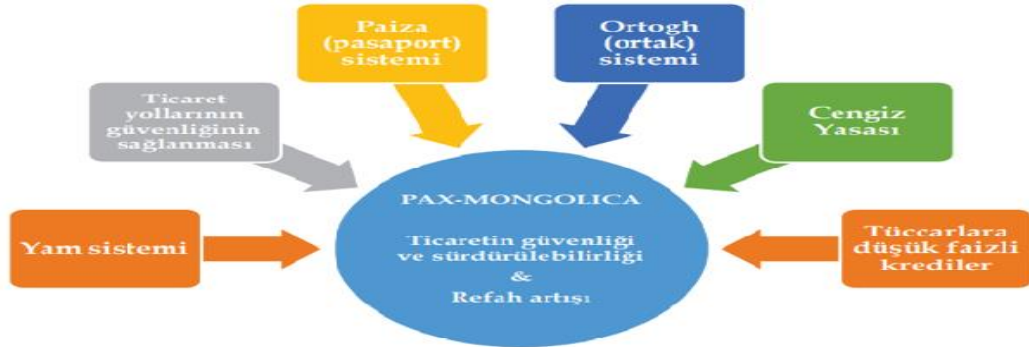
Şekil 1. Moğolların ticaretin güvenliği ve sürdürülebilirliği için uyguladığı politikalar

Kaynak: (Tuğrul ve Korkut, 2021, s. 165).