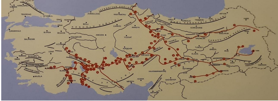
Harita 2. Anadolu Selçuklu dönemi başlıca ticaret merkezleri, kervansarayları ve kervanyolları

Ankara ve Konya üzerinden Karadeniz'de Sinop limanına; Malatya, Sivas ve Erzurum üzerinden de Tebriz, Bağdat ve Basra'ya kadar ulaşıyordu (Özergin, 1965, s. 141-170; Turan, 1946, s. 166-167). Ayrıca İstanbul'dan başlayarak Anadolu'yu diagonal geçen bir geçiş güzergâhı da bulunmaktaydı. İstanbul'dan İzmit'e; oradan İznik, Eskişehir, Ankara, Toros geçitleri, Kilikya ve Amanos geçitleri üzerinden Suriye'ye ulaşıyor veya yine İzmit, İznik, ve Eskişehir'den sonra Konya üzerinden Toros ve Amanos geçitleriyle Suriye'ye varıyordu (Bektaş, 1999, s. 17).