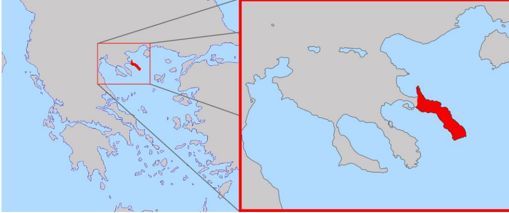
Fig. 1 Aynoroz Özerk Keşişsel Devleti coğrafi konumu

Dünyada inanç gereği kadınların girişlerine izin verilmeyen alandan birisi de Aynoroz'dur. Tüm kadınların girişine kapalı olan Japonya'daki Omine Dağı ya da 10 – 50 yaş aralığındaki kadınların girişine izin verilmeyen Hindistan'daki Sabarimala Tapınağı gibi bu yasağa dinî hassasiyetler gerekçe gösterilmiş olsa da Aynoroz'un boyutu, kıyas kabul etmeyecek derecede büyüktür. Aynoroz Yarımadası, Kalkediki Yarımadası'nın en doğu kolunun neredeyse tamamını kapsamakta ve yaklaşık 33.000 hektarlık bir alana yayılmaktadır (Fig. 1).