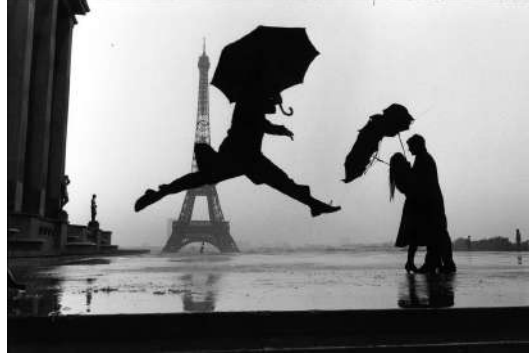
Görsel 2. Elliott Erwitt, "Umbrella Lump", Paris, 1989 (Magnum Photos koleksiyonu), Analog fotoğraf.

incelenmesi, seçilen konuda en iyi görüntünün hangi açıdan alınabileceği, bu kareyi daha etkili hale getirmek için hangi nesnelere dâhil edilmesi veya çıkarılması gerektiği, hikâye anlatımında etkin bir rol oynayabilir.