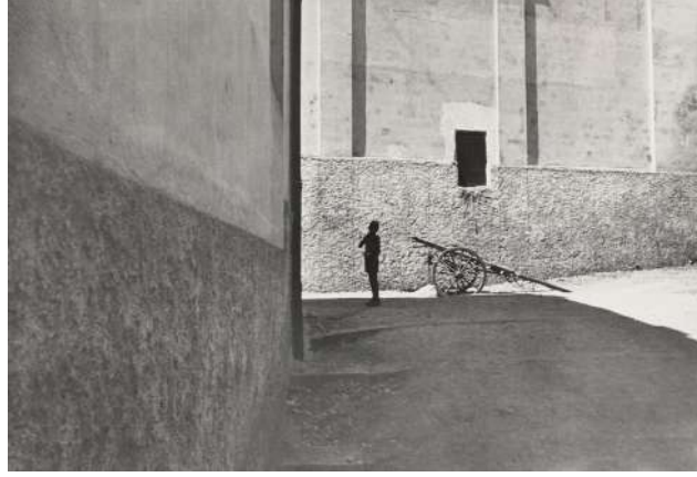
Görsel 1. Henri Cartier-Bresson, "Salerno", 1933, Analog fotoğraf, Moma, New York.