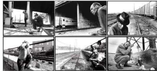
Görsel 8. Life Force Magazine internet sitesinden alınan görsellerden oluşturulmuş bir kolaj.

Henri Cartier-Bresson, Robert Frank and W. Eugene Smith gibi öncü sanatçılardan ilham aldığını sık sık dile getiren sanatçının "End of the Line" serisi siyah beyaz filmlere tam çerçeve (full frame) fotoğraf makinesi ile çekilmiş fotoğraflardan oluşmaktadır. Sanatçı, on yıl boyunca hayatını tren raylarında dolaşırken her yerden yük trenleriyle Los Angeles'a gelen serserilerle konuşup onların yaşamını belgelemek üzerine kurmuştur (Görsel 8).