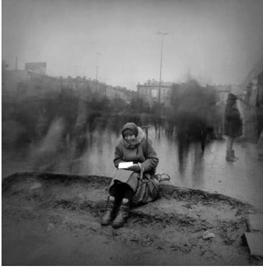
Görsel 4. Alexey Titarenko "Begging Woman", St. Petersburg, 1999, Analog fotoğraf.

edilebilir. Deklanşör hızı, çevredeki hareket eden nesnelere veya karakterleri bulanıklaştıracak veya odak dışında bırakacak şekilde yavaş ayarlanırsa, sabit duran veya yavaş hareket eden öğeler ilgi odağı haline gelebilir (Görsel 4).