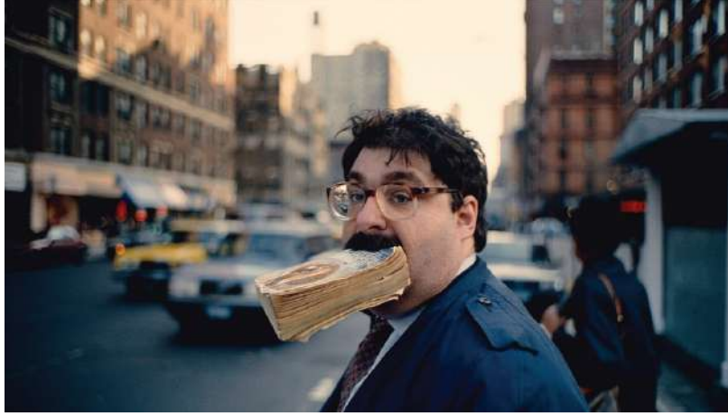
Görsel 6. Jeff Mermelstein, New York City, 1993, Dijital Fotoğraf.

merkezlerinde çoğu zaman her yaşta ilginç karakterler bulunur (Görsel 6).