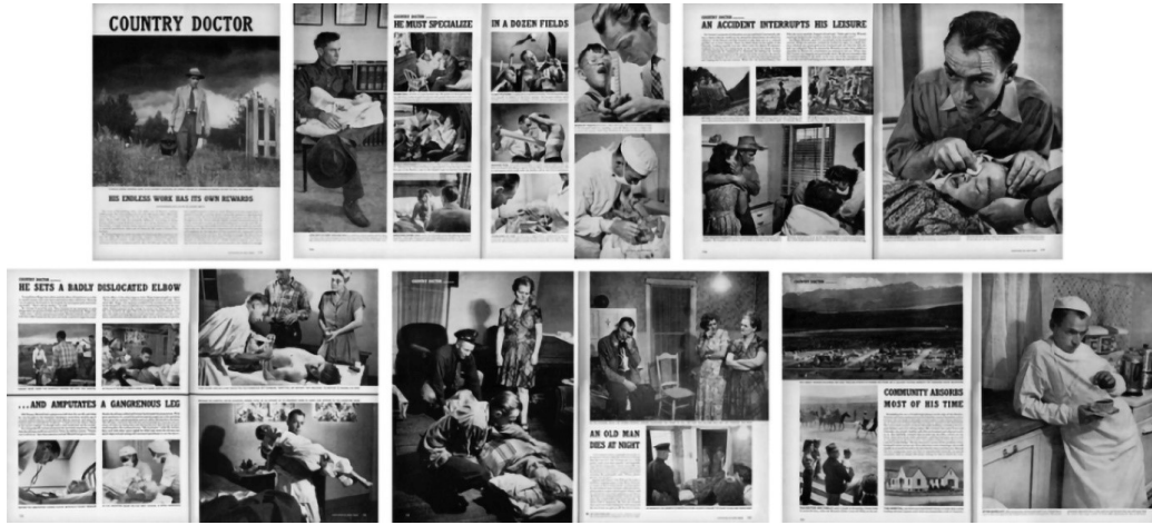
Görsel 7. Life Dergisinde basılan "Country Doctor" serisi sayfalarından hazırlanmış bir kolaj.

fotoğraflar aracılığı ile yeni bir anlatı türü ortaya çıkmıştır (Görsel 7).