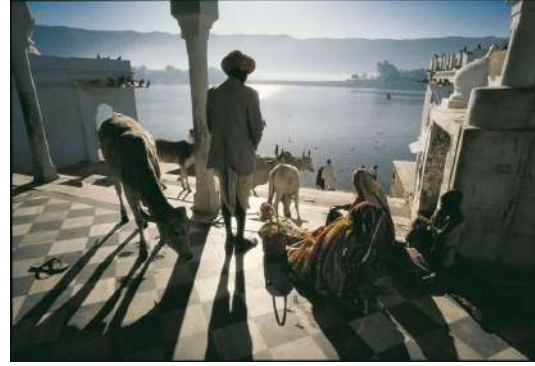
Görsel 5. Ara Güler, Hindistan, 1988, Analog fotoğraf.

de kalmazdı (Eagleton, 1990: 206). Noksanlık, yani hikâyenin tamamlanmamış olması ve devam etmesi gerginlik yaratarak izleyiciyi düşünmeye, yorumlamaya ve tartışmaya teşvik edebilir.