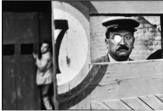
Görsel 3. Henri Cartier-Bresson, "Roman Amphitheater", Valensiya, İspanya, 1933, Analog fotoğraf.

Bir başka yöntem olarak bulanıklaştırma efektiyle de yukarıdakine benzer bir yanılısma elde