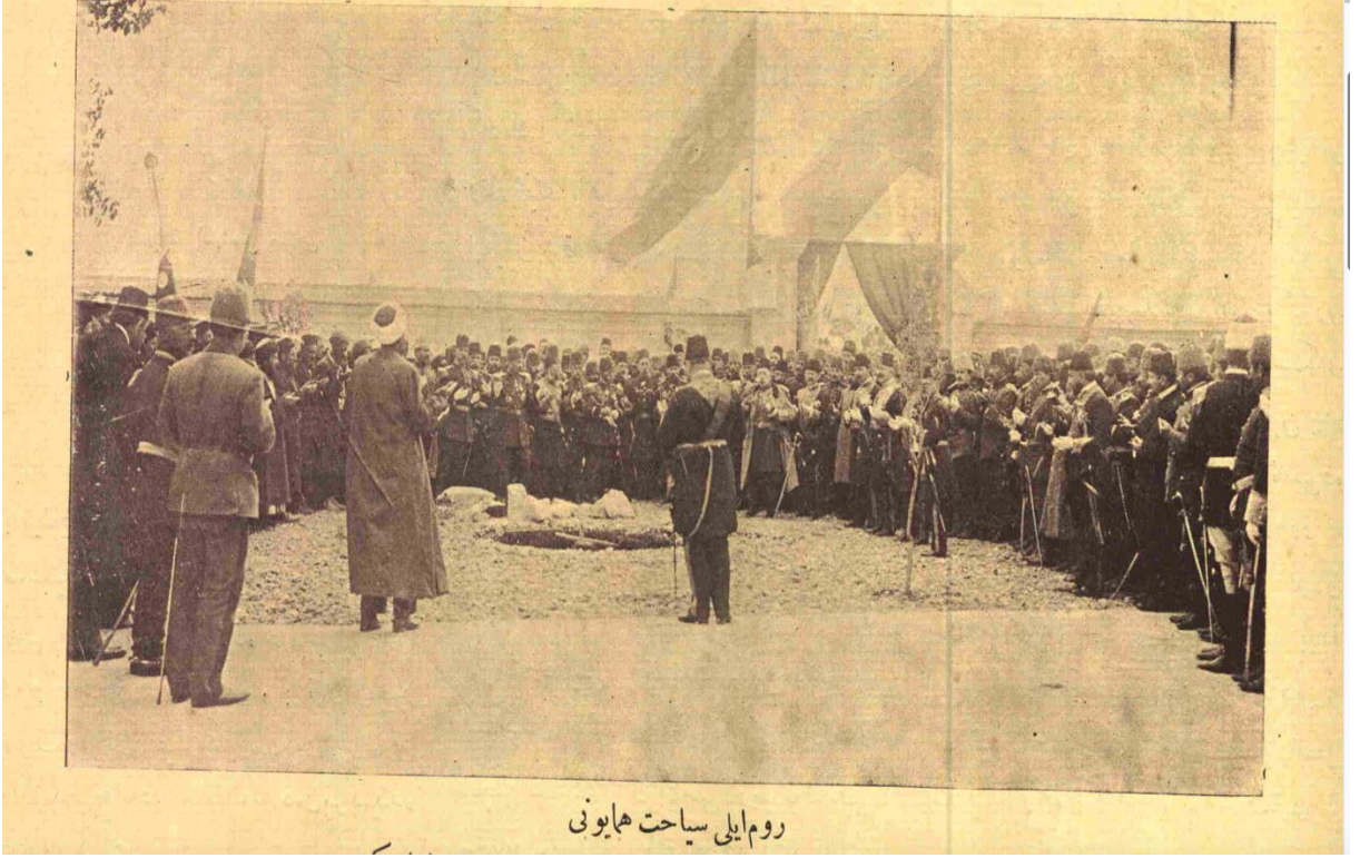
روم ایلی سیاحت همایونی